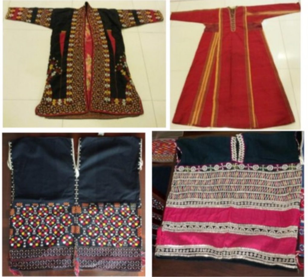
ผลงานสะสม : ชุดชนเผ่าวัฒนธรรม ทั้งในประเทศและ ต่างประเทศ