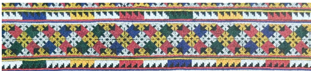
ลายพินเลื่อย

ลายเหว หรือลายพินเลื่อย มีลักษณะซิกแซกสลับขึ้นลงดูคล้ายพินเลื่อยชาวเมียนจะปักลายเหวนี้ที่บริเวณชายขอบผ้า เช่น ปลายขอบขากางเกง ผ้าโพกหัวหรือผ้าคาดเอวสตรี หรือเป็นลายคั่นระหว่างลายหนึ่ง กับอีกลายหนึ่งทั้งนี้เพราะชาวเผ่าเมียนมีความเชื่อที่สืบทอดมาแต่โบราณว่าเป็นลายที่จะช่วยป้องกันและกันสิ่งที่เป็นอันตรายหรือสิ่งที่ไม่ดีไม่ให้เข้ามาใกล้ร่างกายแก่ผู้ที่สวมใส่ได้ผ้าปักชนเผ่าเมียนทุกเผ่าจึงมีลายเหวหรือลายพินเลื่อยปรากฏอยู่