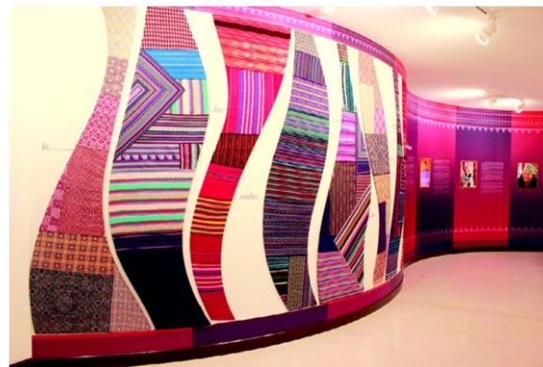
ห้องจัดแสดงช่างศิลปาชีพชาวไทรโยค

ขณะที่ห้องถัดไปจะเป็น หอวัตถุศิลป์ แสดงผลงานศิลปะหัตถกรรมที่ถูกรังสรรค์ขึ้นใหม่ เป็นการผสมผสานของศิลปะ ความคิดสร้างสรรค์กับทักษะฝีมือเชิงสูงและภูมิปัญญาของผู้ที่เชี่ยวชาญเฉพาะทาง โดยคำนึงถึงตลาด ประโยชน์ใช้สอย และความทันสมัย