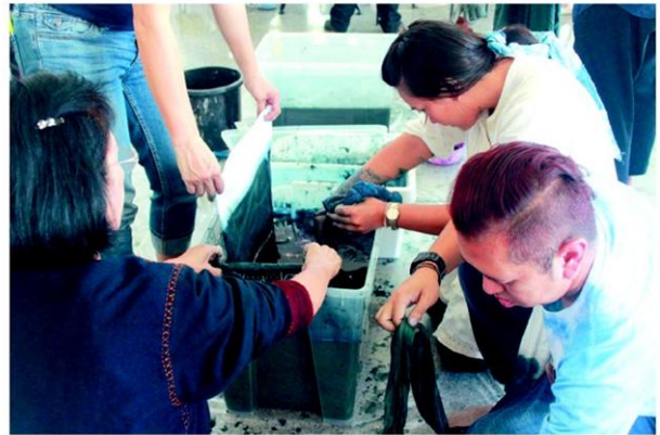
กิจกรรม Calm Khram

วิหารไปหาตัว ไปอาบ ไปกินเพื่อป้องกันโรค ปรากฏว่าหายจากโรคจริงๆจากความเชื่อและ เรื่องที่เล่าสืบต่อกันมาทำให้ชื่อเสียงของ หลวงพ่อดิ่งโด่งดังไปทั่วทุกสารทิศ