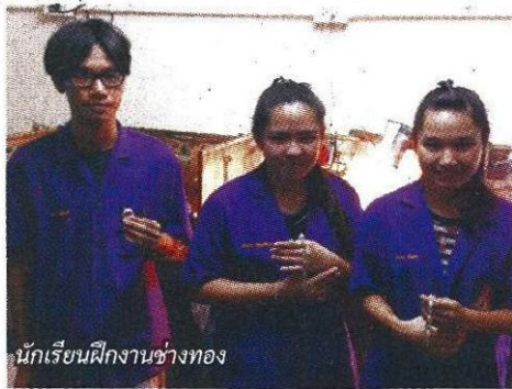
นักเรียนฝึกงานช่างทอง

งานศพ แต่ปัจจุบันได้พัฒนาการแทง หยวกในรูปแบบต่างๆ มาใช้ร่วมกับ งานมงคล เช่น เทศกาลสงกรานต์ งานบุญต่างๆ หรือประดับตกแต่ง สถานที่ในงานแต่งงาน งานบวช หรือแม้แต่งานคริสต์มาสของศาสนา คริสต์