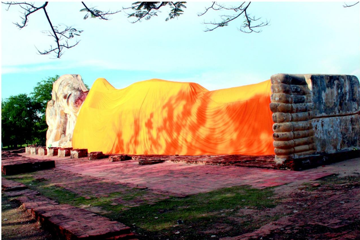
วัดโลกบสุธาราม

ทรงไทยสมัยโบราณ เป็นต้น ล้วนแล้วแต่เป็นผลิตภัณฑ์ที่ก่อให้เกิดรายได้ อีกทั้งยังเป็นการส่งเสริมและอนุรักษ์ศิลปวัฒนธรรมของไทยให้คงอยู่อย่างยั่งยืน