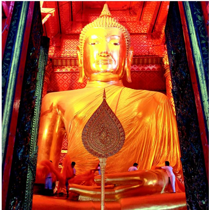
หลวงพ่อบุชาบอภย วัดพนัญชัย

เริ่มต้นเดินทางจากกรุงเทพฯ มุ่งหน้าสู่จุดหมายแรกใช้เวลาเพียงชั่วโมงเศษๆ ก็ถึงศูนย์ส่งเสริมศิลปาชีพระหว่างประเทศ อำเภอ บางไทร โดยมีเจ้าหน้าที่ให้การต้อนรับอย่างอบอุ่น พร้อมพารับชมวิถีทัศน์ที่เกี่ยวข้องถึงผลงานภายในอาคาร ก่อนจะนำทุกคนเข้าสู่ตัวอาคารที่แบ่งสัดส่วนไว้ทั้งหมด 5 หอ โดยจุดแรก ณ หอศิลปาชีพจัดแสดงผลงาน 4 ภาค ทั้งภาพวาด กระจกראสาน งานเครื่องปั้นผ้าไหมลายไทยงานแกะสลักเรือกอลและ เครื่อง