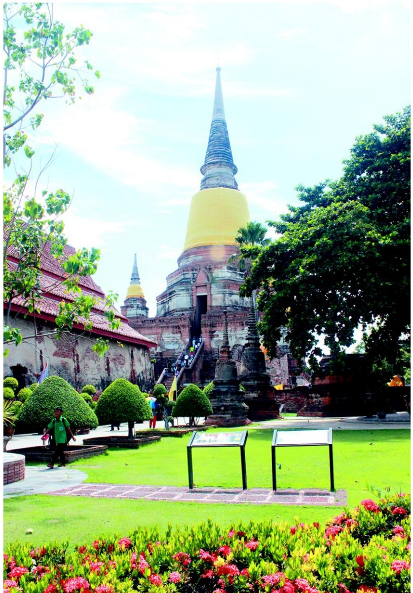
วัดไชยวัฒนาราม

ตะวันบ่ายคล้อย ระหว่างเดินทางกลับ ที่พัก แวะสักหนึ่งวัด คือ