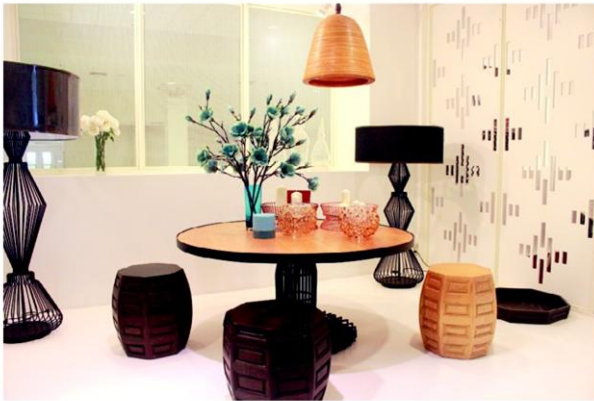
หอนวิจิตรศิลป์