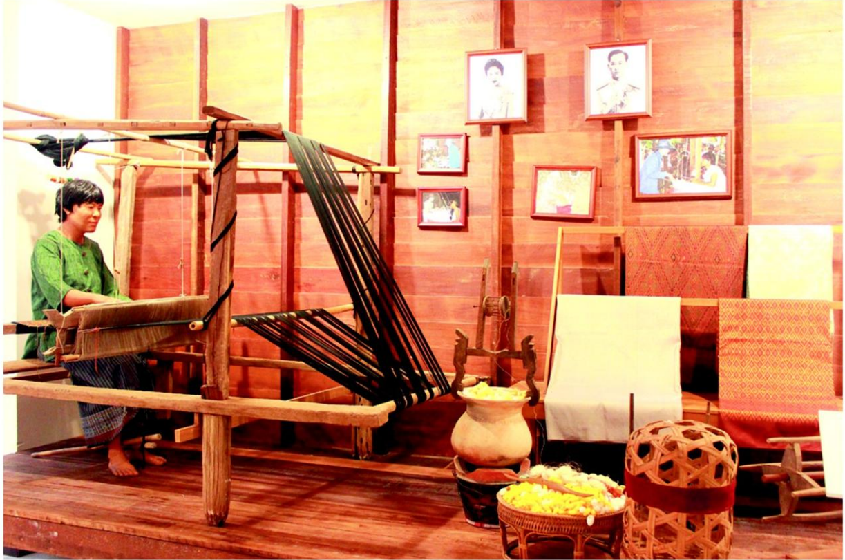
หอศิลปาชีพวัดเลียบพลาน 4 ภาค

ศิลปินที่มีการคัดเลือกขึ้นทุกปี โดยภายในห้อง จะมีการแสดงผลงานและผู้สร้างสรรค์อย่างละเอียด และทอสุดท้าย จัดแสดงเครื่องแต่งกายยุคสมัยเก่าของ 10 ประเทศอาเซียน ที่มีความแตกต่างกันออกไปไม่ว่าจะเป็นเรื่องของเนื้อผ้า ลายผ้า รวมไปถึงการแต่งกายในแต่ละชนเผ่าแต่ละประเทศ ที่ถูกนำมารวบรวมไว้ ณ สถานที่แห่งนี้