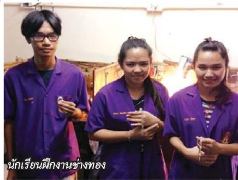
นักเรียนฝึกงานช่างทอง

งานศพ แต่ปัจจุบันได้พัฒนาการแทงหยวกในรูปแบบต่างๆ มาใช้ร่วมกับงานมงคล เช่น เทศกาลสงกรานต์ งานบุญต่างๆ หรือประดับตกแต่งสถานที่ในงานแต่งงาน งานบวช หรือแม้แต่งานคริสต์มาสของศาสนาคริสต์