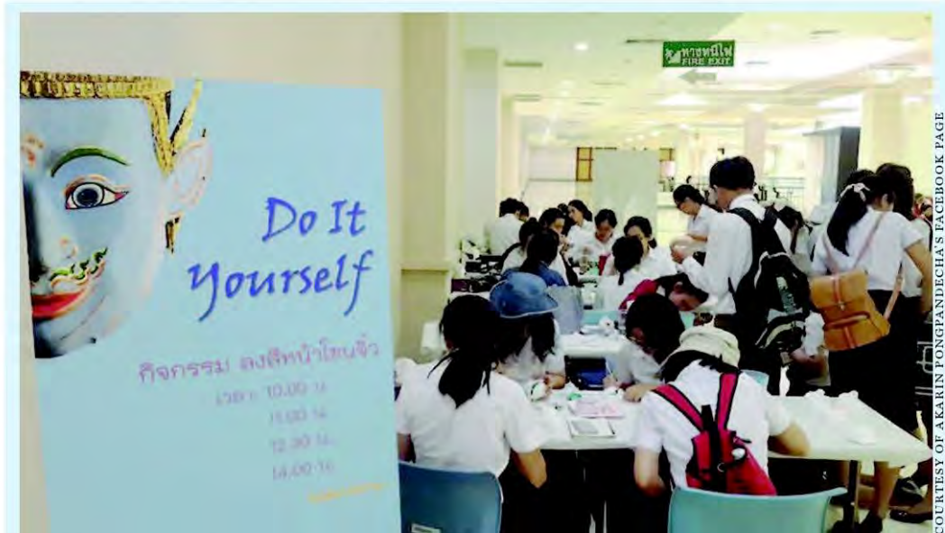
Students join a workshop on Khon mask painting during their recent visit to an exhibition about Khon at the Support Arts and Craft International Centre of Thailand in Ayutthaya's Bang Sai district. The exhibition runs until October 31 before moving to two other locations.