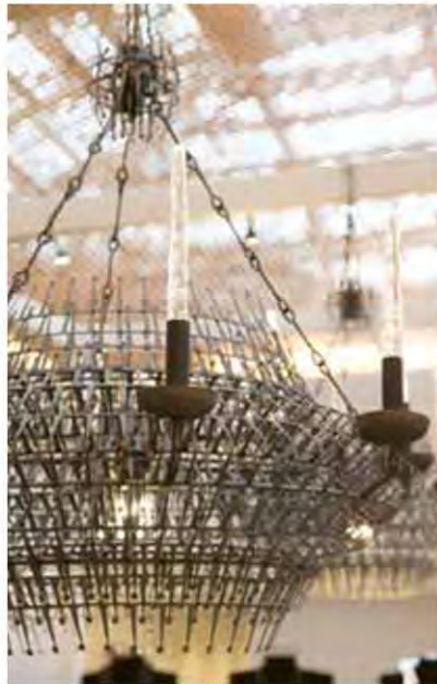
โคมไฟโลหะรีไซเคิล