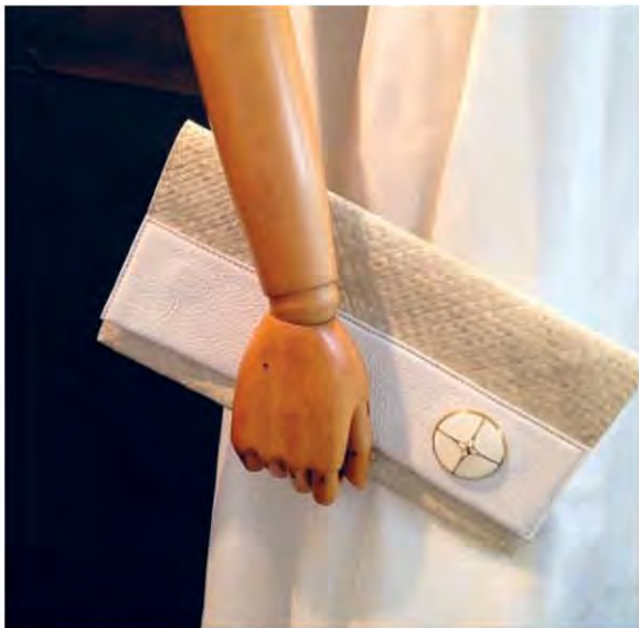
▲ กระเป๋าถือสานจากเตาปahnจากตรังประดับโลหะลงยาฝีมือช่างชุมชนตรอกหม้อ เสาชิงช้า