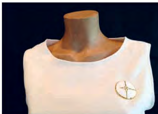
» เข็มกลัดลงยาสีขาว ฝีมือช่างชุมชนตรอกหม้อ เสาชิงช้า