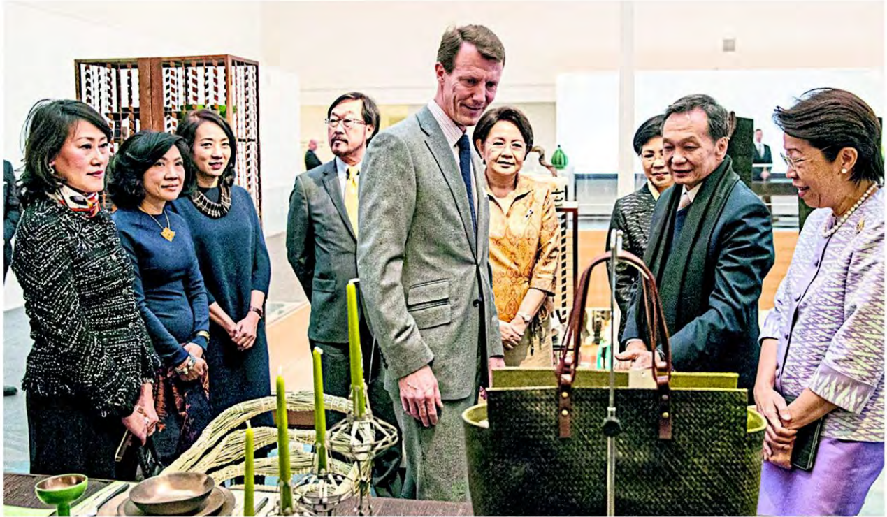
HRH Prince Joachim of Denmark visiting the 'Thai Artistry: The Living Heritage' exhibition.