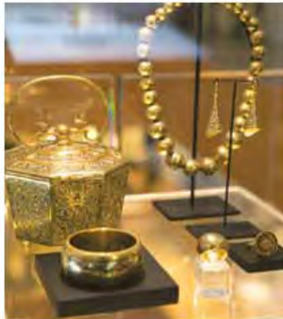
เครื่องลงรักปิดทอง

นิทรรศการแสดงผลงานด้านหัตถคิลปีไทย ร่วมสมัย Thai Artistry : The Living Heritage จัดแสดงทั้งสิ้น 165 รายการ ซึ่งผลงานจาก ไซไซตีไซไซตีรุ่นใหม่ และช่างฝีมือของไทย อาทิ