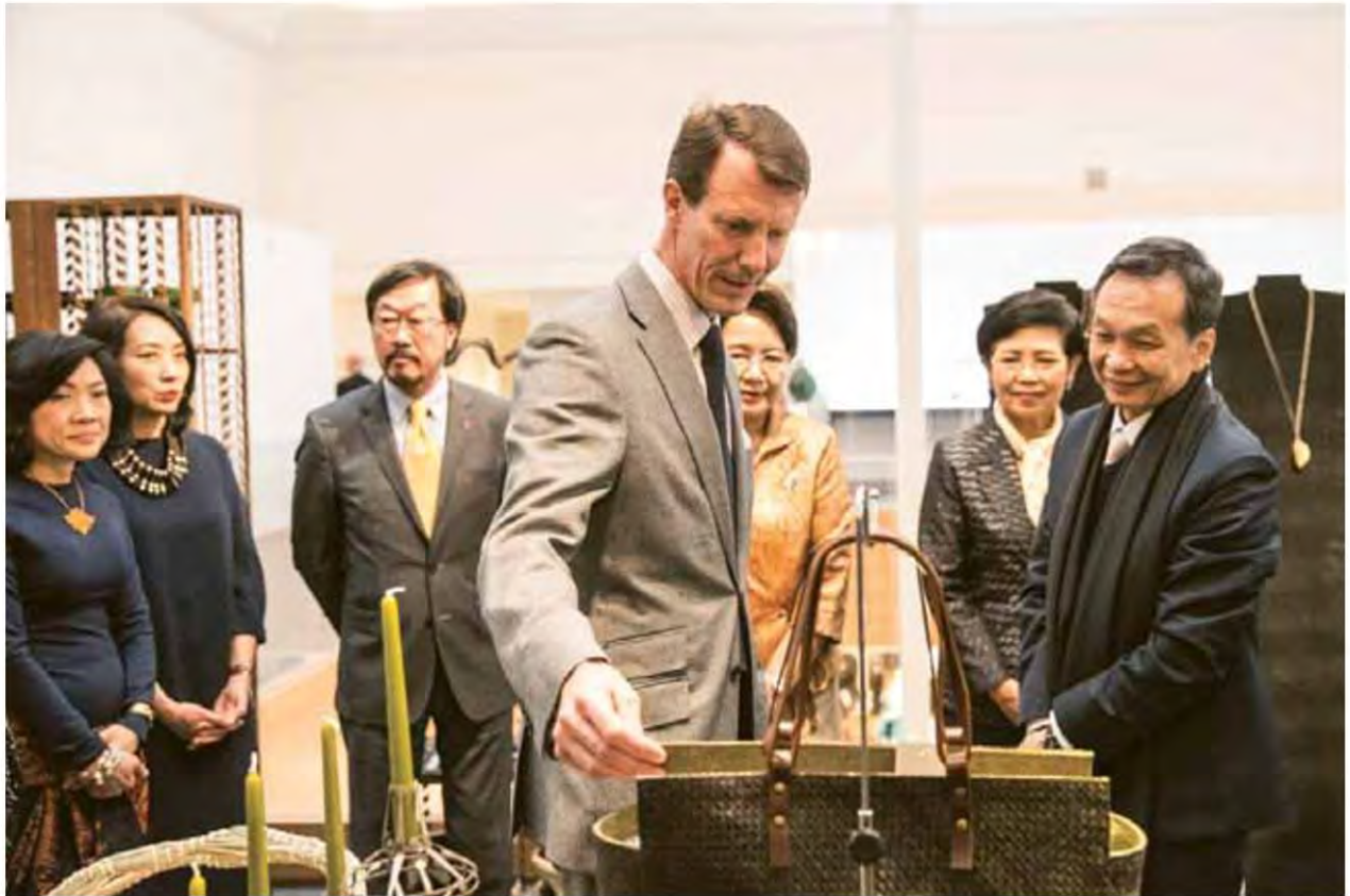
เจ้าชายโยคีมทรงเยี่ยมชมนิทรรศการ

นับ เป็นเวลาเกือบ 4 ศตวรรษ หรือราว 394 ปีที่ความสัมพันธ์ ไทย-เดนมาร์ก ได้ดำเนินมาอย่างยาวนาน บนพื้นฐานของ มิตรภาพอันดีระหว่างสองประเทศ โดยการ แลกเปลี่ยนด้านเศรษฐกิจ การค้าการลงทุน ศิลปะ และวัฒนธรรม