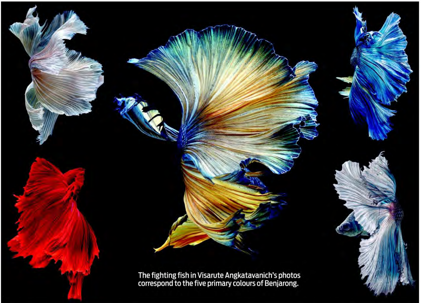
The fighting fish in Visarute Angkatavanich's photos correspond to the five primary colours of Benjarong.

breathhtakingly beautiful portraits of them.