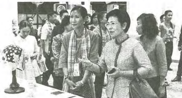
กอบกาญจน์ วัฒนวรางกูร รวบรวมกระทรวงการท่องเที่ยวและกีฬา เยี่ยมชมการประชุมเชิงปฏิบัติการ หัตถศิลป์ไทย