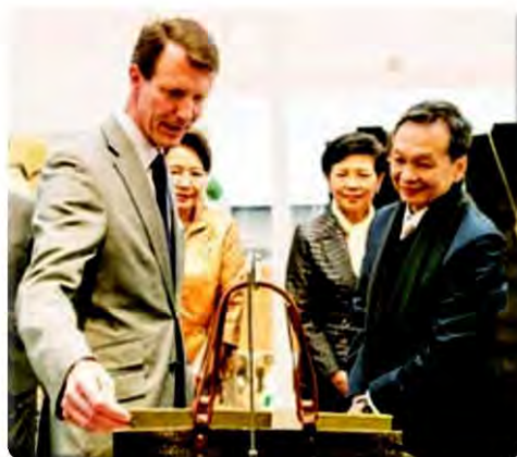
เจ้าชายโยคินทรวงเยียนบนนิทรรศการ