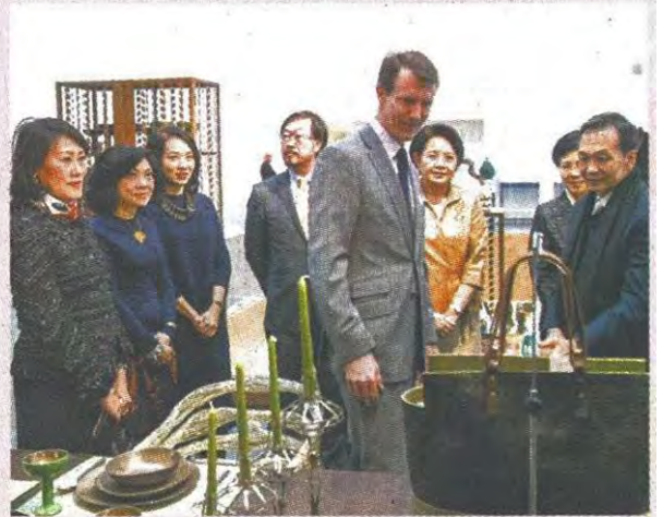
สุทธธีธรรม จิราธิวัฒน์ นำทีม สุพัตรา-ชวดี-บุษบา-ปริญญ์-ทศ-ศุกดา-อาคาร จิราธิวัฒน์, รับเสด็จ เจ้าชายโยคิม เจ้าชายโยคิมทอดพระเนตรนิทรรศการฯ

เพื่อเป็นการเฉลิมฉลองความสัมพันธ์อันแน่นแฟ้น และเผยแพร่มรดกแห่งหัตถศิลป์ไทยอันทรงคุณค่าสู่สากล บริษัท กลุ่มเซ็นทรัล จำกัด จึงได้ร่วมกับ สถานเอกอัครราชทูต ณ กรุงโคเปนเฮเกน, ศูนย์ส่งเสริมศิลปาชีพระหว่างประเทศ (องค์การมหาชน) และห้างสรรพสินค้าอิลลุม ในเครือกลุ่มเซ็นทรัล จัดนิทรรศการ Thai Artistry : The Living Heritage แสดงผลงานหัตถศิลป์ไทยร่วมสมัย สะท้อนความงดงามทางมรดกไทย ที่มีกลิ่นอายของความหรูหราและมีรสนิยม พร้อมทั้งจัดแสดง นิทรรศการเฉลิมพระเกียรติสถานสัมพันธ์ 2 แผ่นดิน บอกเล่าเรื่องราวความสัมพันธ์ระหว่างประเทศไทยและประเทศเดนมาร์ก ณ ห้างสรรพสินค้าอิลลุม กรุงโคเปนเฮเกน ประเทศเดนมาร์ก ซึ่งนับเป็นห้างสรรพสินค้าที่มีอายุเก่าแก่และได้รับความนิยมสูงสุดแห่งหนึ่งของชาวเดนิช บริหารงานโดยกลุ่มเซ็นทรัล ตั้งแต่วันที่ 1 พฤศจิกายน 2558 ในการนี้ ได้รับพระกรุณาธิคุณจาก เจ้าชายโยคิม โฮลเกอร์ วิลเดมาร์ คริสเตียน ประเทศเดนมาร์ก, เกานต์แห่งมวงเปอซา ทรงเป็นองค์ประธานในพิธีเปิดนิทรรศการ Thai Artistry : The Living