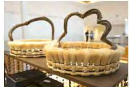
ตระกร้าไยสับปะรด