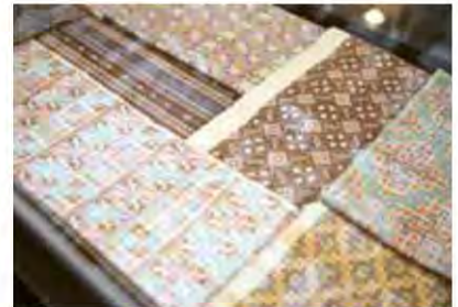
ผ้าทอลายไทย