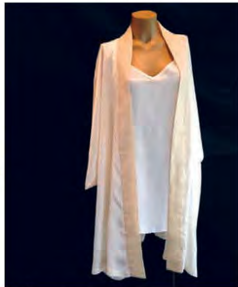
▲ เสื้อคลุมผ้าบาติกขาวบนขาว ผลงานครูช่างอินทร์ธร ดาหาลาบาติก