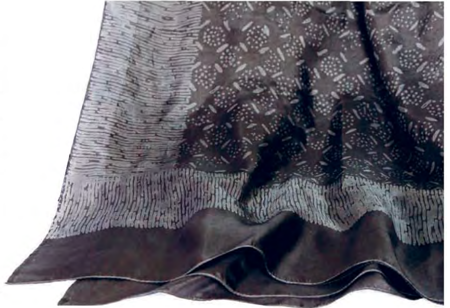
▲ ดำในดำ ที่ครูช่างบาติกพัฒนาต่อจาก ชาวในขาว

ส่วนผลงานของดาหาลาบาติก เข้าชมได้ทาง Facebook : ดาหาลาบาติกครูช่างอินทร์ธร ๘