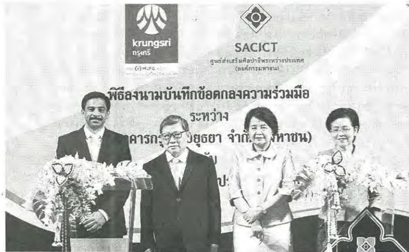
ส่งเสริม : ธนาคารกรุงศรีอยุธยา จำกัด (มหาชน) ลงนามร่วมกับ ศูนย์ส่งเสริมศิลปาชีพระหว่างประเทศ (องค์การมหาชน) หรือ ศ.ศ.ป. ในการส่งเสริมองค์ความรู้และผลิตภัณฑ์หัตถกรรมไทย ผ่านกิจกรรมต่างๆ ที่ร่วมมือกัน อาทิ การพัฒนาศักยภาพสมาชิกศ.ศ.ป.และเครือข่ายพันธมิตร ในด้านการบริหารจัดการระบบการเงินการเข้าถึงแหล่งเงินทุน เป็นต้น เพื่อให้สมาชิกศ.ศ.ป. สามารถนำความรู้ที่ได้รับมาใช้พัฒนาศักยภาพ