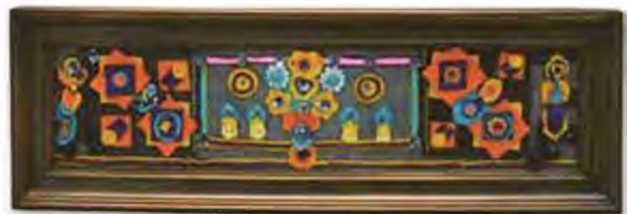
กระเบื้องถิ่น