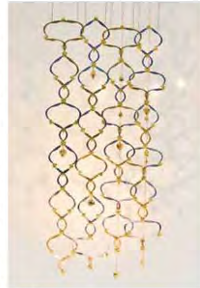
นับหนึ่ง

"ตอนนี้ประตูแห่งหัตถศิลป์โลกได้กว้างเปิดต้อนรับผลงานของนักออกแบบไทยเพราะเทรนด์ของผู้บริโภคทั่วโลกกำลังมองหาสินค้าที่มีคุณค่าในตัวเองที่สามารถเก็บและส่งต่อได้ ดังนั้นหากนักออกแบบรู้จักหยิบแรงบันดาลใจและเทคนิคพิเศษของงานหัตถศิลป์ไทยมาปรับใช้อย่างเหมาะสมก็จะช่วยเพิ่มมูลค่าให้ชิ้นงานมีเรื่องราวจากรากเหง้าวัฒนธรรมไทย ตัวผมเอง