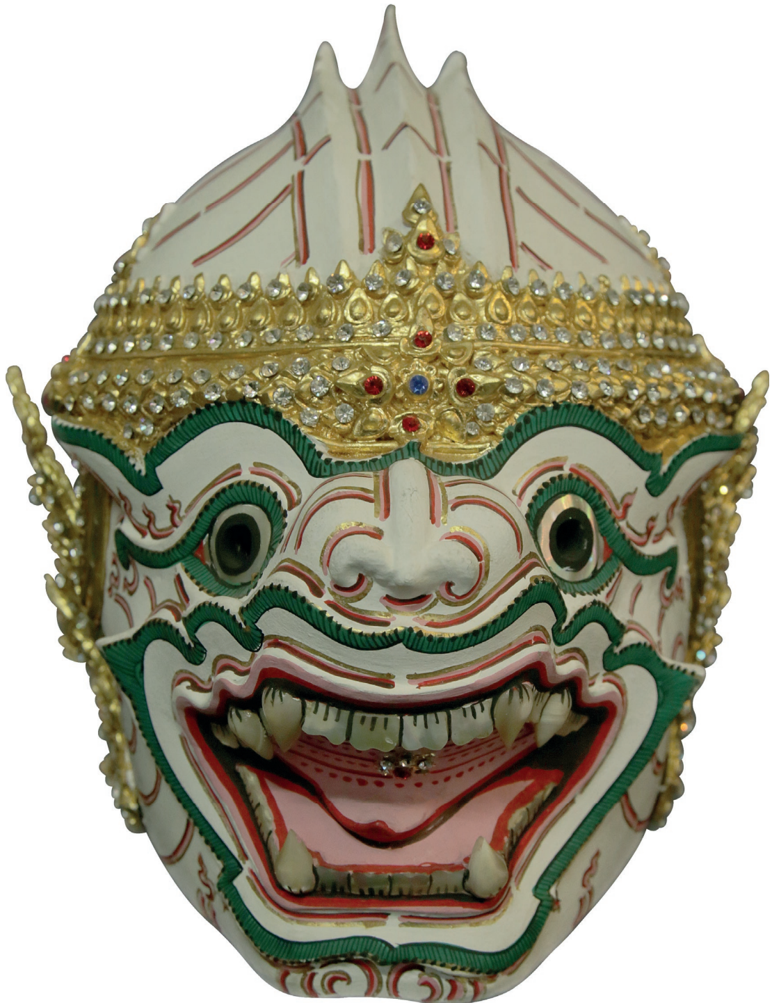
หัวโขนหนุมาน