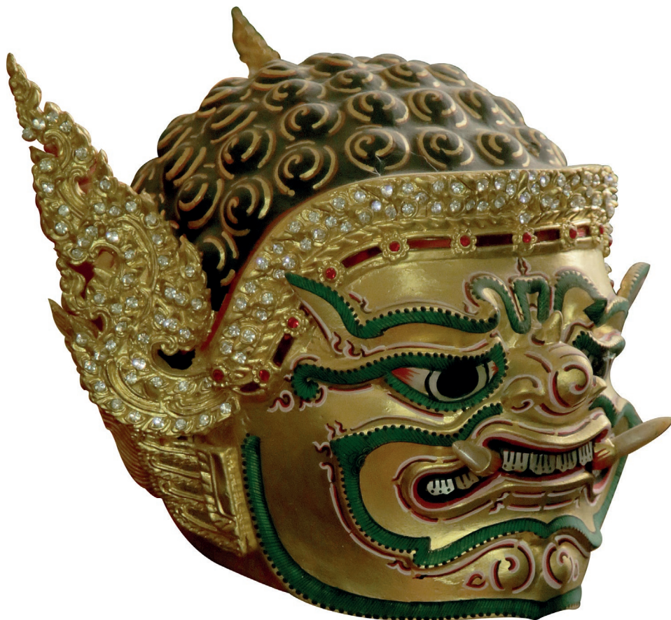
หัวโขนพระพิราพ

“หัวโขน” เป็นงานศิลปะชั้นสูง สร้างขึ้นเพื่อใช้เป็นหัวครอบส่วนศีรษะและใบหน้า ใช้ปิดบังใบหน้าผู้แสดงโขน เพื่อสวมบทบาทตามตัวละครเพื่อสวมใส่ในการแสดง “โขน” นาฏศิลป์ชั้นสูง มรดกทางวัฒนธรรมของชาติไทย การทำ “หัวโขน” นั้นถือเป็นงานหัตถศิลป์ที่มีความพิเศษแตกต่างจากงานศิลปหัตถกรรมแขนงอื่นๆ ด้วยความจำเพาะของระเบียบวิธีแห่งการช่างทำหัวโขนตามขนบนิยมอันมีมาแต่โบราณ ผู้ที่จะเป็นช่างหัวโขนได้ต้องมีความรู้ในเชิงช่างหลายอย่างซึ่งนอกจากฝีมือเชิงช่างแล้ว หัวโขนยังถูกกำหนดด้วยแบบแผน จารีต ของหัวโขน ไว้อย่างเคร่งครัดอีกด้วย เช่น สี และลักษณะของหัวโขน ซึ่งถ้าทำผิดไปจากที่ครูโบราณกำหนดไว้ก็ถือว่าผิดทั้งหมด ไม่ใช่หัวโขนหัวนั้นเลย การสร้างผลงานหัวโขนจึงล้วนแต่ต้องใช้ทั้งความรู้ ความประณีตละเอียดอ่อนในการรังสรรค์ เพื่อให้เกิดความถูกต้องตามเอกลักษณ์ของตัวแสดงและความงดงาม วิจิตรบรรจง