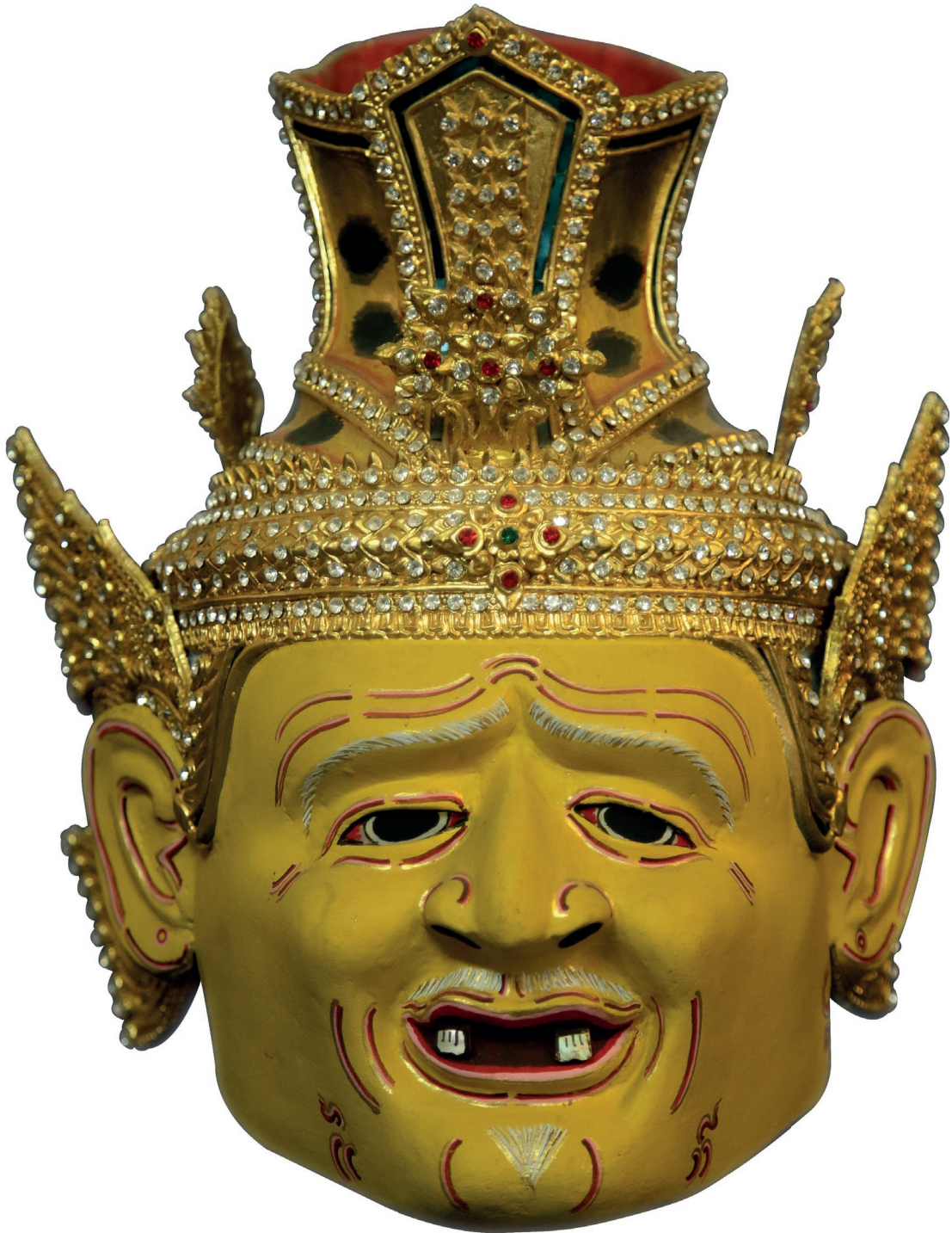
หัวโขนพ่อแก่