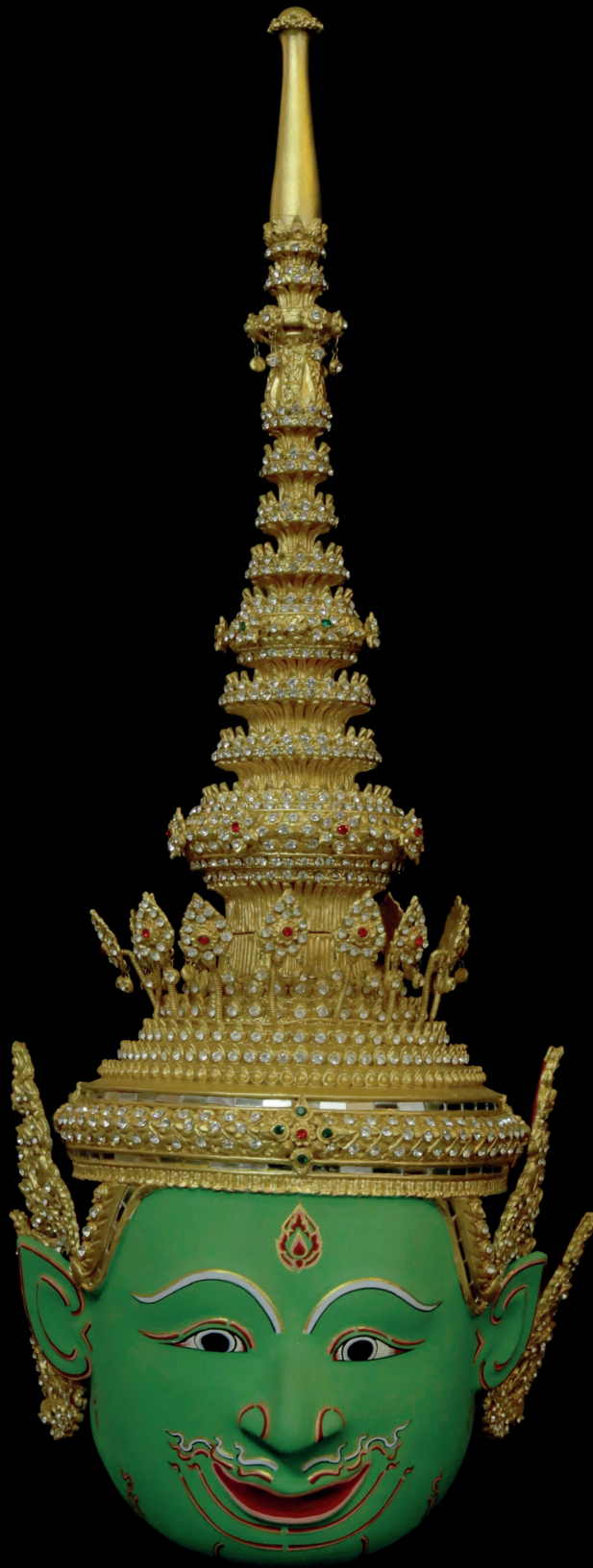
หัวโขนพระราม