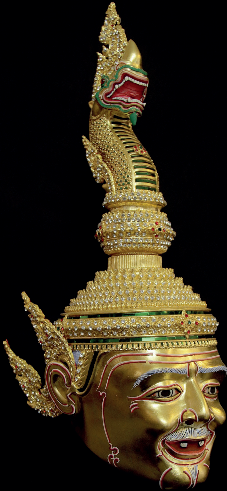
หัวโขนพ่อแก่นาคราช