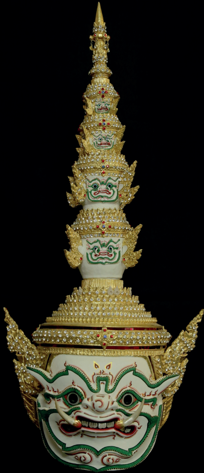
หัวโขนสหัสเดชะ