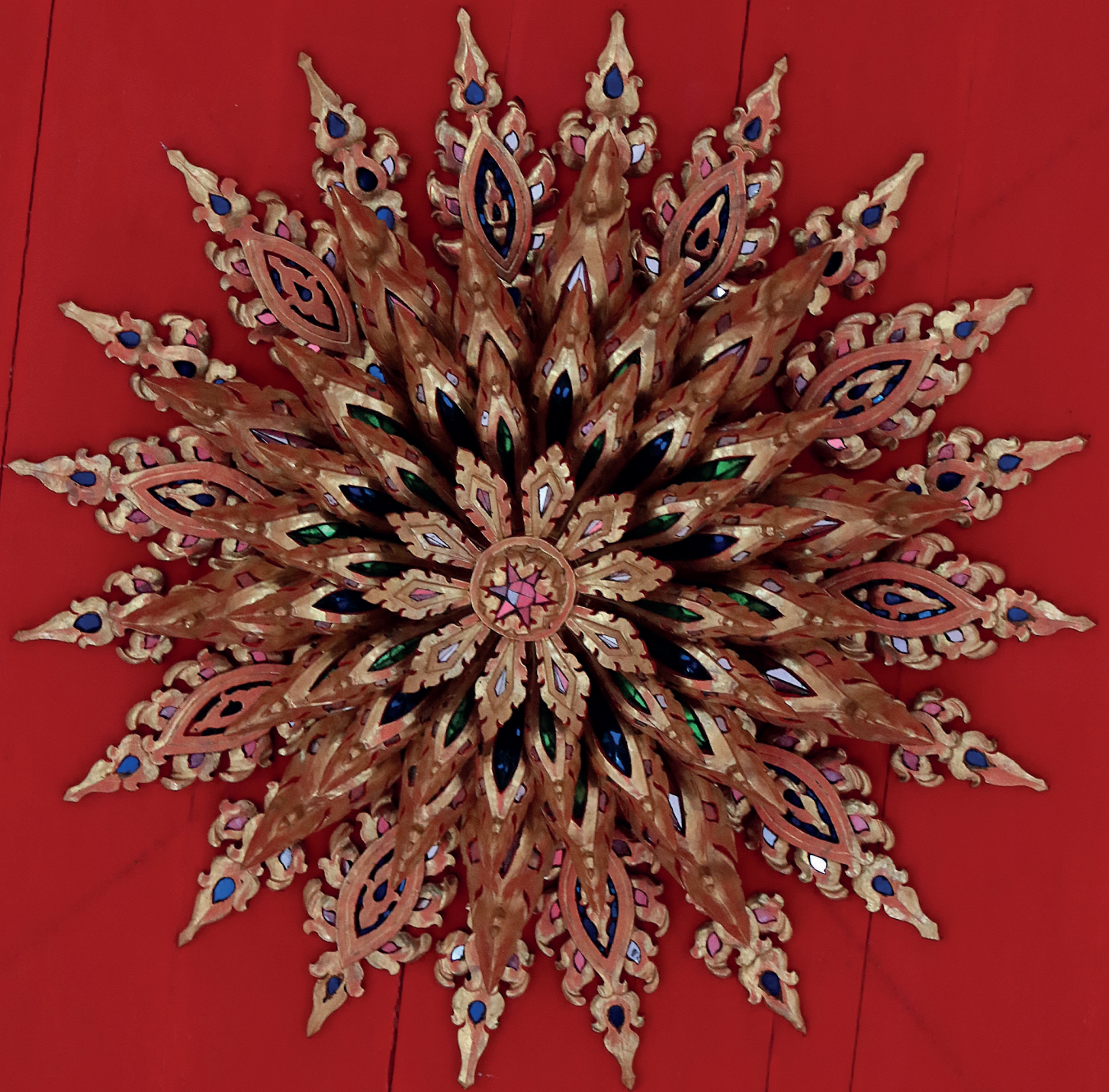
ดาวพาดาน