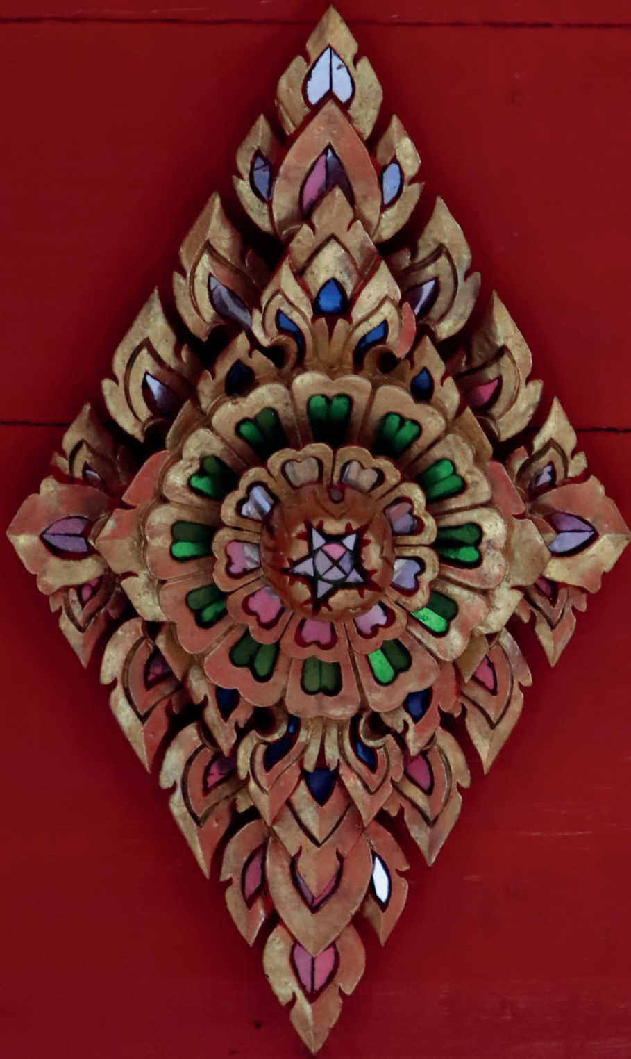
ดาวเพดาน ข้าวหลามตัด