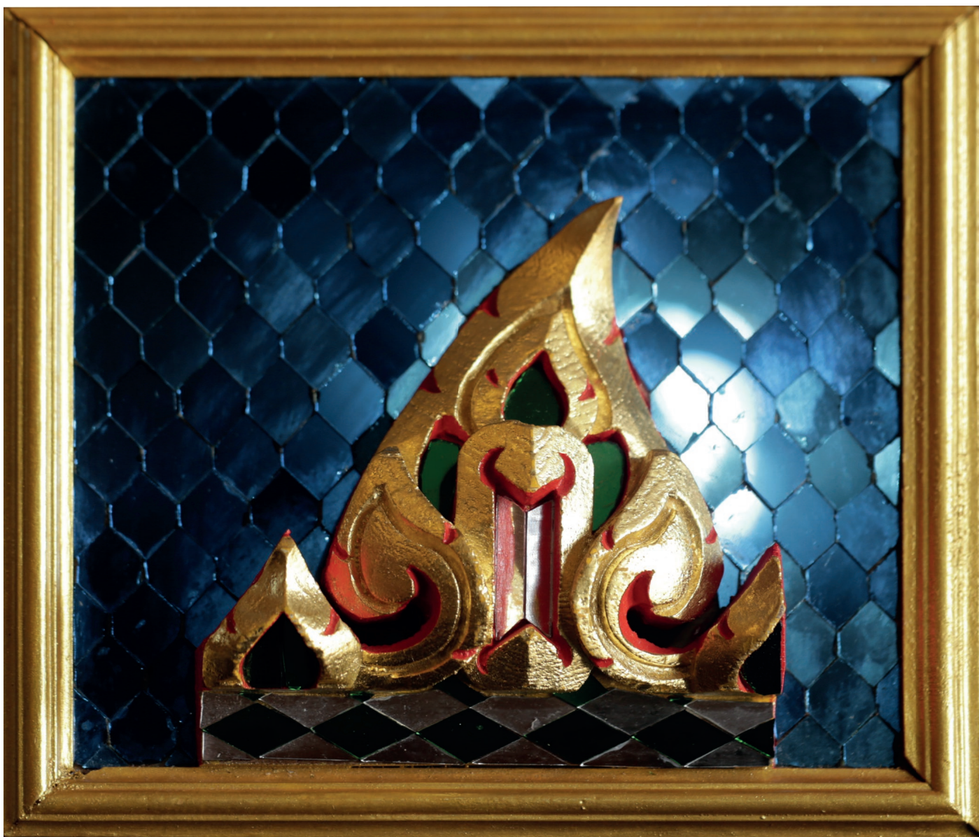
ลายไทยปิดทองประดับกระจก