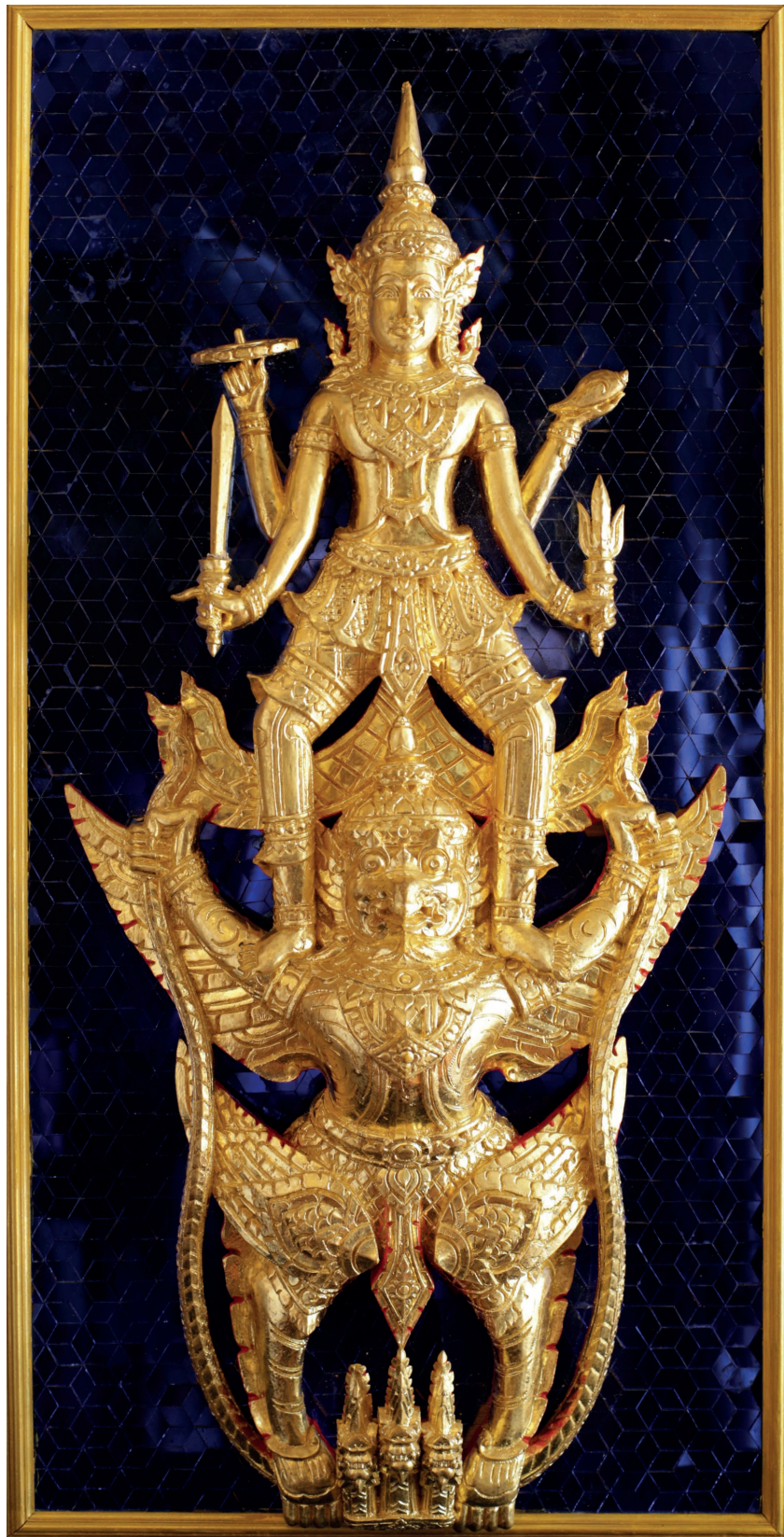
พระนารายณ์ทรงครุฑ ปิดทองประดับกระจก