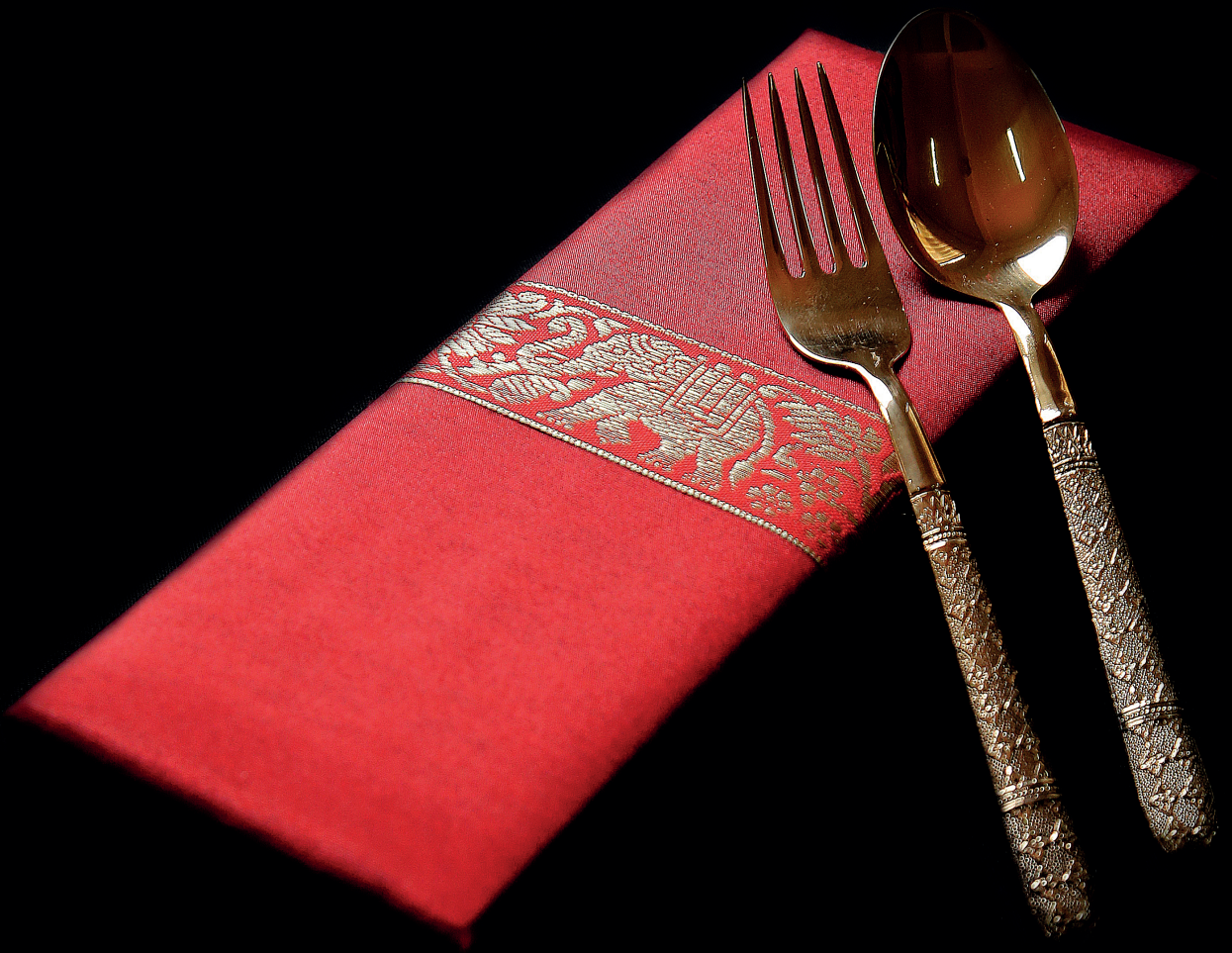
ชุดช้อนส้อม (ลายดอกพิกุล)