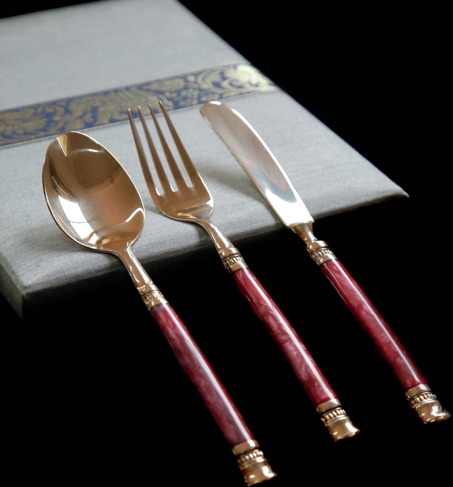
ช้อน ส้อม มีด ด้ามมุก