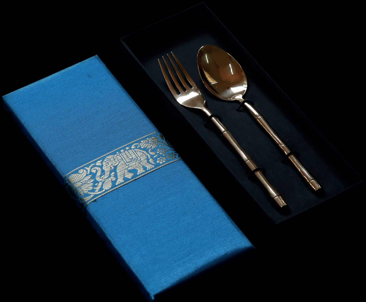
ชุดช้อนส้อม (ลายปล้องไม้ไผ่)