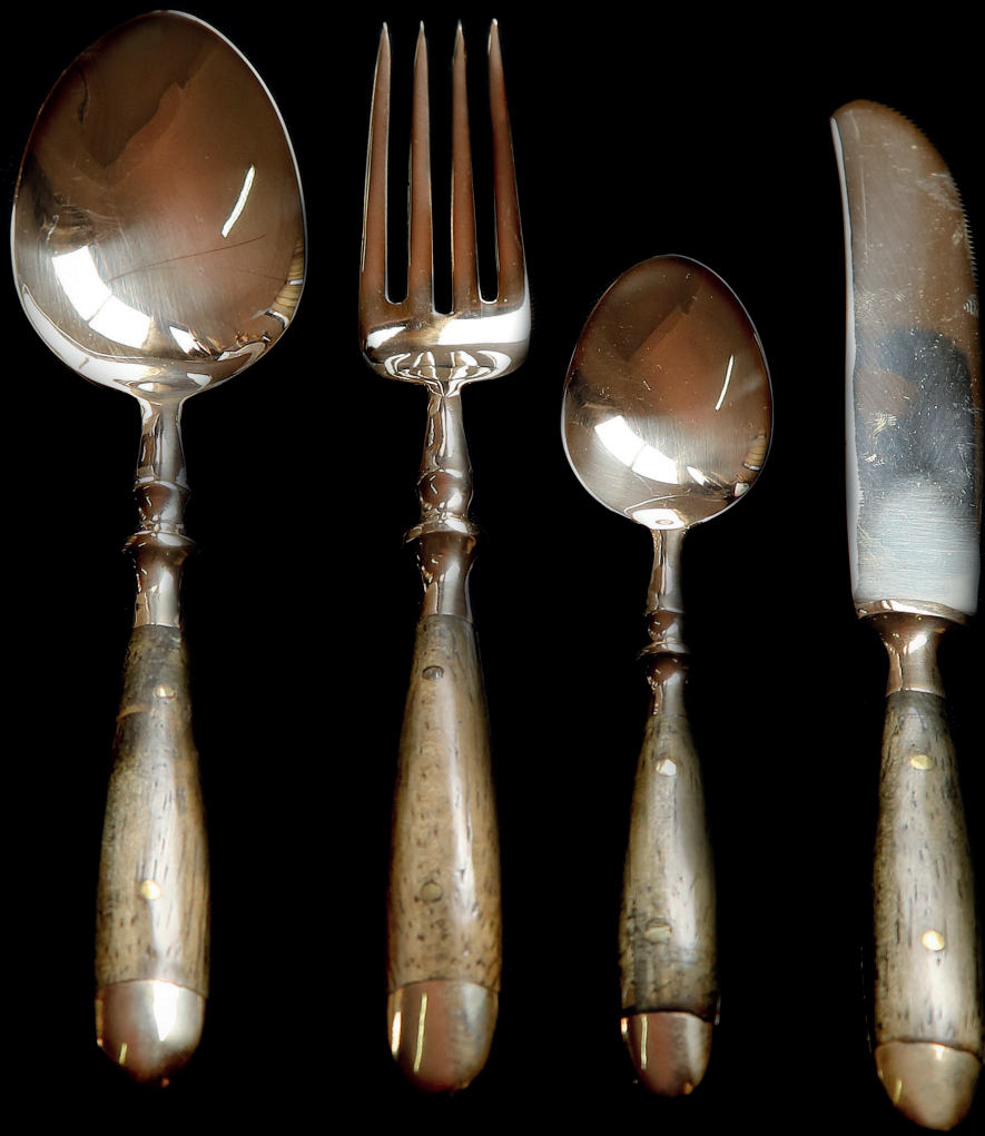
ช้อน ส้อม มีด ด้ามไม้