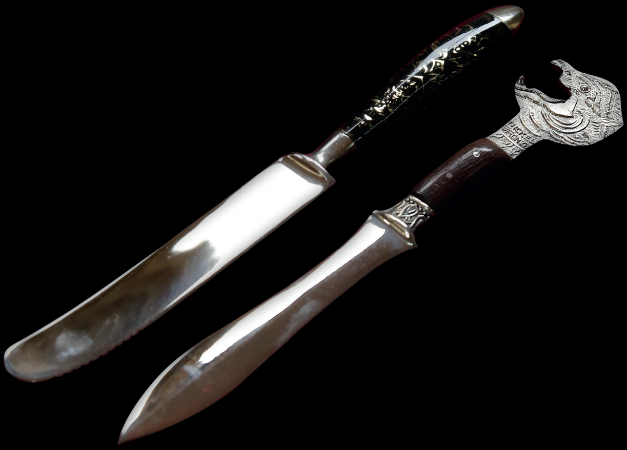
มีดควา มีดตัดกระดาษ ที่เปิดขวด (ลายหนุมาน)