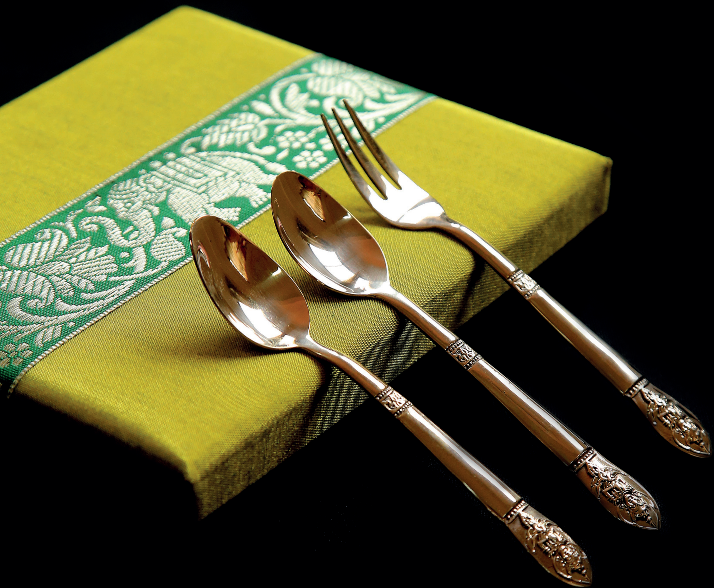
ชุดช้อนส้อม (ลายเทพพนม)