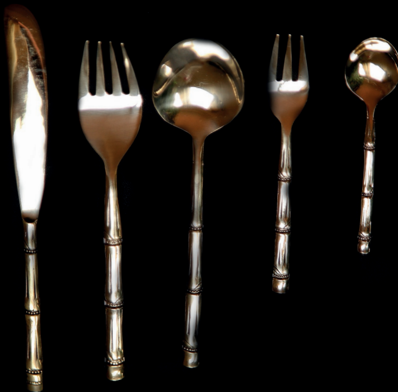
มีด ส้อม ช้อน (ลายปล้องไม้ไผ่)

ความโดดเด่นของเครื่องทองลงหินฝีมือนายสมคิดอยู่ที่ความวิจิตร งดงาม ตามแบบเครื่องทองลงหินแบบโบราณ เมื่อนำมาขัดด้วยหินใหม่ๆ มองผิวเผินจะมีลักษณะแวววาว เนื้อทองสุกใสจนคล้ายทองหรือนาก เมื่อนำมาขัดเพียงหนึ่งครั้งจะดูเหมือนใหม่ไปอีก 4 เดือน มีคุณสมบัติที่ไม่ขุ่นมัวง่าย เมื่อใช้งานแล้วจะไม่มีการลอกละเอียดปน อีกทั้งยังมีความแข็งแกร่งและอายุการใช้งานที่ยาวนานมากกว่างานโลหะทั่วไปในปัจจุบัน