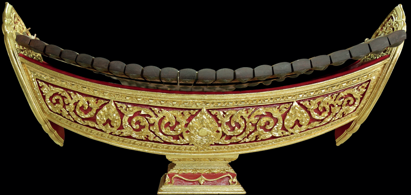
ระนาดเอกประดับทองคำเปลว