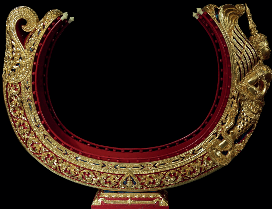
ฆ้องมอญรูปทรงวงเดือน

ส่วนเอกลักษณ์การทำ “ซออู้” เป็นอีกหนึ่งผลงานที่สร้างชื่อเสียงที่ถือเป็นการพัฒนาผลงานครั้งยิ่งใหญ่ของวงการเครื่องดนตรีไทยด้วยการทดลองนำไม้ขนุนมาทดลองทำกระโหลกซออู้แทนการใช้กะลาซอได้สำเร็จและให้เสียงไพเราะไม่ต่างจากกระโหลกซอที่ทำจากกะลามะพร้าวอีกด้วย