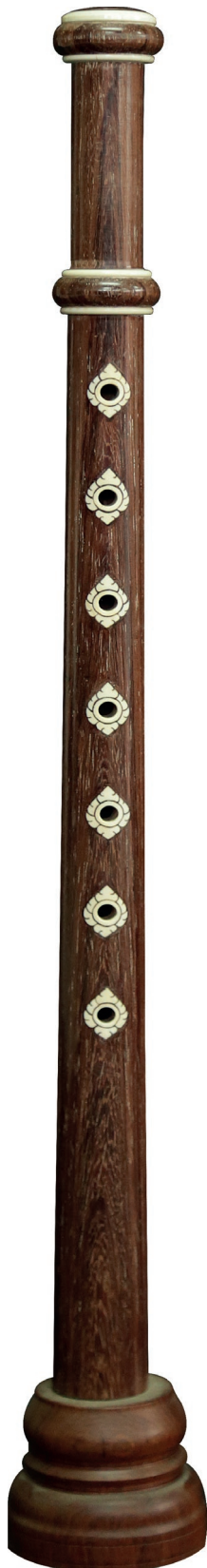
ขลุ่ยประดับมุก