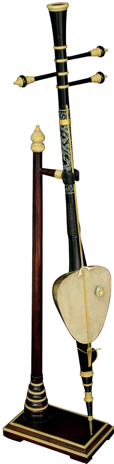
ซอสามสายประดับงาช้าง