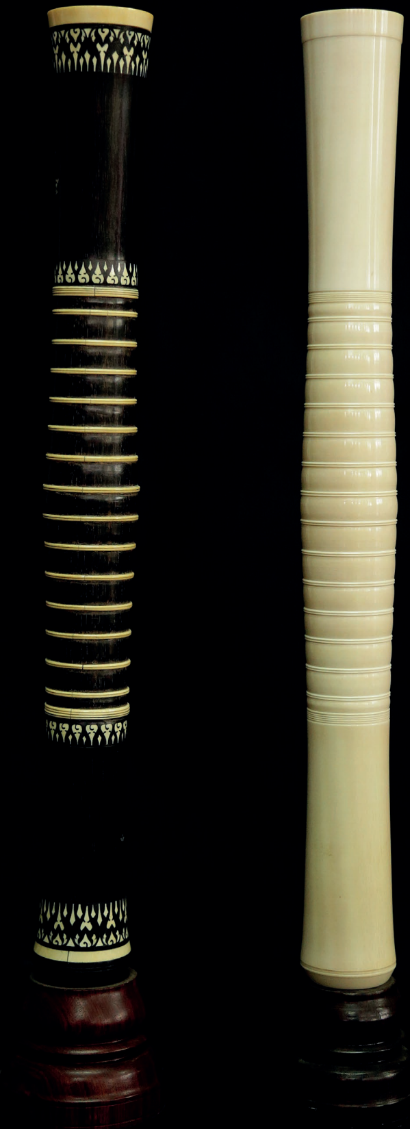
ปี่ในประดับงาช้าง และ ปี่ในงาช้าง