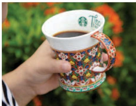
แก้วเซรามิก เขียนลาย เบญจรงค์ แบบลาย ประจำยาม