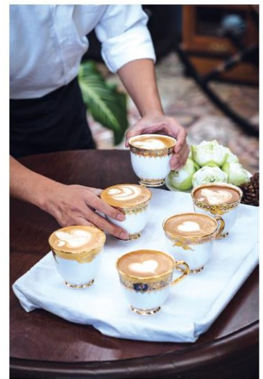
ลาเต้อาร์ต ในถ้วยเบญจรงค์

ของเมืองไทย ผ่านการจำลองการเดินทางของเบญจรงค์ในสมัยอยุธยาเพื่อนำเสนอเป็นผลงานหลากหลายชุดที่เล่นสนุกกับการทำงานดินเผาที่แตกต่างจากวัสดุอื่นๆ การรวมวิธีการทำ และนำไปสู่เบญจรงค์ไทยยุคใหม่ที่น่าสนใจมากขึ้น