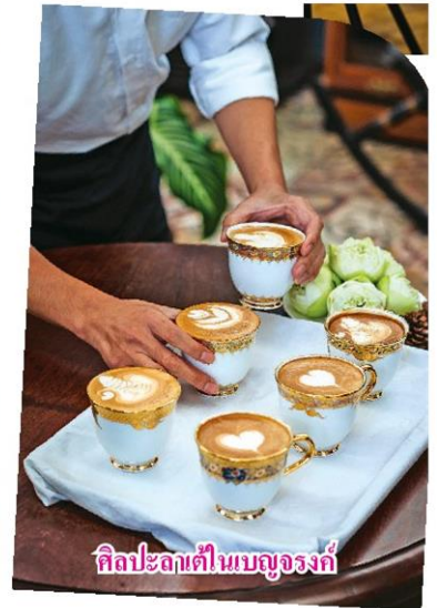
ศิลปะกาแฟในเบญจรงค์

วัฒนธรรมต่างกัน อย่างเช่นการนำดินปั้นเบญจเมธาจากปัตตานีมาผสมผสาน เข้ากับเบญจรงค์ไทยสายเลือดชุมพร ก่อเกิดสัมพันธภาพ ความงามระหว่าง เส้นสายรูปทรง และจารีตที่กลมกลืน