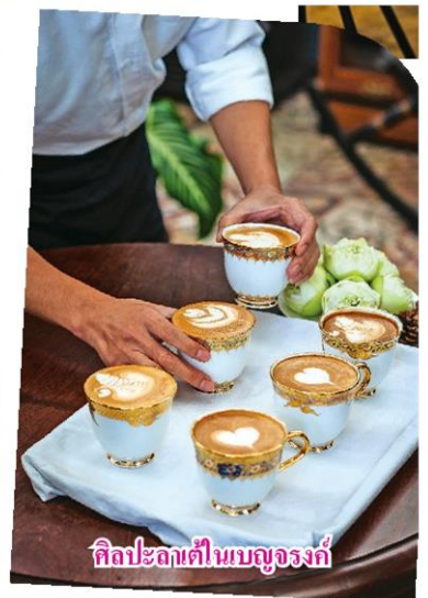
ศิลปะกาแฟเบญจรงค์

วัฒนธรรมต่างถิ่น อย่างเช่นการนำดินปั้นเบญจเมธาจากปัตตานีมาผสมผสาน เข้ากับเบญจรงค์ไทยสายเลือดชุมพร ก่อเกิดสัมพันธ์ภาพ ความงามระหว่าง เส้นสายรูปทรง และจารีตที่กลมกลืน