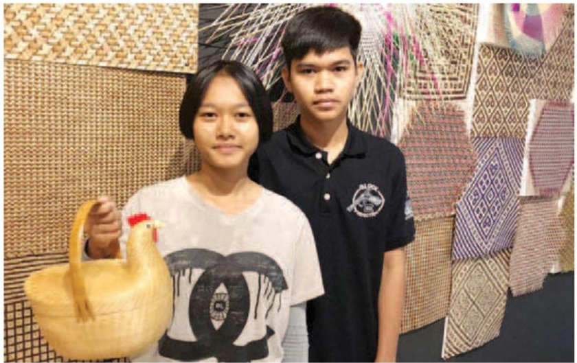
น้ำ และอ้วน

ลวดลายใหม่ๆ เพื่อตอบสนองความต้องการของตลาดไปด้วย อย่างเช่น ฟ้าสีขาว ผ้าขาวม้า และลายโกตดอก ก็เป็นสินค้าน้องใหม่จากพนัสนิคม