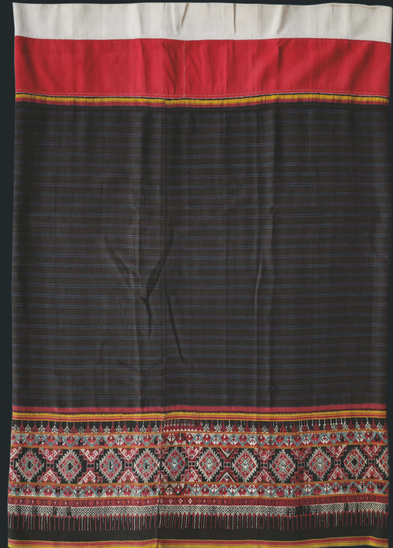
ผ้าชิ้นตีนจก ลายเขยซ้อนหัก