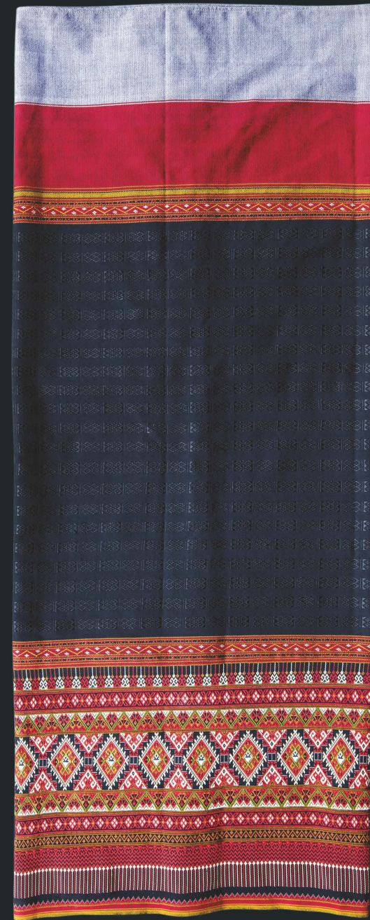
ผ้าซิ่นตีนจก ลายเขี้ยวซ้อนหัก