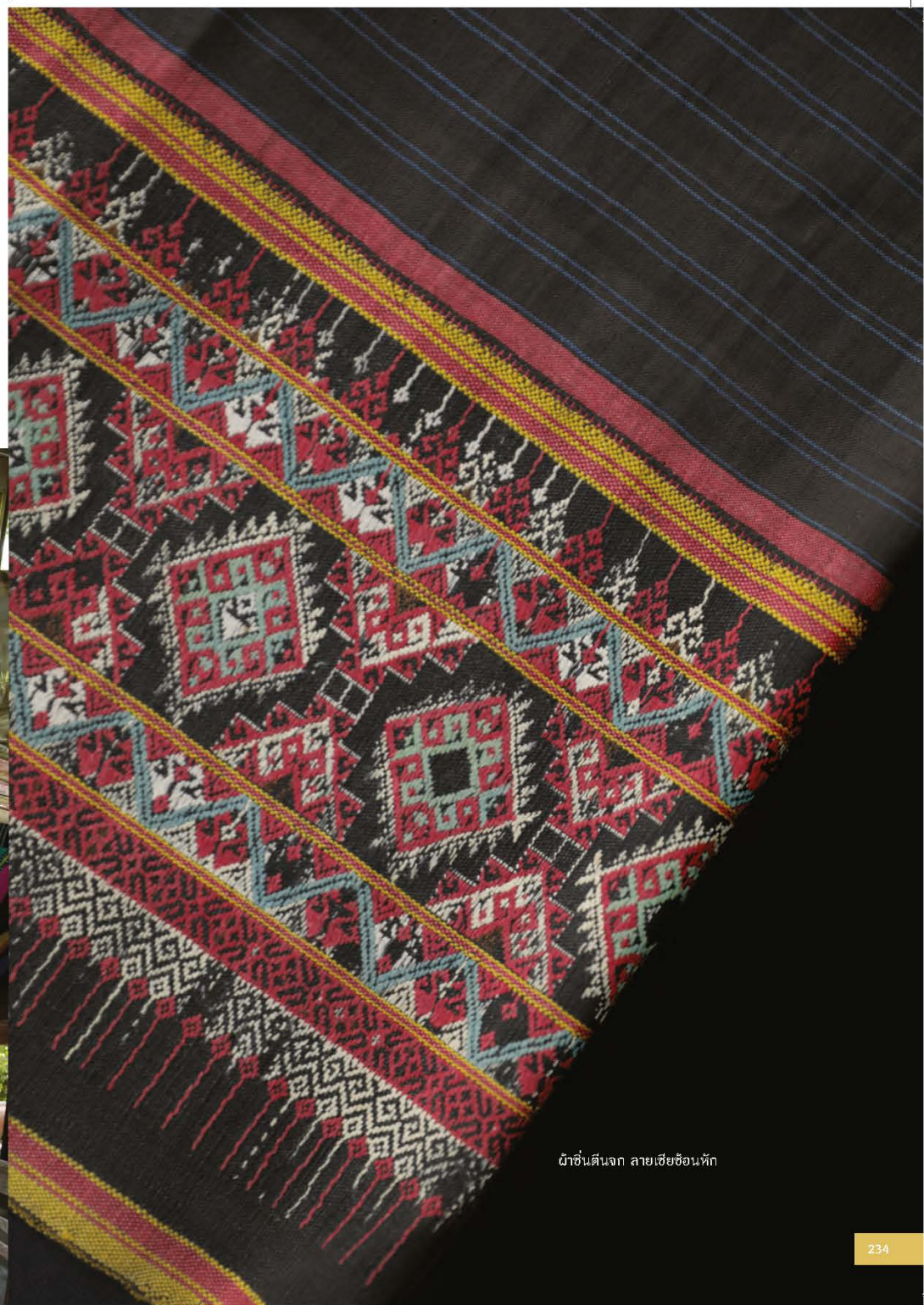
ผ้าชนตมจก ลายเชื่องช้อนหัก