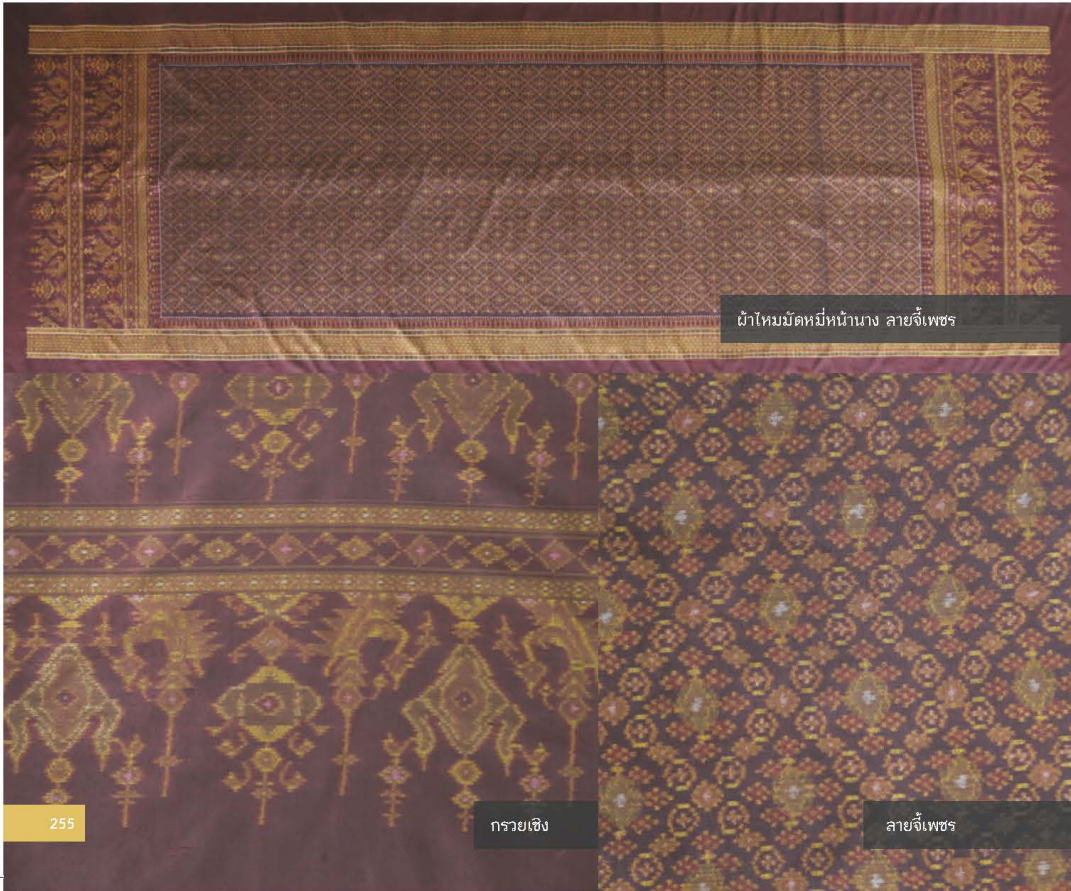
ผ้าไหมมัดหมี่หน้านาง ลายจีเพชร