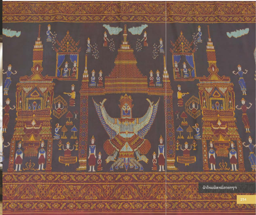
ผ้าไหมมัดหมี่ลายครุฑ