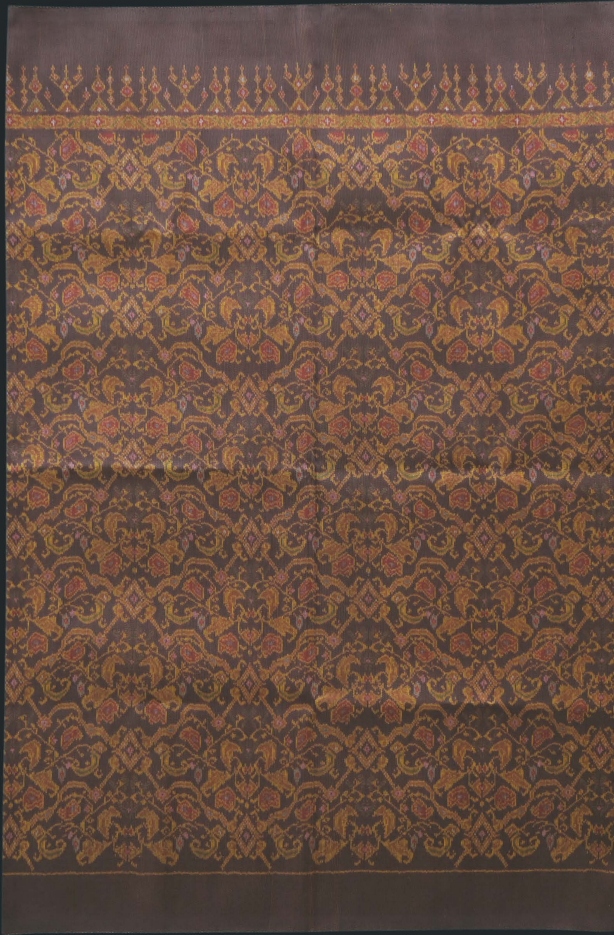
ผ้าไหมมัดหมี่ ลายเครือไม้

“ผ้าไหมมัดหมี่” เป็นผ้าทอมือที่มีเอกลักษณ์ในด้านลวดลายและสีสัน นิยมทำกันอย่างแพร่หลายในภาคอีสาน โดยเฉพาะที่อำเภอชนบท จังหวัดขอนแก่น ถือได้ว่าเป็นแหล่งผลิตผ้าไหมมัดหมี่ที่สำคัญและมีชื่อเสียง โดยมีเอกลักษณ์ที่โดดเด่น คือ ลวดลายที่เกิดจากการ “มัดหมี่” ที่นำมาทอจนเป็นผืนผ้า “ผ้าไหมมัดหมี่” ที่มีเนื้อผ้าแน่น สม่ำเสมอ มีลักษณะสีและลวดลายของผ้าที่เล็ก ละเอียด และมีความสวยงามแตกต่างจากผ้าไหมมัดหมี่แหล่งสำคัญอื่นๆ ถือเป็นผลงานที่มีเอกลักษณ์ทางวัฒนธรรมและเป็นแหล่งทอผ้าไหมมัดหมี่ที่มีชื่อเสียงที่สุดในประเทศไทย ที่ถูกสืบทอดด้วยช่างทอในท้องถิ่นจากรุ่นสู่รุ่นมานานนับ 200 ปี