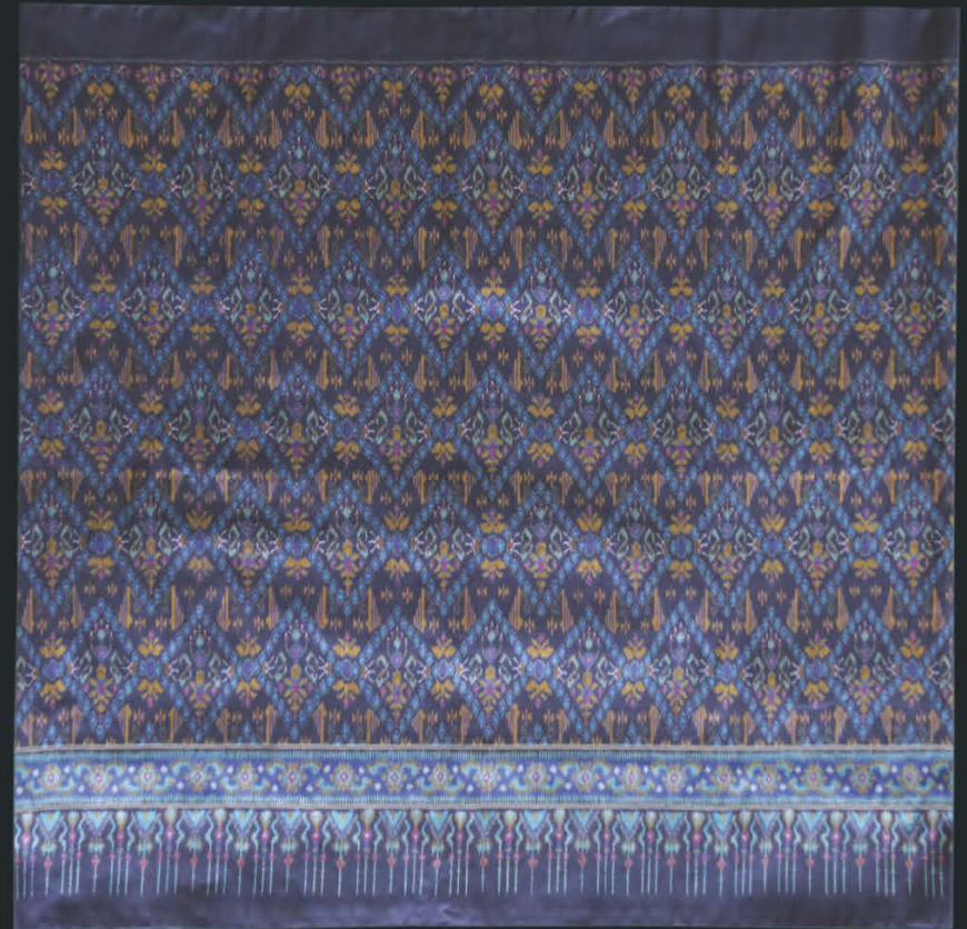
ผ้าไหมมัดหมี่ ลายแคนแก่นคูณ