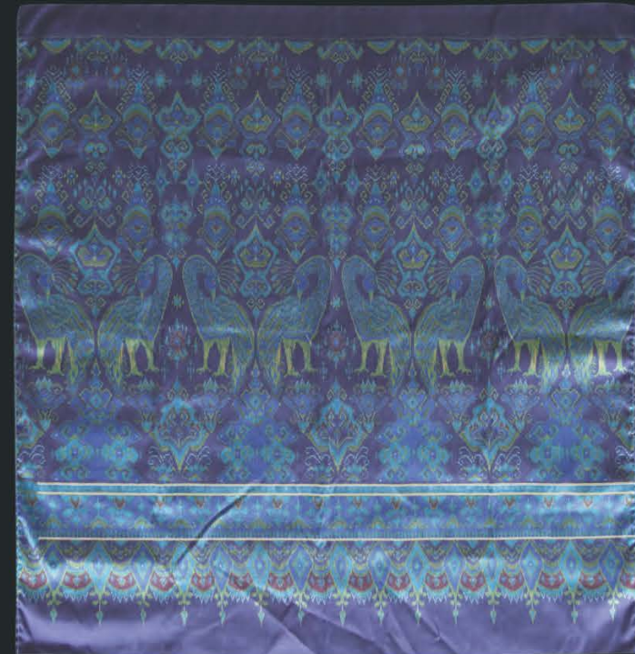
ผ้าไหมมัดหมี่ ลายนกยูง