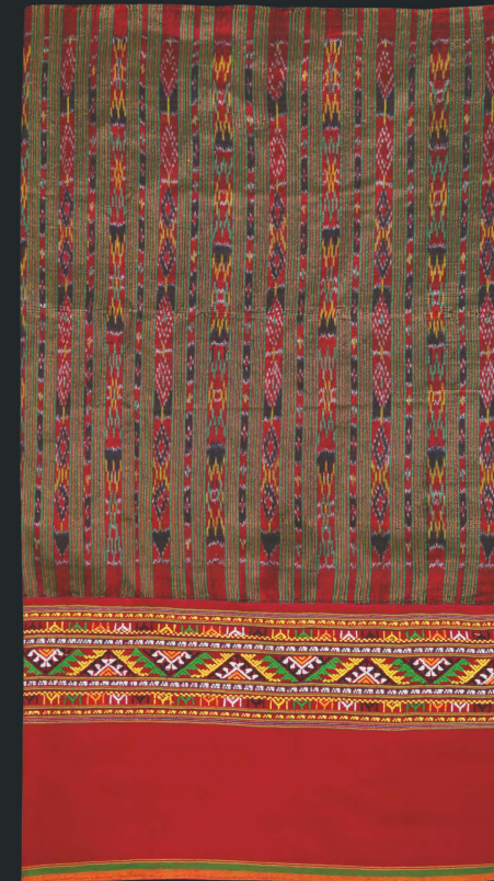
ผ้าซิ่นลายหมี่น้อย ต่อตีนจกลายกนก

ตัวซิ่น คุณสำเนานิยมทอเป็นผ้าฝ้าย หรือผ้าไหมหมี่โสด (มาจากภาษาอีสาน หมายถึง การมัดและทอลวดลายมัดหมี่ต่อเนื่องไปรวดเดียว) ซึ่งยังคงอนุรักษ์ลวดลายที่เป็นเอกลักษณ์ของบ้านกุดจอกมาแต่โบราณ ได้แก่ หมี่ตา หมี่น้อย หมี่สวาง หมี่สำรว เป็นต้น