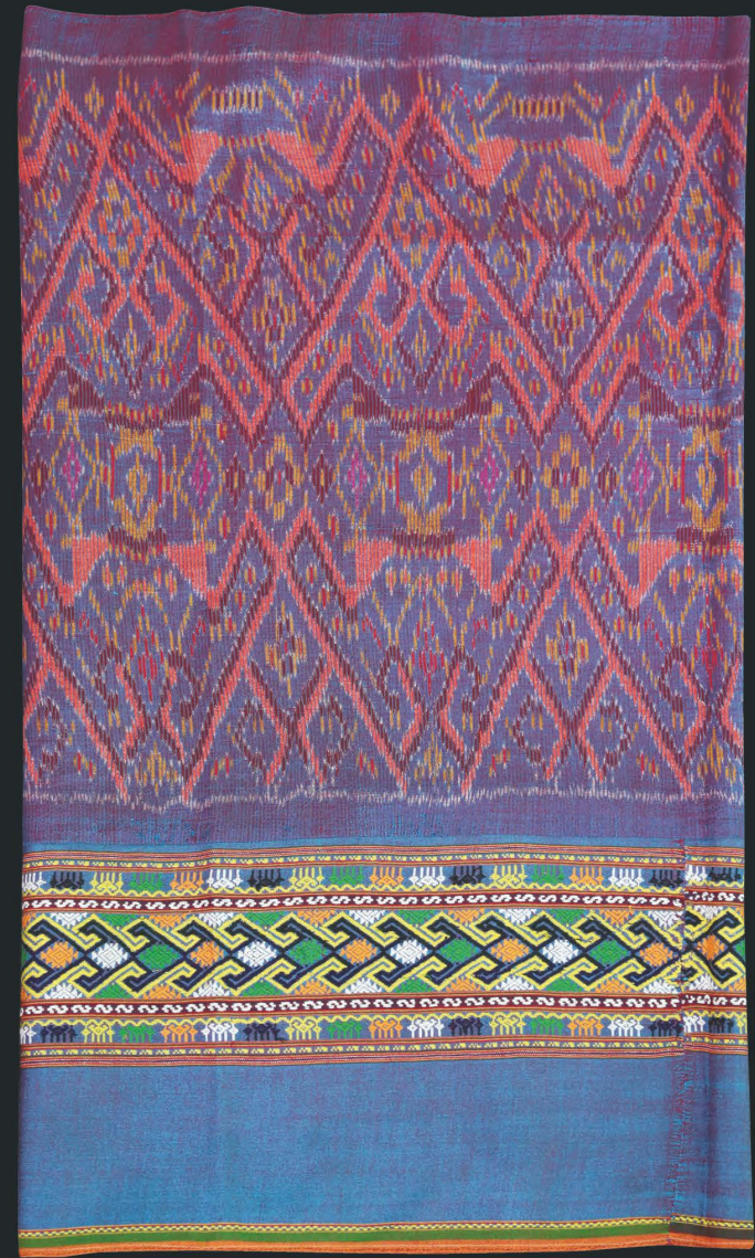
ผ้าขึ้นมัดหมี่ ต่อต้นจกลายขออีโง้ง