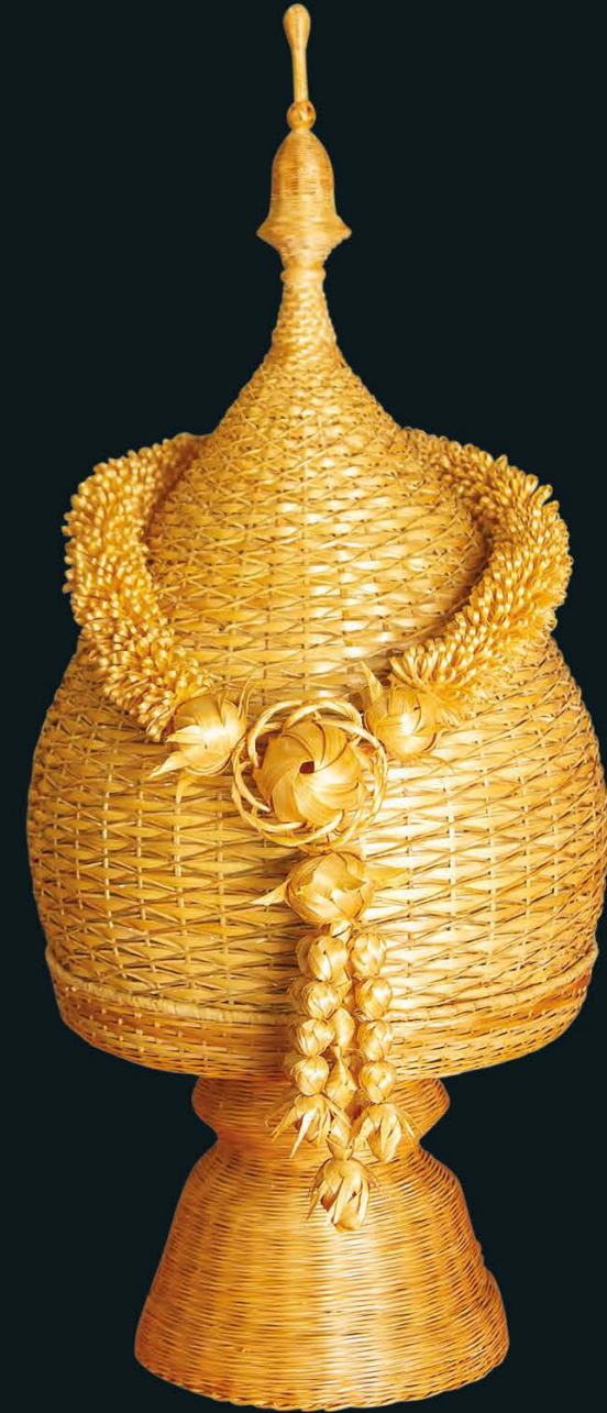
จักสานไม้ไผ่ ฟานพุ่ม