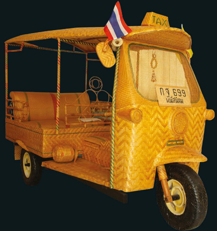
จักสานไม้ไผ่ รถตุ๊กตุ๊ก