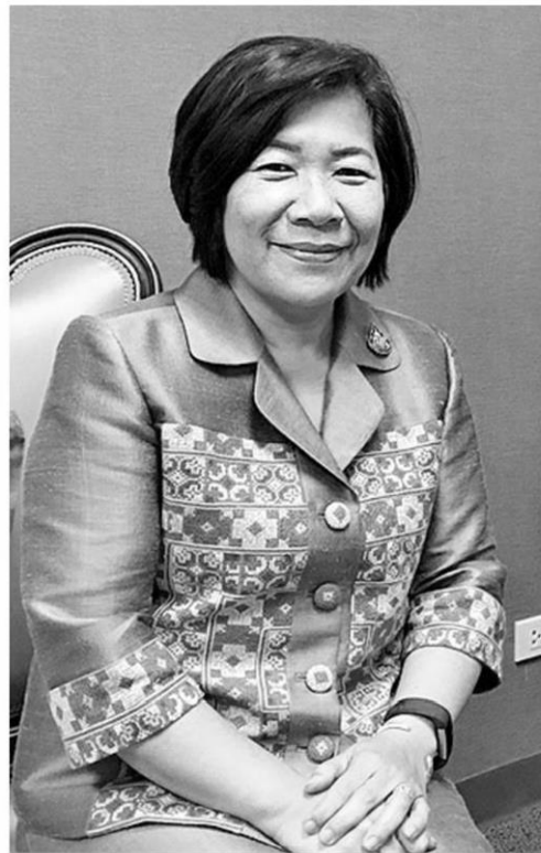
ภูมิภาคเอเชียตะวันออกเฉียงใต้ (แพค) อีกด้วย

นอกจากผู้นำประเทศต่างๆ แล้ว นายอันโตนิโอ กูเตเรซ เลขาธิการสหประชาชาติ และ นางคริสตาลินา จอร์จิวา กรรมการผู้จัดการกองทุนการเงินระหว่างประเทศ (ไอเอ็มเอฟ) ยังจะเดินทางมาร่วมหารือกับผู้นำอาเซียนในการประชุมครั้งนี้ และยังมีนายกรัฐมนตรีบาห์เรนที่จะเดินทางมาร่วมลงนามเข้าเป็นภาคีสันติสัญญามิตรภาพและความร่วมมือใน