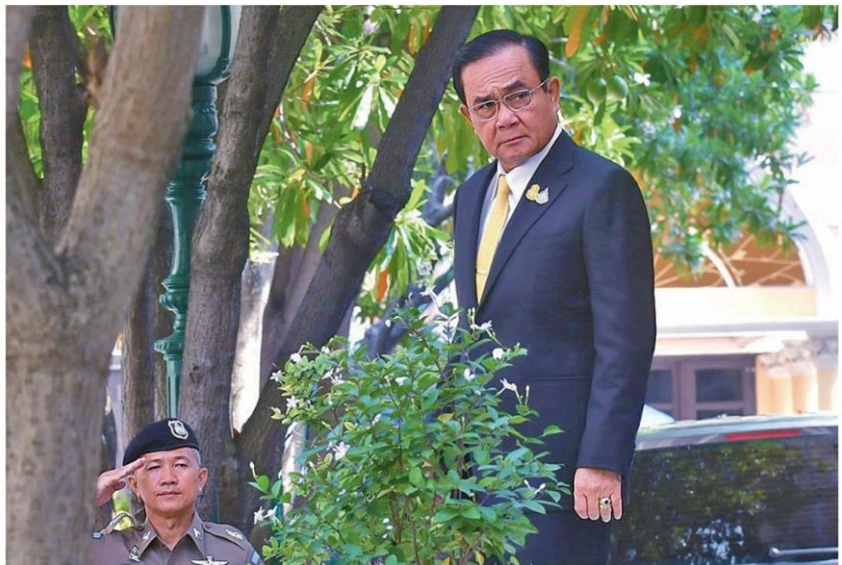
จบแล้ว - พล.อ.ประยุทธ์ จันทร์โอชา นายกรัฐมนตรีและ รว.กลาโหม ตอบคำถามผู้สื่อข่าวกรณี กมธ. ป้องกันและปราบปรามการทุจริต สภาผู้แทนราษฎร จะเชิญไปให้ข้อมูลปมปัญหาการถวายสัตย์ปฏิญาณตน โดยนาย ก กล่าวเพียงสั้นๆ ว่าเรื่องนี้จบไปแล้ว ที่ทำเนียบรัฐบาล เมื่อวันที่ 25 ตุลาคม

ผู้สื่อข่าวถามว่า หากมีการเชิญมาแล้วจะไปชี้แจงหรือไม่ พล.อ.ประวิตรกล่าวว่า ก็ว่ากันไป ส่วนกรณีที่ฝ่ายค้านเตรียมจะเปิดสภาไม่ไว้วางใจรัฐบาลในช่วงกลางเดือนธันวาคม