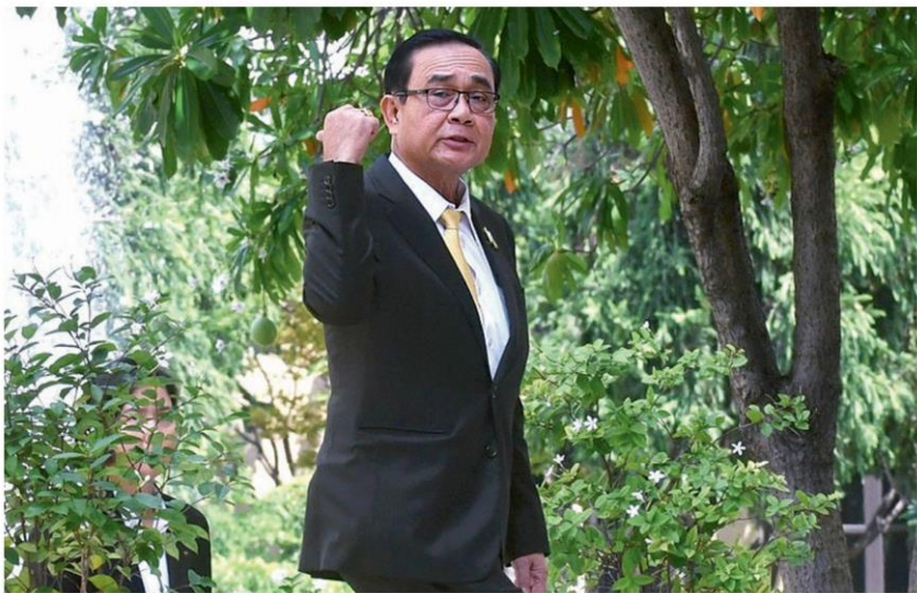
เมินแจงกมธ. - พล.อ.ประยุทธ์ จันทร์โอชา นายกรัฐมนตรีและ รว.กลาโหม ตอบคำถามผู้สื่อข่าวกรณี กมธ.ป้องกันและปราบปรามการทุจริต สภาผู้แทนราษฎร จะเชิญไปให้ข้อมูลปมปัญหาการถวายสัตย์ปฏิญาณตน โดยนายกฯกล่าวเพียงสั้นๆ ว่าเรื่องนี้จบไปแล้ว จากนั้นเดินขึ้นห้องทำงานตึกไทยคู่ฟ้า ทำเนียบรัฐบาลทันที เมื่อวันที่ 25 ตุลาคม

'ปักอก'ย้ำปมถวายสัตย์จบแล้ว เมื่อวันที่ 25 ตุลาคม ที่ทำเนียบรัฐบาล พล.อ.ประยุทธ์ จันทร์โอชา นายกรัฐมนตรี และรัฐมนตรีว่าการกระทรวงกลาโหม (กท.) ให้สัมภาษณ์ภายหลังเป็นประธาน