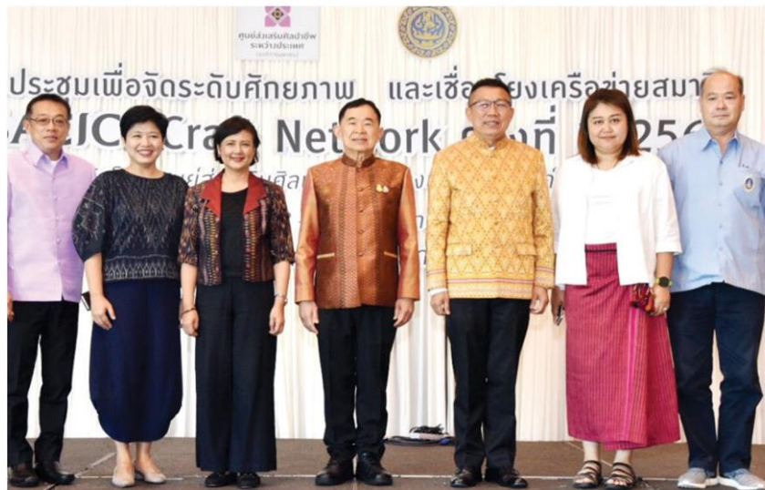
หัตถกรรมอีสาน - วีรศักดิ์ หวังศุภกิจโกศล รมช.พาณิชย์ เปิดประชุมสมาชิก SACICT Craft Network ครั้งที่ 3 กลุ่มผู้ประกอบการงานศิลปหัตถกรรมอีสาน มี แสงระวี สิงหวิบูลย์ รักษาการ ผอ.ศูนย์ส่งเสริมศิลปาชีพระหว่างประเทศ ร่วมงาน ที่รร.อานี ขอนแก่น