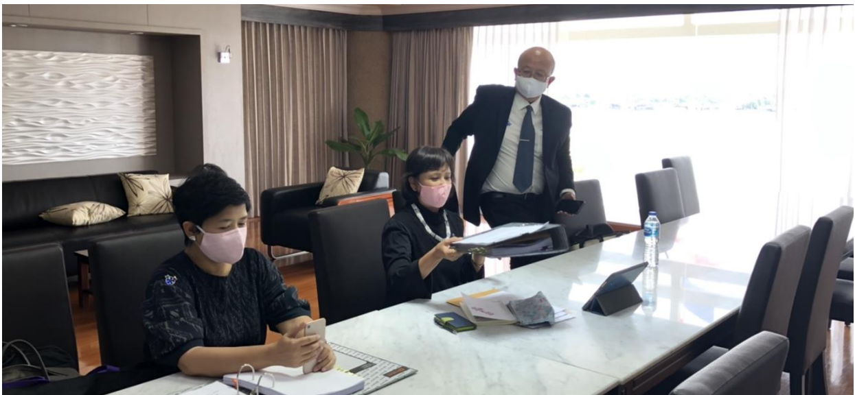
ภาพการประชุม