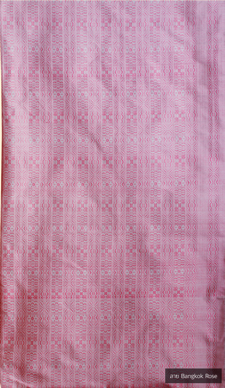
ลาย Bangkok Rose