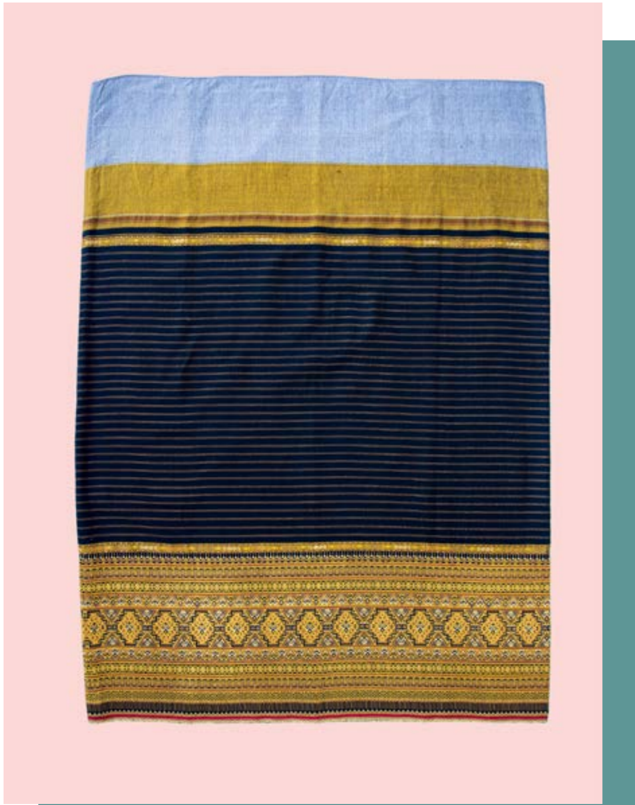
ผ้าชิ้นตีนจก ลายหักซ้อนหัก