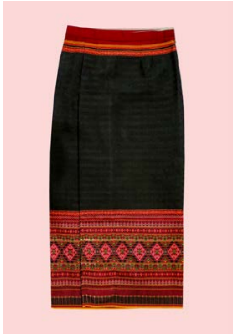
ผ้าชิ้นตีนจก ลายหักซ้อนหัก

ผ้าชิ้นตีนจกไทยวน-คูบัว เป็นภูมิปัญญาการทอผ้าที่มีการสืบทอดมาจากบรรพบุรุษยาวนานกว่า 200 ปี บ้านคูบัวถือเป็นชุมชนของชาวโยนกเชียงแสน หรือที่เรียกกันว่า “ไทยวน” ที่ได้อพยพย้ายถิ่นฐานจากเมืองเชียงแสนมาอยู่ที่บ้านคูบัว จังหวัดราชบุรี โดยได้นำองค์ความรู้ทางการทอผ้าติดตัวมาด้วย นิยมทอใช้กันเองภายในครอบครัวอย่างแพร่หลาย แต่เมื่อเวลาผ่านไปความนิยมในการทอผ้าใช้เองจึงมีให้เห็นน้อยลง เหลือเพียงไม่กี่หลังคาเรือนที่ยังคงทอผ้าชิ้นตีนจกไทยวนอันเป็นเอกลักษณ์ของชาวคูบัว ที่เป็นผืนผ้าที่มีความโดดเด่นในการเลือกใช้สีเส้น ซึ่งนิยมใช้สีแดงสดและสีแดงคร่ำเป็นสีหลัก อันแสดงถึงพลังและความสดใส อีกทั้งยังสร้างสรรค์ลวดลายด้วยวิธีการจกด้วยความประณีต งดงามตามแบบลวดลายโบราณที่ทำสืบทอดต่อกันมาอย่างยาวนานจนถึงปัจจุบัน