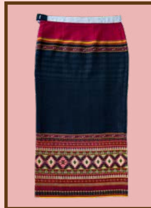
ผ้าซิ่นตีนจก ลายหักซ้อนหัก