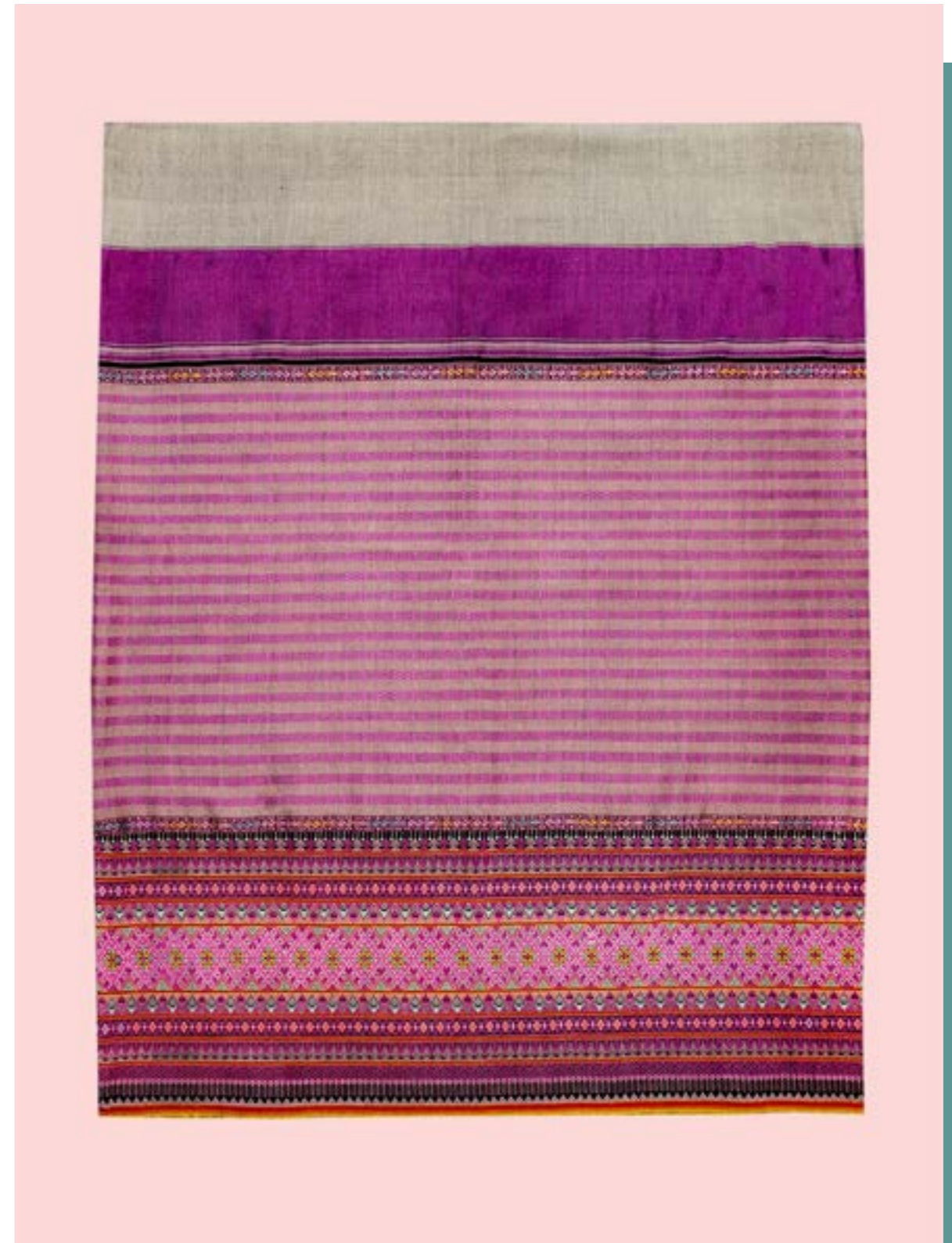
ผ้าซิ่นตีนจก ลายหน้าหมอน