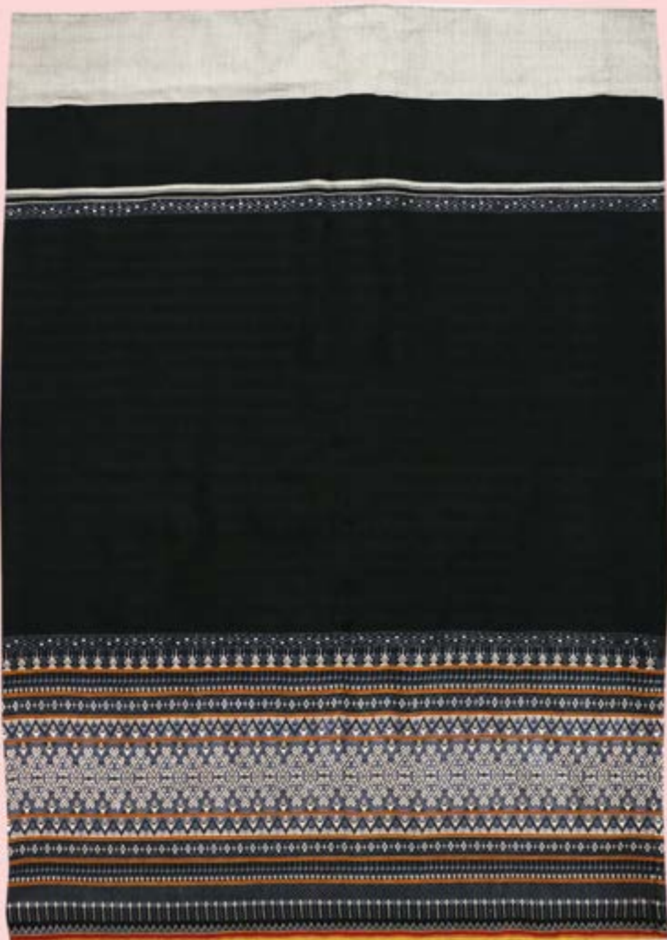
ผ้าชิ้นตีนจก ลายหน้าหมอน