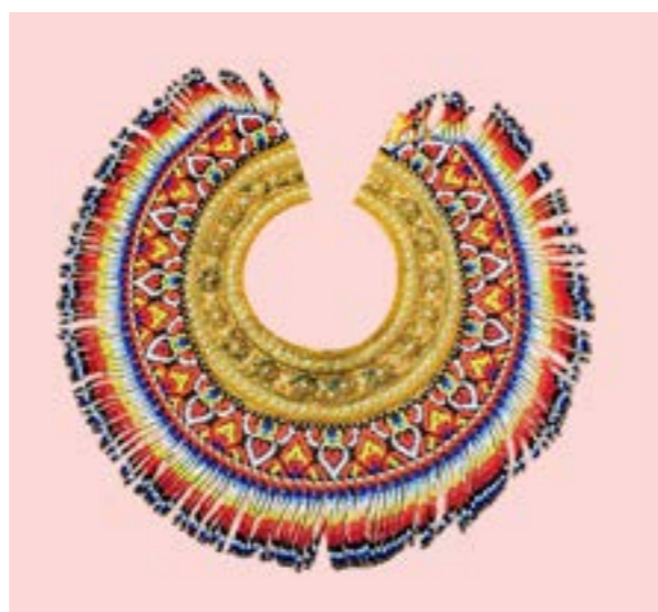
ปั้งคอ ลายดอกดวง