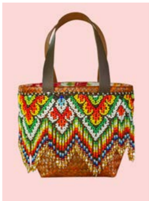
กระเป๋าลายลูกแก้ว