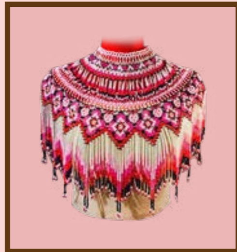
ปั้งคอ ลายลูกแก้วและลายกนก