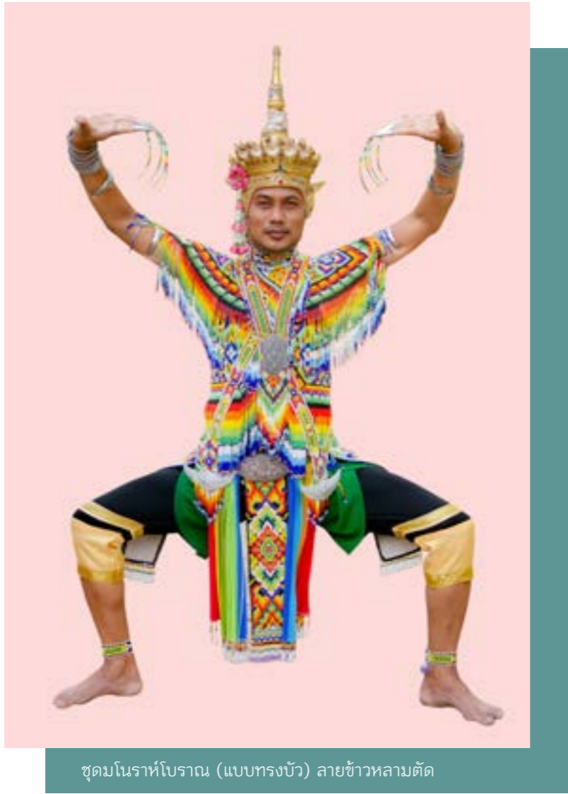
ชุดมโนราห์โบราณ (แบบทรงบัว) ลายข้าวหลามตัด

มโนราห์ หรือ โนรา เป็นชื่อศิลปะการแสดงพื้นเมืองทางภาคใต้ ที่ถูกสืบทอดต่อกันมานานนับหลายร้อยปี เป็นศิลปะการร่ายรำชั้นสูงที่ปรากฏในสมัยสุโขทัยเป็นราชธานี สันนิษฐานว่าการแสดงได้รับอิทธิพลมาจากประเทศอินเดีย โดยมีวัตถุประสงค์ในการร่ายรำเพื่อบูชาเทพทั้งสามพระองค์ตามความเชื่อโบราณ คือ พระอิศวร พระพรหม และพระนารายณ์ เครื่องแต่งกายในการแสดงจึงมีความคล้ายกับเครื่องทรงกษัตริย์ ในปัจจุบันได้มีวิวัฒนาการนำลูกปัดมาร้อยเป็นชุดเครื่องแต่งกายให้ชุดมีความสวยงามมากยิ่งขึ้น