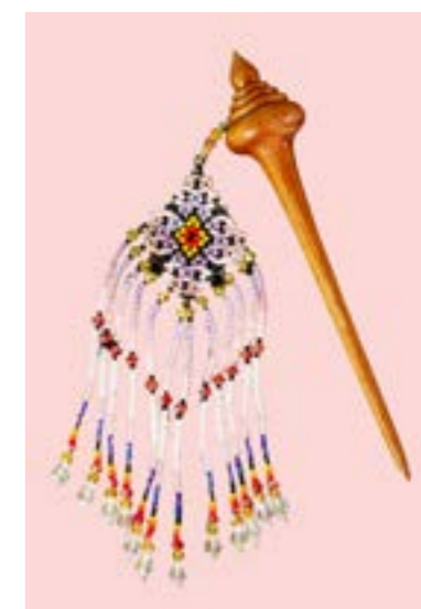
ปิ่นปักผม ลายข้าวหลามตัด