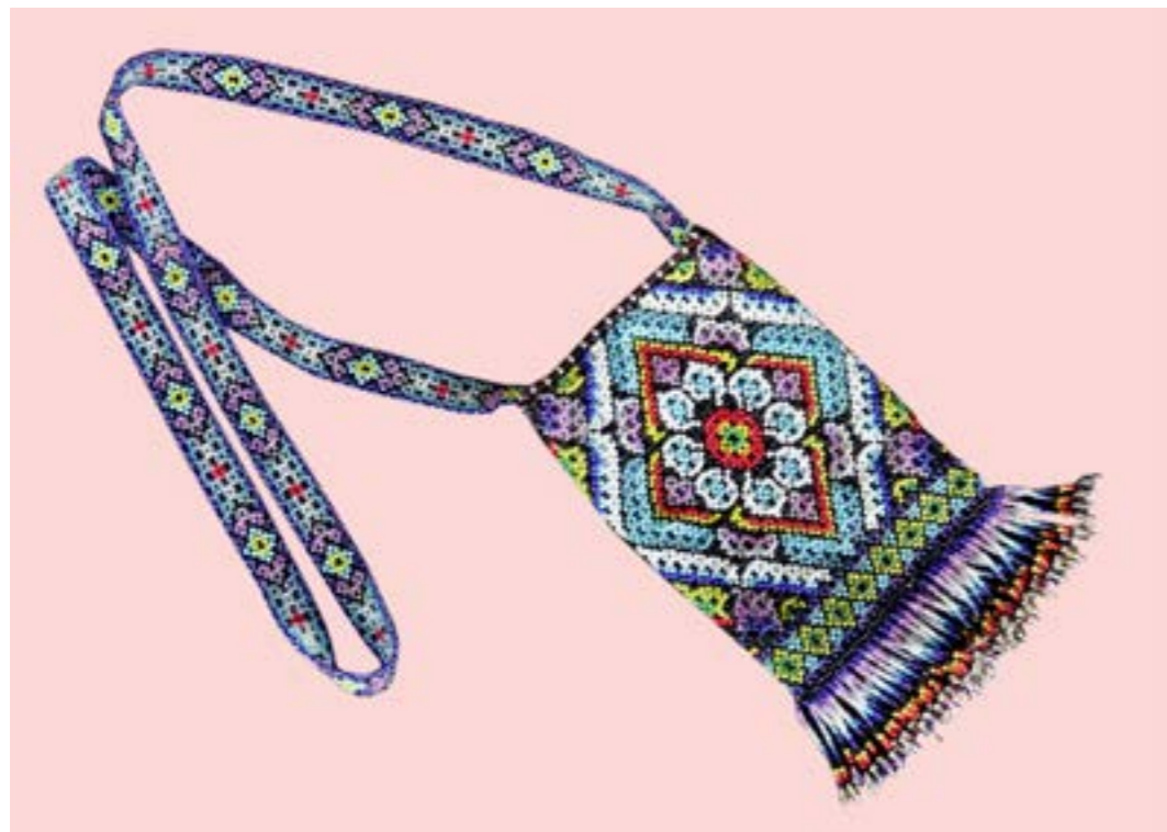
กระเป๋าลายข้าวหลามตัดและลายลูกแก้ว