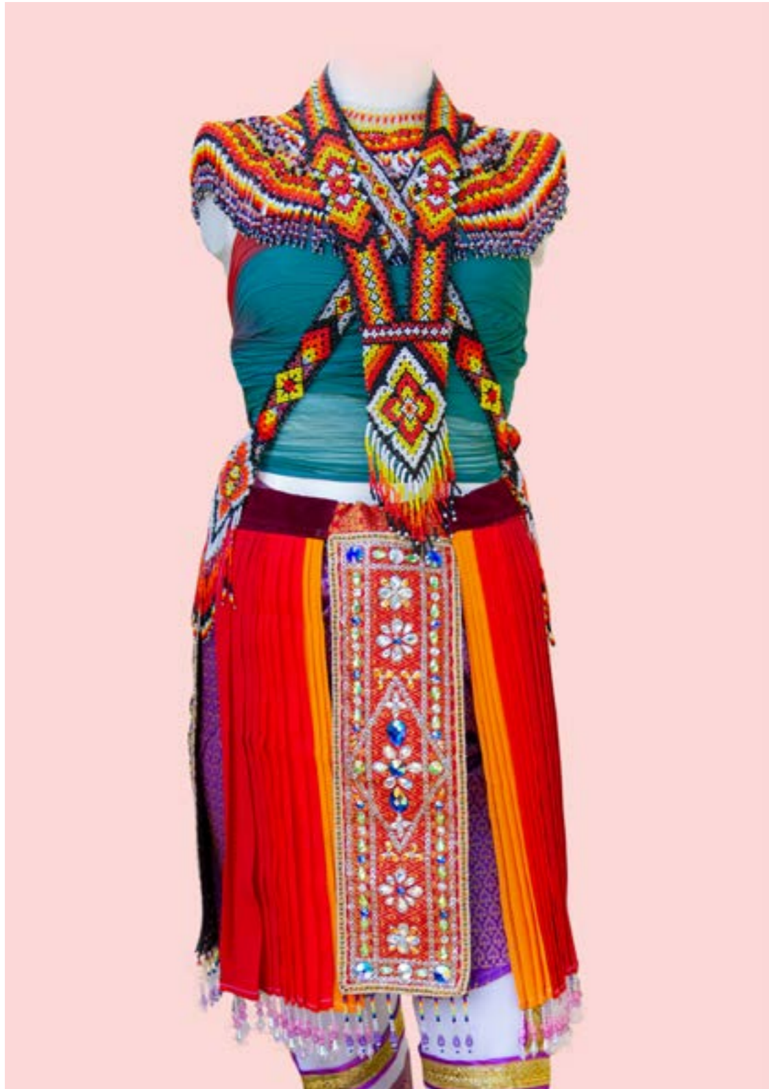
ชุดมโนราห์โบราณ (แบบทรงบัว) ลายข้าวหลามตัด