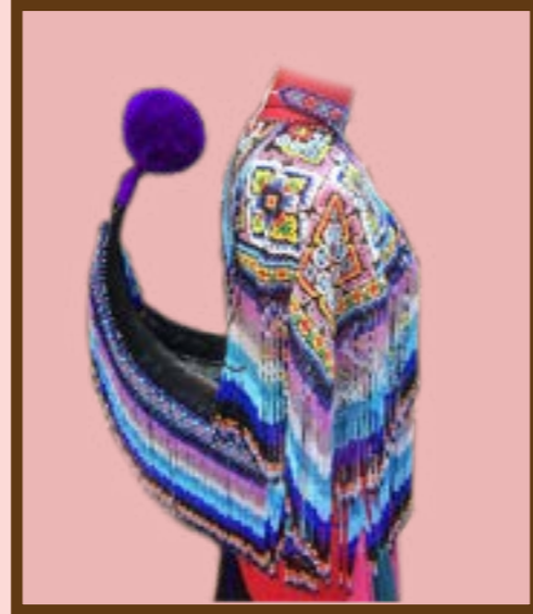
ปีก หรือหางหงส์ ลายข้าวหลามตัด