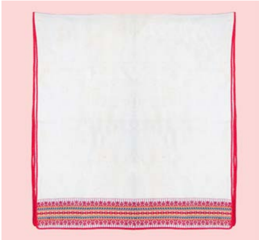
ผ้าห่มหัวเก็บ ลายจันทร์

ผ้าทอ ผูกพันกับการดำรงชีวิตของชาวไทยวน มีการสืบทอดภูมิปัญญาของบรรพบุรุษมาตั้งแต่สมัยโบราณกว่า 200 ปีมาแล้ว ชาวไทยวนที่ตั้งถิ่นฐานอยู่ในอำเภอสีคิ้ว เป็นหนึ่งกลุ่มวัฒนธรรมชาวไทยวนที่ได้รับการสืบทอดภูมิปัญญาด้านการทอผ้ามาจากบรรพบุรุษชาวโยนก และสืบทอดต่อกันมาจากรุ่นสู่รุ่นจนถึงยุคปัจจุบัน