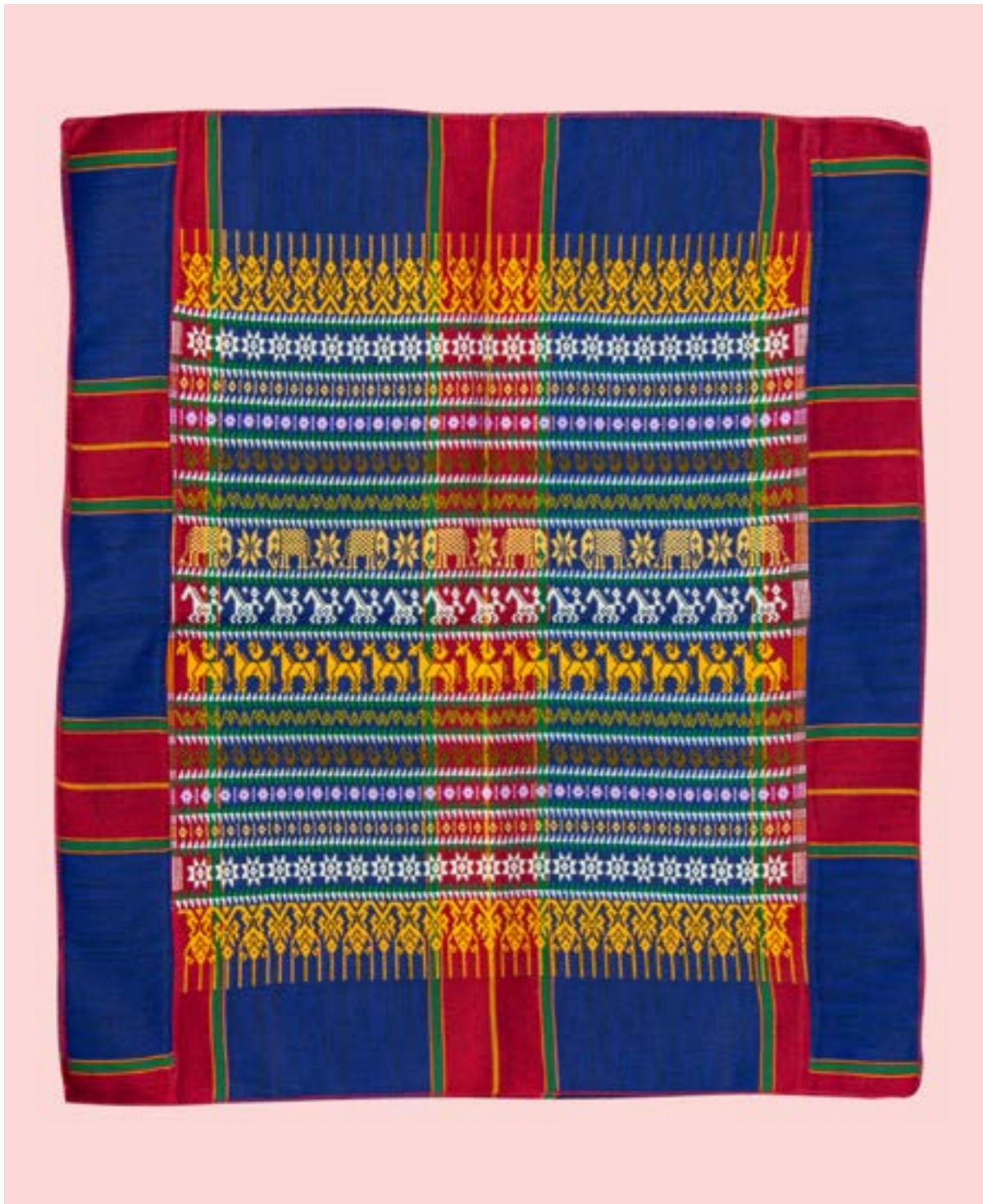
ผ้าต้นแบบ ลายช้างตาม ลายม้าตาม และลายหงส์ขี้ม้า