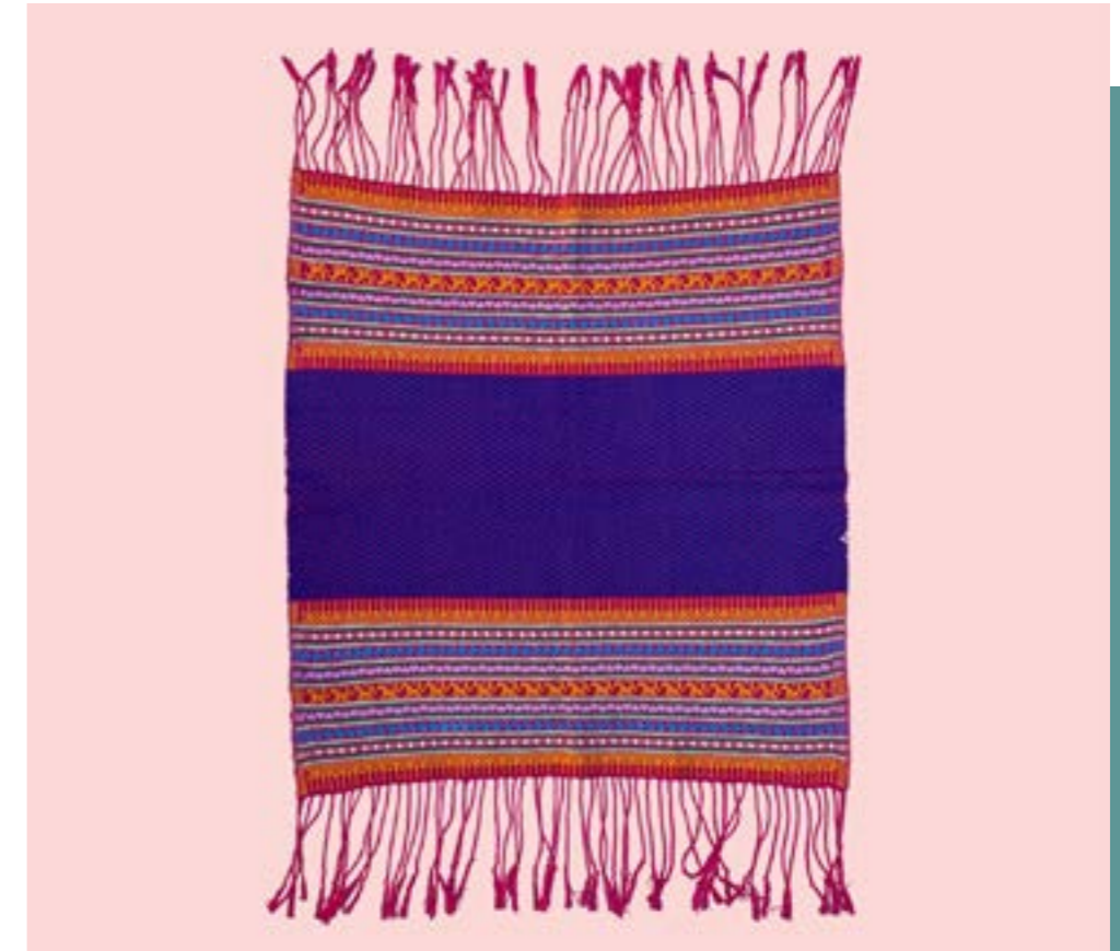
ผ้าปรกหัวนาค ลายม้าตาม