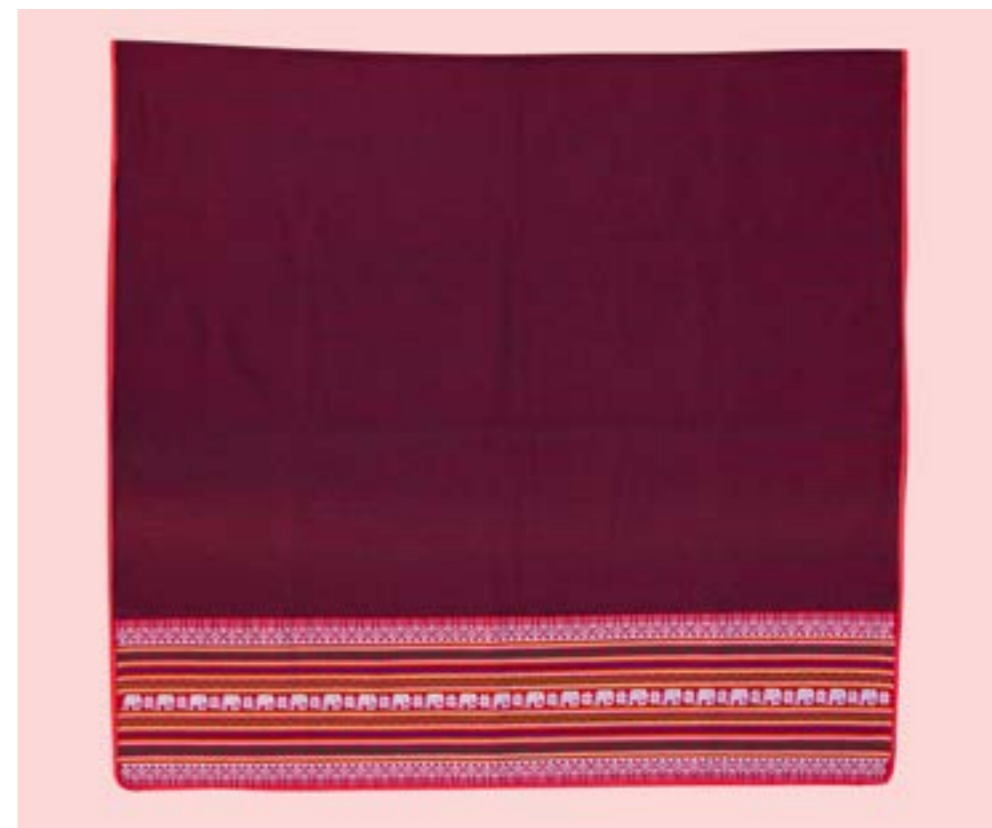
ผ้าห่มหัวเก็บ ลายช้างชมจันทร์