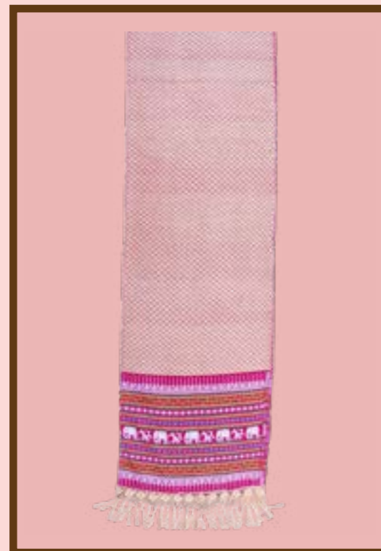
ผ้าสไบ ลายช้างเลี้ยงน้อง