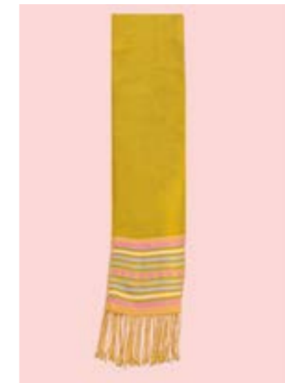
ผ้าสไบ ลายม้าตาม