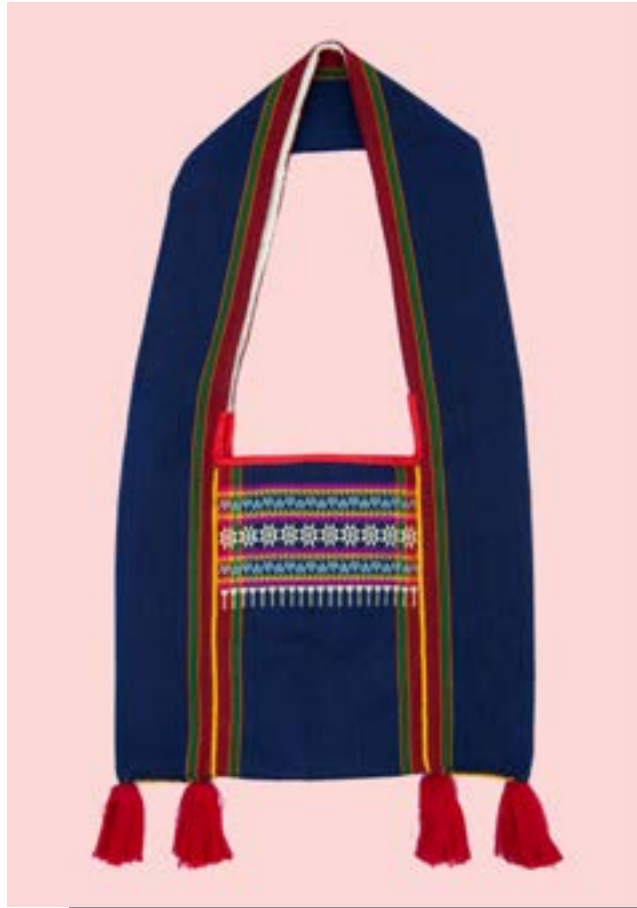
ย่าม ลายจันทร์