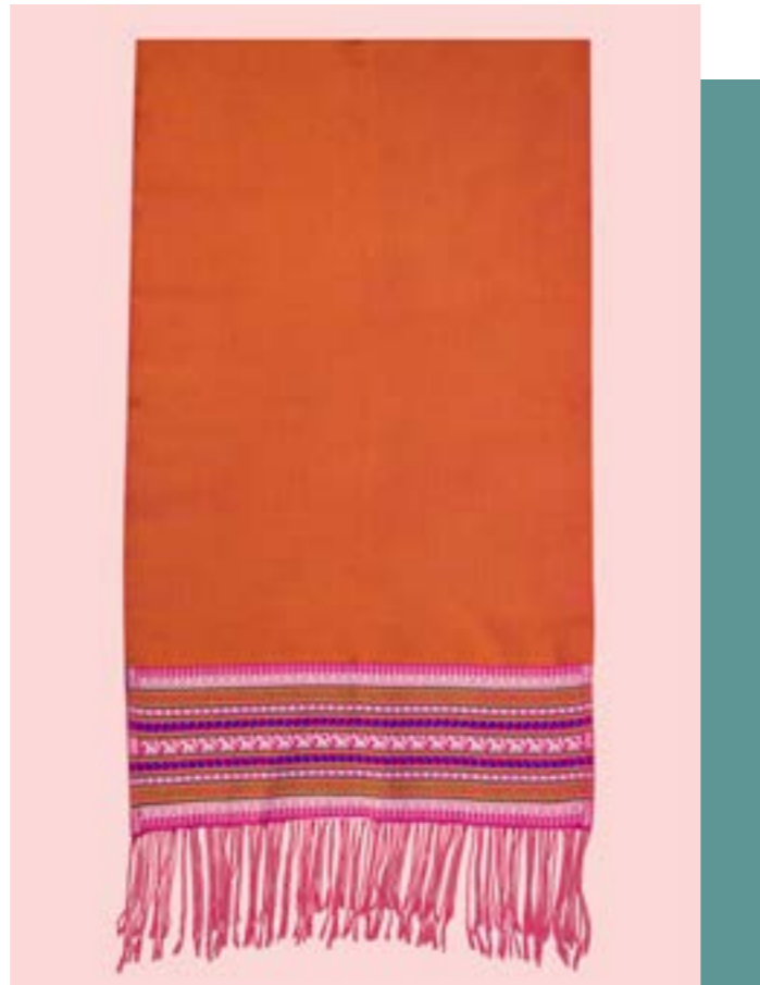
ผ้าคลุมไหล่ ลายม้าตาม