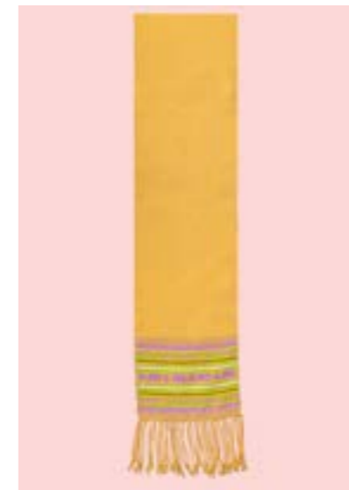
ผ้าสไบ ลายช้างตาม

ด้านการพัฒนาผลงาน นางธิดาได้สร้างสรรค์ผล งานผ้าทอไทยวนได้มีหลากหลายสีสันมากขึ้น เช่น สี เขียว สีฟ้า สีชมพู เป็นต้น ซึ่งผลงานผ้าทอไทยวน แบบดั้งเดิมส่วนใหญ่ใช้เพียงสีแดง สีน้ำเงิน สีเหลือง และสีขาวเท่านั้น