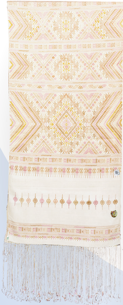
Craftsmen Descendant Silk Phrae Wa