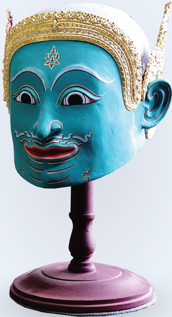
หัวพระวิษณุ

“หัวโซน” หัวครอบส่วนศีรษะและ ใบหน้าหรือหน้ากากที่ใช้ปิดบังใบหน้า ผู้แสดงโซนเพื่อสวมบทบาทตัวละครใน เรื่องราวเกียรติใช้สวมใส่ในการแสดง “โซน” ในการสร้างงานหัวโซนนั้นช่าง หัวโซนต้องมีความรู้ในเชิงช่างที่ครบเครื่อง นอกจากฝีมือเชิงช่างแล้ว หัวโซนยัง ถูกกำหนดด้วยแบบแผน จาริต ของหัวโซน ไว้อย่างเคร่งครัดอีกด้วย เช่น สี และ ลักษณะของหัวโซน เพื่อให้เกิดความ ถูกต้องตามเอกลักษณ์ของตัวแสดง ถือเป็น องค์ความรู้ภูมิปัญญาที่สืบทอดมา หลายร้อยปี