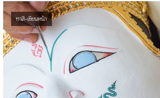
ทาสี-เขียนหน้า