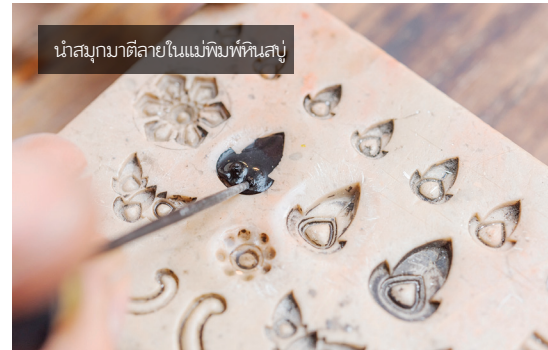
นำสมุกมาตีลายในแม่พิมพ์หินสบู