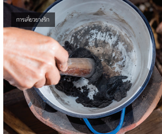
การเคี้ยวรัก

ติดส่วนประกอบที่เป็นหนัง ใช้หนังวัวหรือหนังควายตากแห้งธรรมดา ขูดขนออกให้เรียบร้อย นำมาฉลุตามแบบต่าง ๆ ของหัวโขนนั้น ๆ เช่น ใบหู หางคิ้ว จอนหู นำมาติดประกอบกับหุ่นกระดาดโดยใช้ลวดทองเหลืองเย็บแต่ถ้าเป็นหนังชั้นใหญ่ ๆ เช่น จอนหู ต้องเย็บลวดตามด้านหลังเพื่อเสริมความแข็งแรง