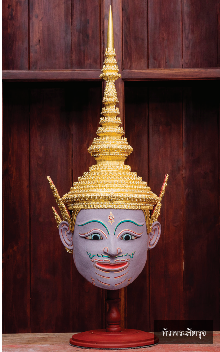
หัวพระสี่ตรง