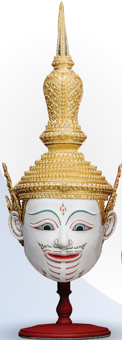
Craftsmen Descendant Khon Mask