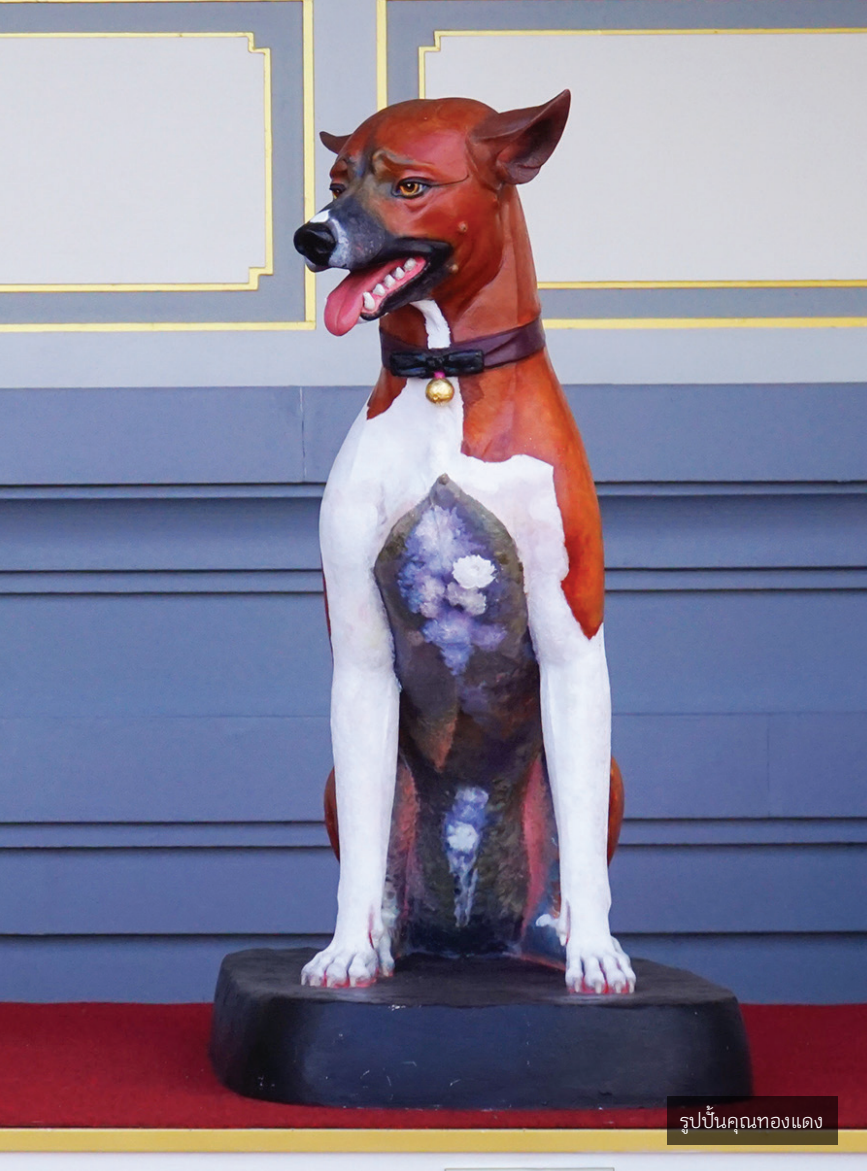
รูปปั้นคุณทองแดง