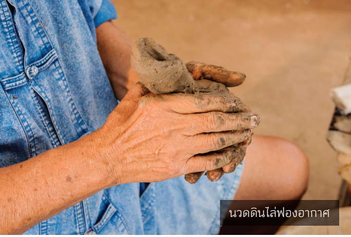
นวดดินไล่ฟองอากาศ