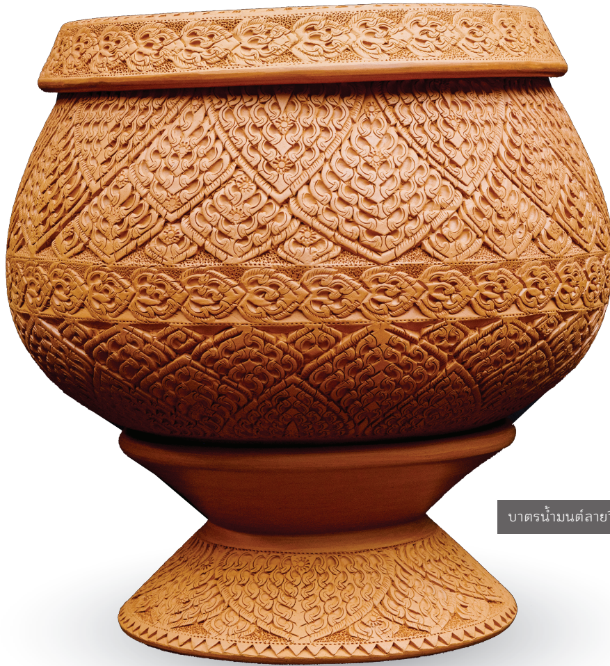
บาตรน้ำมนต์ลายวิจิตร