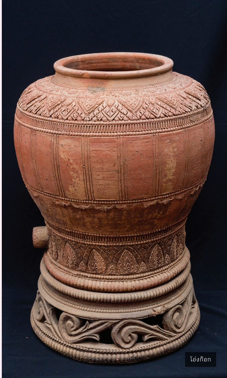
โอ่งก๊อก

1. ทรงก้นกลมคอสูง เป็น เครื่องปั้นดินเผาทรงหม้อน้ำที่สลักลาย วิจิตร ตรงขึ้นคอทุกชั้นประดับด้วยลาย กลีบบัวนูนเล็กคล้ายลายกระจิง ตรง ส่วนตัวของหม้อน้ำมีลักษณะกลมคล้าย บาตร ขอบปากของหม้อน้ำนิยมทำเป็น