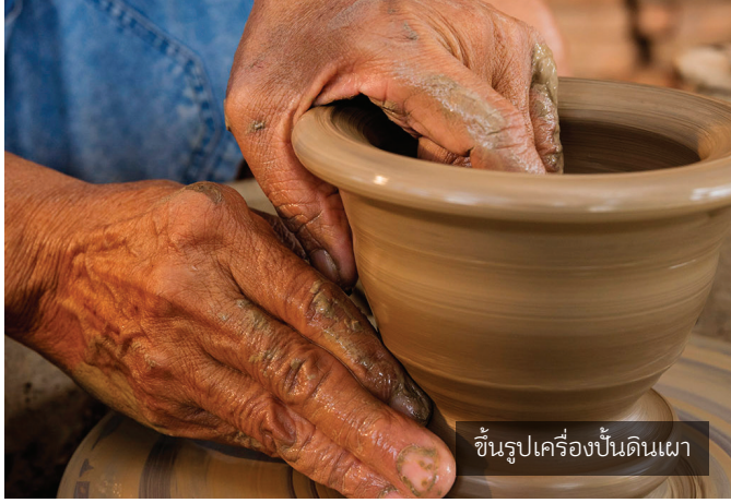
ขึ้นรูปเครื่องปั้นดินเผา