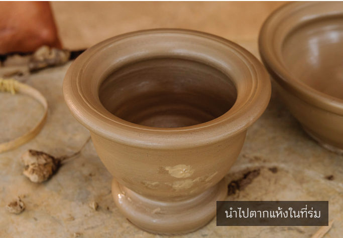
นำไปตากแห้งในที่ร่ม