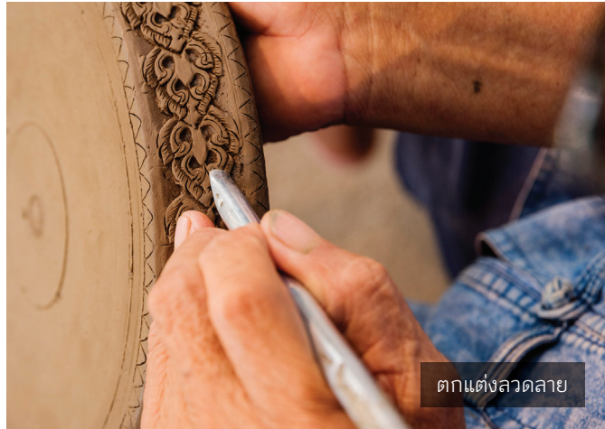
ตกแต่งสวดลาย