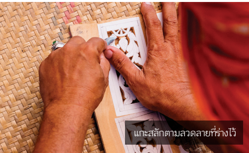
แกะสลักตามลวดลายที่ร่างไว้