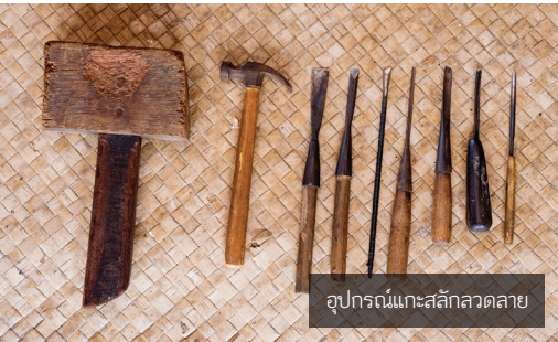
อุปกรณ์แกะสลักลวดลาย