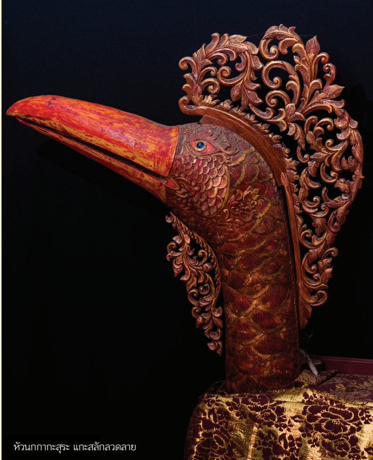
หัวนกกากระสุระ แกะสลักลวดลาย