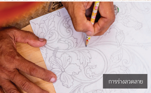
การร่างลวดลาย