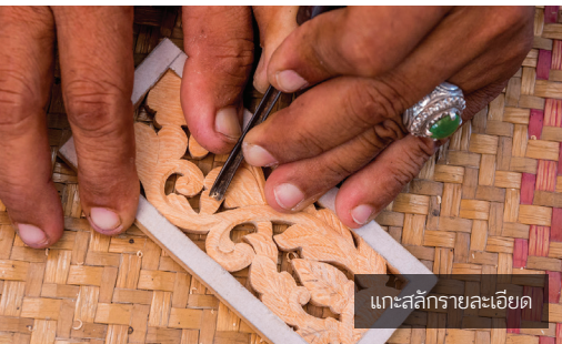
แกะสลักรายละเอียด