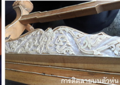
การติดลายบนตัวหุ่น