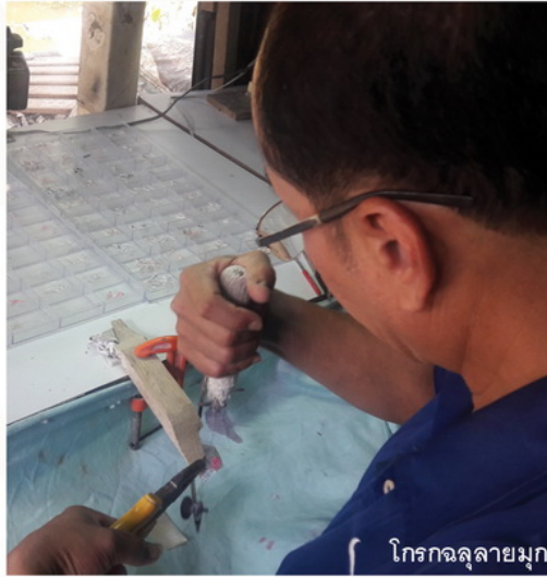
โกรกจลุลายมุก

10. ขัดแต่งด้วยกระดาษทราย คือ การขัดให้ผิวเรียบเสมอกันจนเกิดความเงางาม แต่งชิ้นงานด้วยกระดาษทรายละเอียด