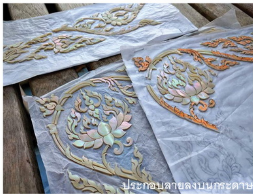
ประกอบลายลงบนกระดาษ