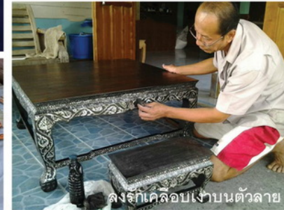
ลงรักเคลือบเงาบนตัวลาย