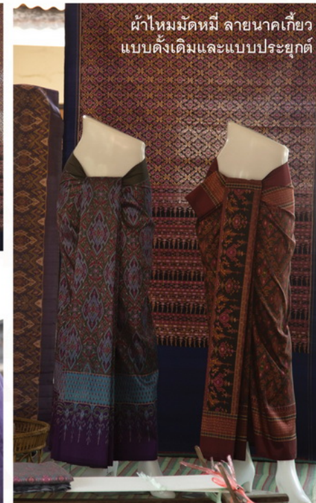
ผ้าไหมมัดหมี่ ลายนาคเกี้ยวแบบดั้งเดิมและแบบประยุกต์