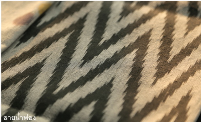
ลายน้ำพอง