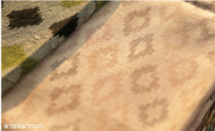
ลายหมากบก