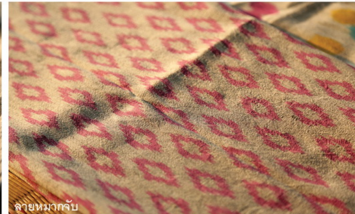
ลายหมากจับ

“อาชีพนี้เราทำมานานโดยมีการสืบทอดมาตั้งแต่รุ่นปู่รุ่นย่า สำหรับลวดลายที่เป็นเอกลักษณ์ของบ้านหัวฝาย คือ ลายหมากบก และหมากจับ ผ้าทุกผืนจะมีลวดลายที่เล็ก ละเอียด ประณีต สีเส้นสวยงาม แม้ว่าขั้นตอนการมัดหมี่แบบโบราณดั้งเดิมจะมีความซับซ้อนและต้องใช้เวลาในการทำ คนรุ่นหลังจึงไม่ยอมสานต่อ แต่ดิฉันกลับภาคภูมิใจที่ได้มีส่วนในการอนุรักษ์ รวมทั้งยังได้พัฒนาจากการมัดหมี่เป็นการแต้มหมี่ด้วยการเปลี่ยนกรรมวิธีให้ง่ายและรวดเร็วขึ้นด้วยการใช้ฟู่กันแต้มสีให้เกิดเป็นลวดลายบนเส้นไหม”