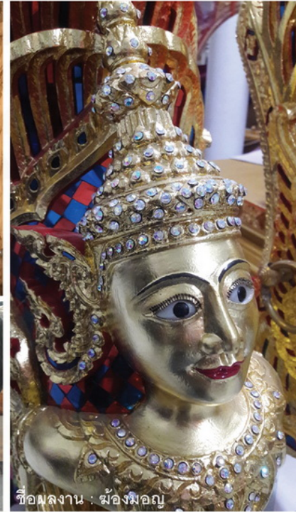
ชื่อผลงาน : ม้องมอญ