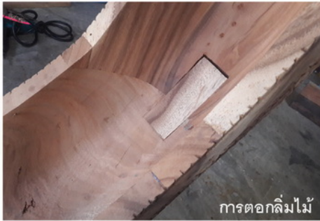
การต่อกลึงไม้