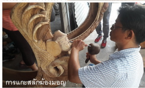
การแกะสลักม้องมอญ