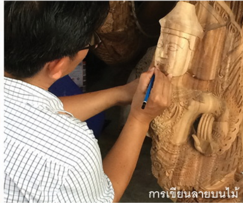
การเขียนลายบนไม้