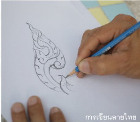
การเขียนลายไทย