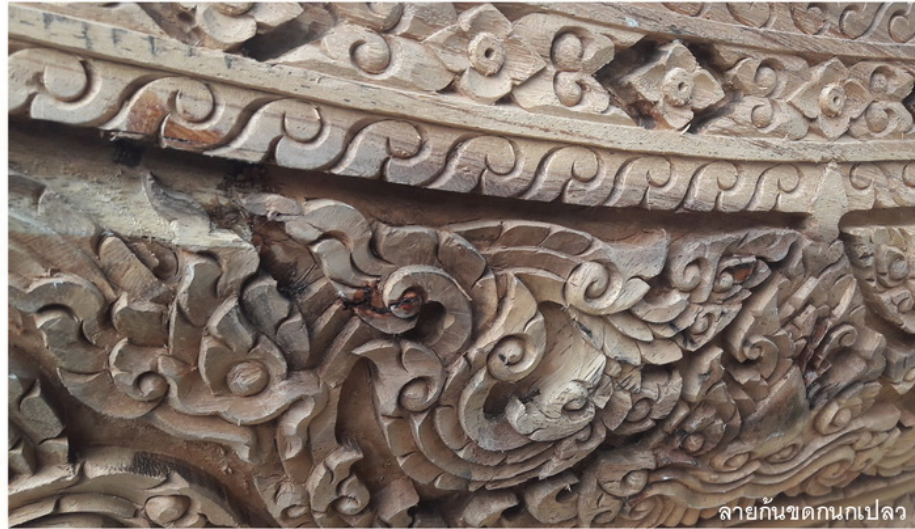
ลายก้านขดกนกเป็ลว

นอกจากการสืบสานงานดั้งเดิมของผู้เป็นพ่อ เอาไว้แล้ว ยังมีการต่อยอดมรดกภูมิปัญญา โดยมีการนำลายนก ลายก้านขด ซึ่งเป็นลายดั้งเดิม มาผสมผสานกับลายนกคาบและลายเถาว์ก้านขด นกกเป็ลว ได้อย่างลงตัวและสวยงาม ด้วยชื่อเสียงและ ประสบการณ์ในการแกะสลักของบ้านเกิดทรงศิลป์ ลายไทย ทำให้ได้มีโอกาสดำเนินงานที่หลากหลายมากขึ้น อาทิ แกะสลักขาตั้งหม้อ ดาวเพดานติดในพระอุโบสถ ตราสัญลักษณ์ รวมถึงการนำารางระนาดเก่าที่ไม่มี ลวดลายมาแกะสลัก ซึ่งยากกว่าการขึ้นชิ้นงานใหม่