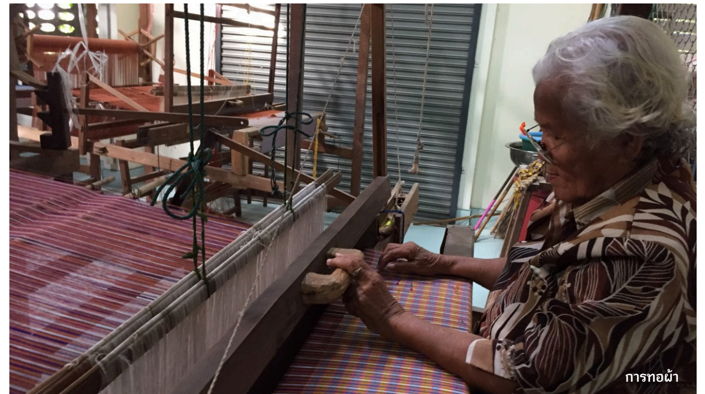
การทอผ้า