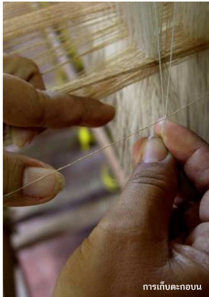
การเก็บตะกอบน