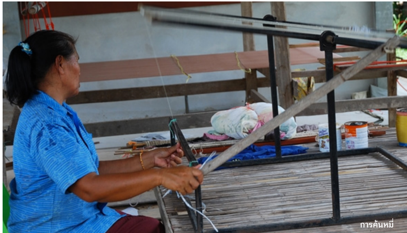
การค้นหมี