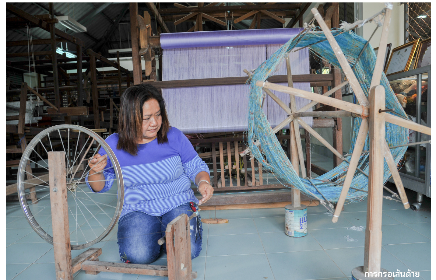
การกรอเส้นด้าย