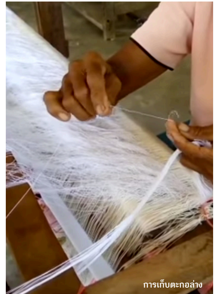
การเก็บตะกอล่าง