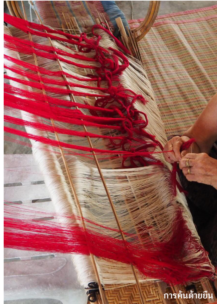
การค้นด้ายยืน