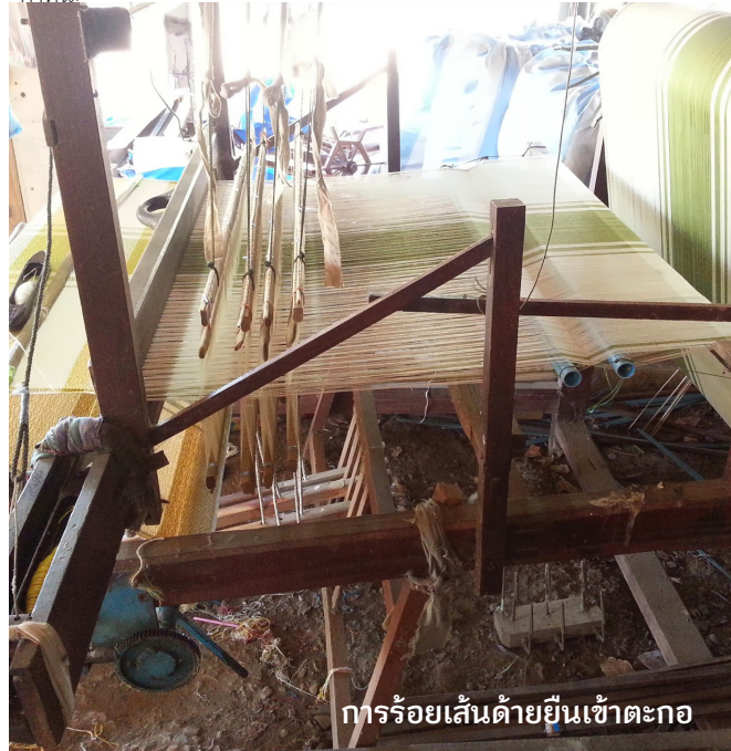
การร้อยเส้นด้ายยืนเข้าตะกอก