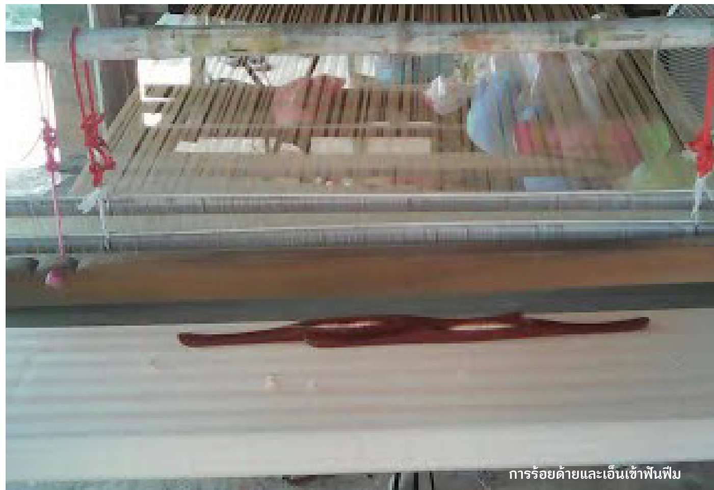
การร้อยด้ายและเอ็นเข้าพื้นพิมพ์