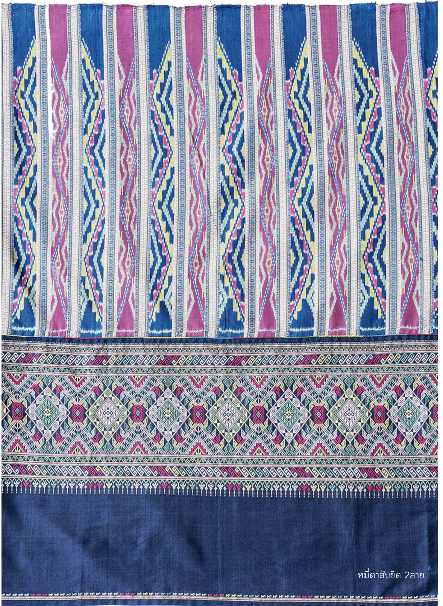
หมี่ตาสิบขีด 2ลาย