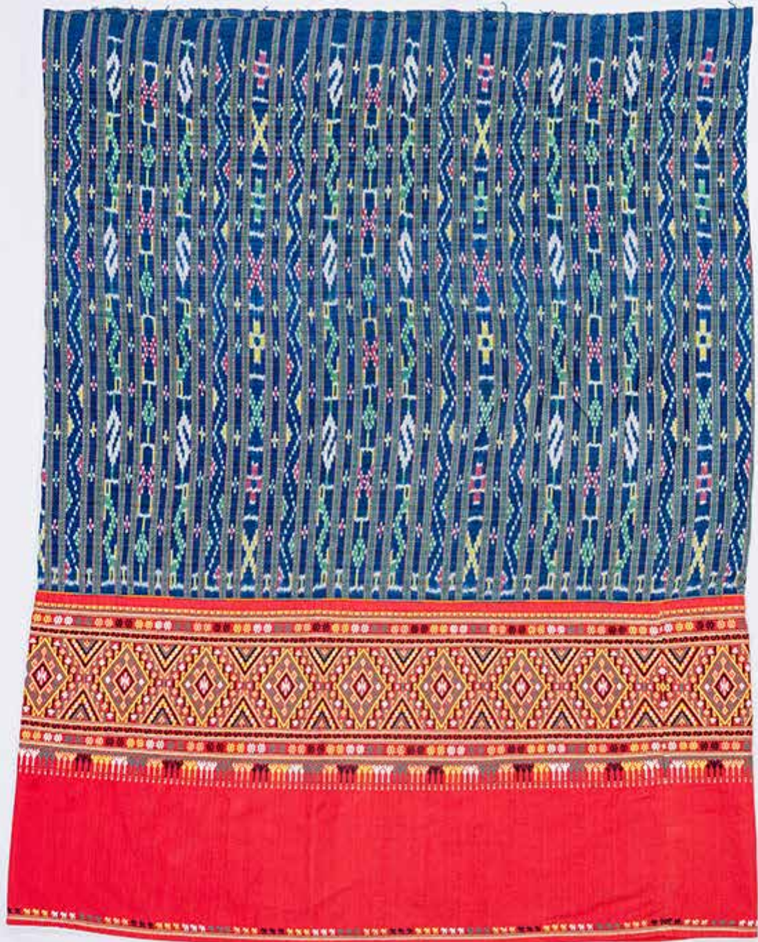
ชินหมีตา