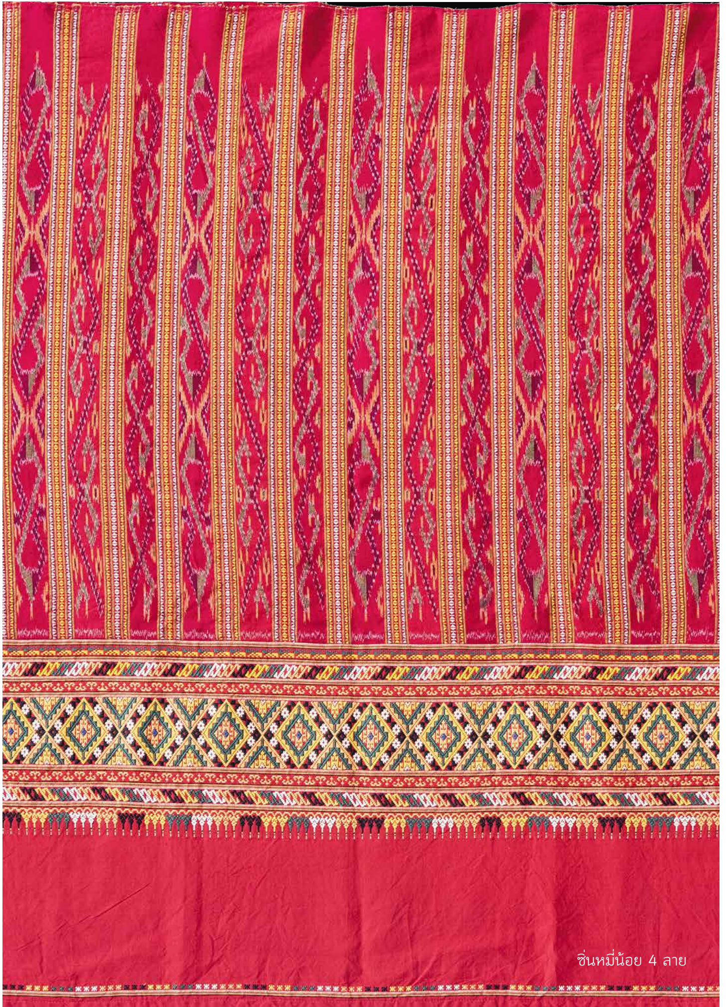
ชิ้นทอมีน้อย 4 ลาย