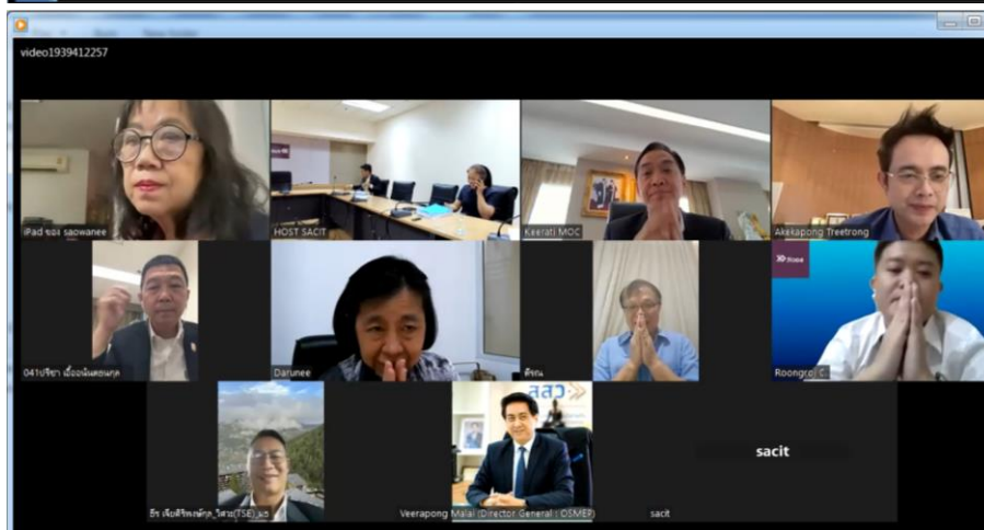
ภาพการประชุม