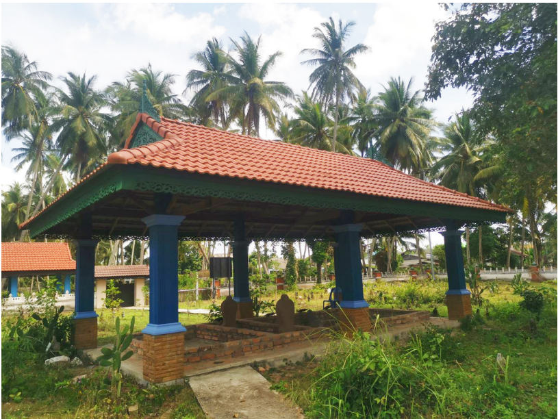
สุสานราชินี 3 องค์

บาราโหม มีคลองปาเราะ ไหลผ่านเชื่อมสู่อ่าวปัตตานีจึงเหมาะต่อการเป็นท่าเรือขนถ่ายสินค้ามาตั้งแต่โบราณ ซึ่งในอดีตการค้า พาณิชยท่าเรือแห่งนี้มีความรุ่งเรืองจากการเป็นเมืองท่าจนทำให้ปัตตานีเป็นที่รู้จักไปทั่วโลกมีการแลกเปลี่ยนทั้งการค้าขายศิลปวัฒนธรรม จากร่องรอยวัตถุโบราณ เช่น เครื่องถ้วยชาม ข้าวของเครื่องใช้ของผู้คน ในอดีตและเรื่องราวเหล่านี้ได้ถูกบันทึกผ่านลวดลายบนผืนผ้าบาติก ผ่านจินตนาการการออกแบบที่ได้แรงบันดาลใจมาจากลวดลายที่พบบนเศษกระเบื้องเครื่องถ้วยชามที่เป็นสัญลักษณ์ ของยุคการค้าขายกับจีนในอดีตของเมืองปัตตานี นอกจากนี้ยังมีการนำเอาวัฒนธรรม ท้องถิ่นต่าง ๆ อาทิ การดื่มชามายาประยุกต์เป็นลวดลายและสีบนผืนผ้าบาติก แห่งชุมชน บาราโหมแห่งนี้อีกด้วย