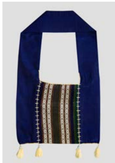
ถุงย่าม (ถุงย่าม) ลายยกมุก 8 เขา