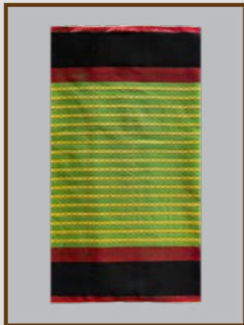
ผ้าชิ้นยกมุก ลายยกมุก 8 เขา