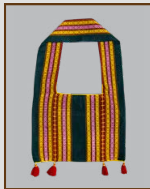
ถุงย่าม (ถุงย่าม) ลายยกมุก 8 เขา