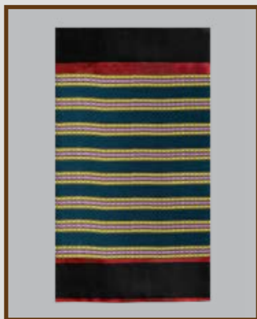
ผ้าชิ้นยกมุก ลายยกมุก 8 เขา