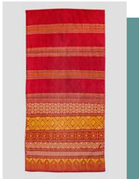
ผ้าห่ม ลายบายศรี

ไทยวน เป็นกลุ่มชาติพันธุ์หนึ่งที่มีการอพยพตั้งถิ่นฐานกระจายอยู่ในหลายพื้นที่ในประเทศไทย เช่น จังหวัดเชียงใหม่ จังหวัดลำปาง จังหวัดน่าน จังหวัดราชบุรี และจังหวัดสระบุรี และกลุ่มชาวไทยวนเมื่ออพยพไปอยู่ที่ใด ก็ได้นำภูมิปัญญาอันเป็นเอกลักษณ์ของชาวไทยวนติดตัวมาใช้ในการดำรงชีวิต และสร้างอาชีพจนถึงปัจจุบัน เช่น ภูมิปัญญาการทำอาหาร ภูมิปัญญาการสร้างที่อยู่อาศัย ภูมิปัญญาการทำเครื่องนุ่งห่ม เป็นต้น