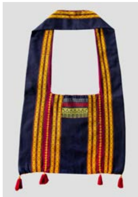
ถุงย่าม (ถุงย่าม) ลายยกมุก 8 เขา