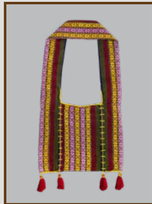
ถุงย่าม (ถุงย่าม) ลายยกมุก 8 เขา