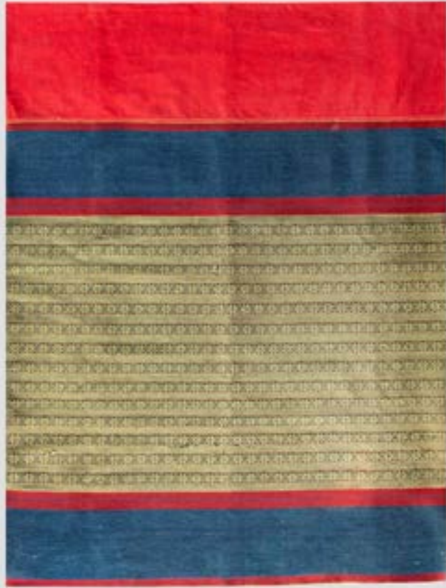
ผ้าซิ่นยกมุก ลายยกมุก 8 เขา