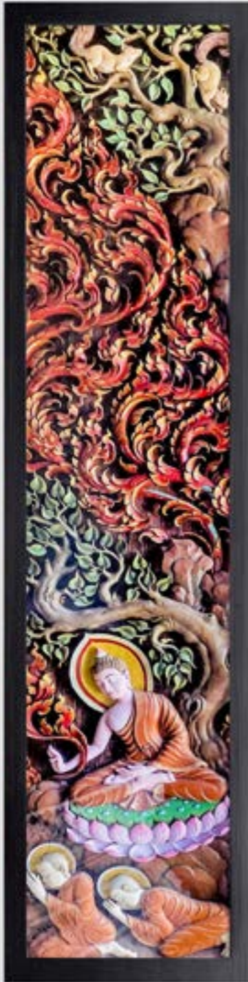
บานประตูไม้แกะสลักเป็นภาพวันมาฆบูชา