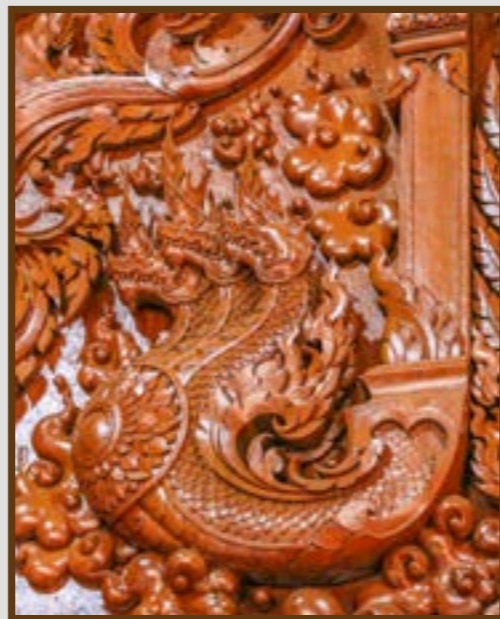
แกะสลักไม้เป็นภาพพญานาค