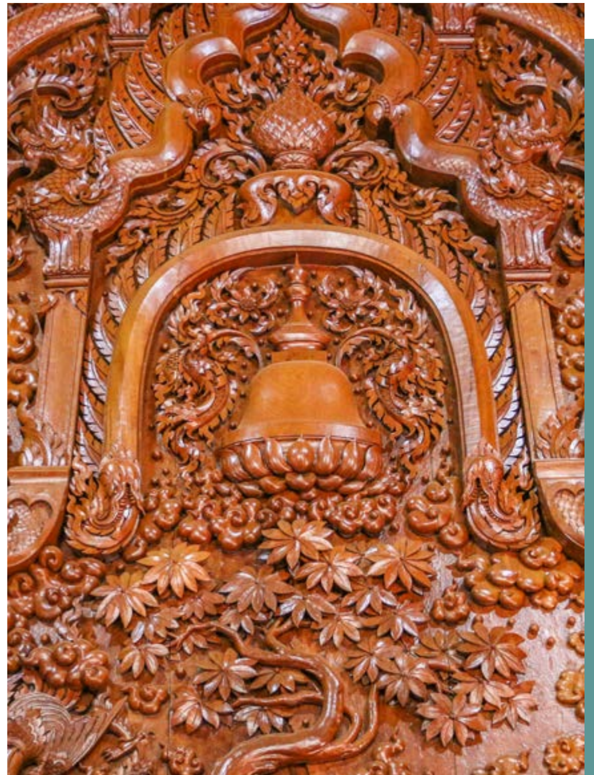
แกะสลักไม้เป็นเรื่องราวจุฬามณีเจดีย์บนสวรรค์