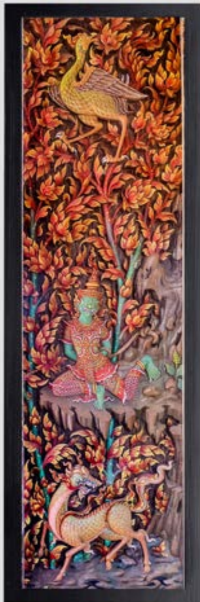
บานหน้าต่างไม้แกะสลักเป็นเรื่องราวเกียรติ