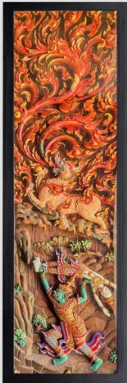
บานหน้าต่างไม้แกะสลักเป็นเรื่องราวเกียรติ