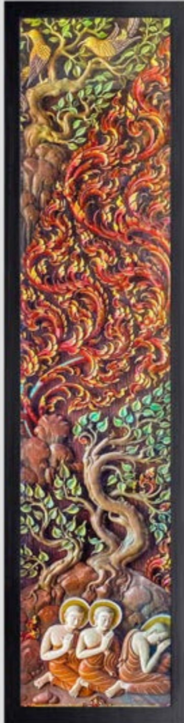
บานประตูไม้แกะสลักเป็นภาพวันมาฆบูชา