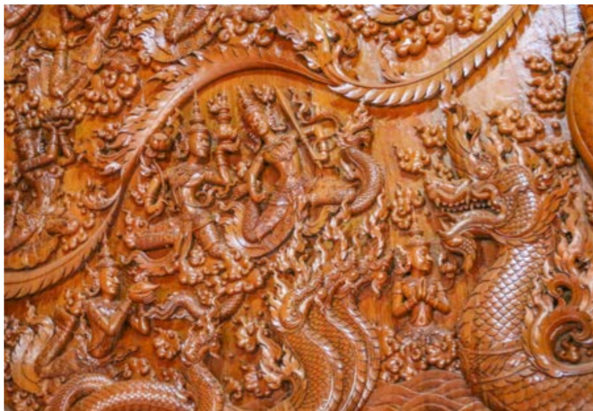
แกะสลักไม้เป็นภาพเรื่องราวเกี่ยวกับสวรรค์

งานแกะสลักไม้ เป็นงานหัตถกรรมที่มีมาแต่โบราณตั้งแต่สมัยก่อนประวัติศาสตร์ที่มนุษย์ได้มีวิวัฒนาการในการประดิษฐ์เครื่องใช้ที่ทำจากไม้ให้เกิดเป็นรูปทรงต่าง ๆ มาตั้งแต่สมัยอดีต แต่ด้วยไม้เป็นวัสดุที่สามารถเสื่อมสลายได้ ในปัจจุบันจึงแทบไม่หลงเหลืองานแกะสลักไม้แบบโบราณดั้งเดิมปรากฏเป็นหลักฐานมากนัก