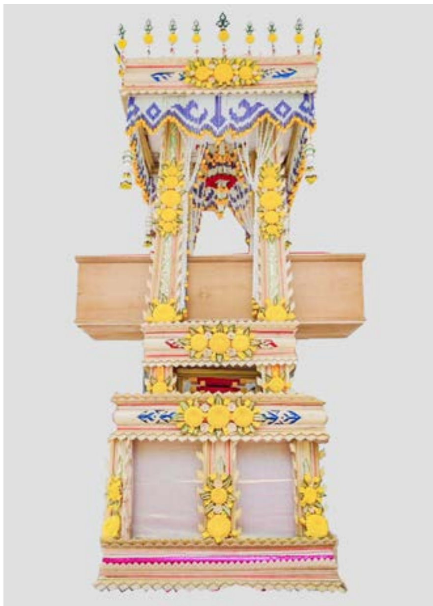
แหงหยวกก่อเป็นเชิงตะกอน

งานแหงหยวก เป็นงานจิตรศิลป์ที่มีมาแต่โบราณ เป็นงานช่างฝีมือที่ต้องใช้มีดสองคมแทงลงไปบนกากกล้วยให้เกิดลวดลาย งานแหงหยวกจำแนกได้ 2 ลักษณะ คือ งานแหงหยวกแบบราชสำนักในสมัยโบราณ และงานแหงหยวกแบบสกุลช่างทั่วไป โดยกลุ่มช่างแหงหยวกที่ยังคงสืบทอดมาจนถึงปัจจุบันเหลืออยู่เพียงไม่กี่แห่ง เช่น กลุ่มช่างแหงหยวกสกุลช่างเพชรบุรี สงขลา พระนครศรีอยุธยา อ่างทอง เป็นต้น และหนึ่งในนั้นคือช่างแหงหยวกสายตระกูลวัดอัปสรสวรรค์ ย่านภาษีเจริญ ที่ยังคงไม่ละทิ้งภูมิปัญญาการแหงหยวกและสืบทอดกระบวนการทำงานจากบรรพบุรุษเรื่อยมาจนถึงปัจจุบัน