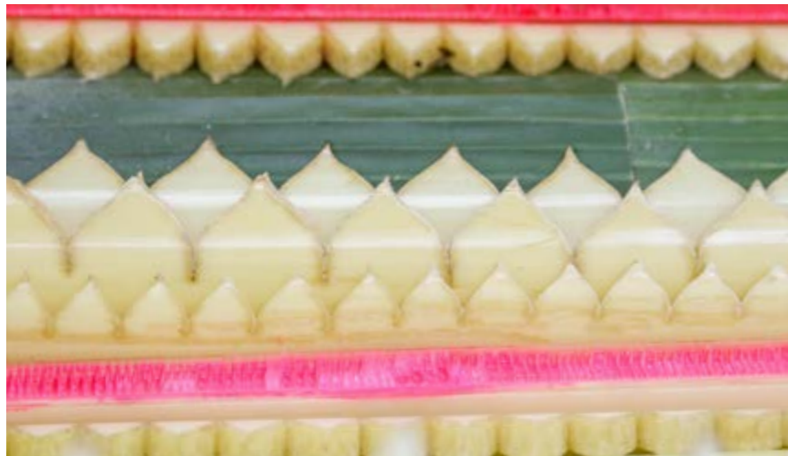
แทงหยวก ลายฟันปลา