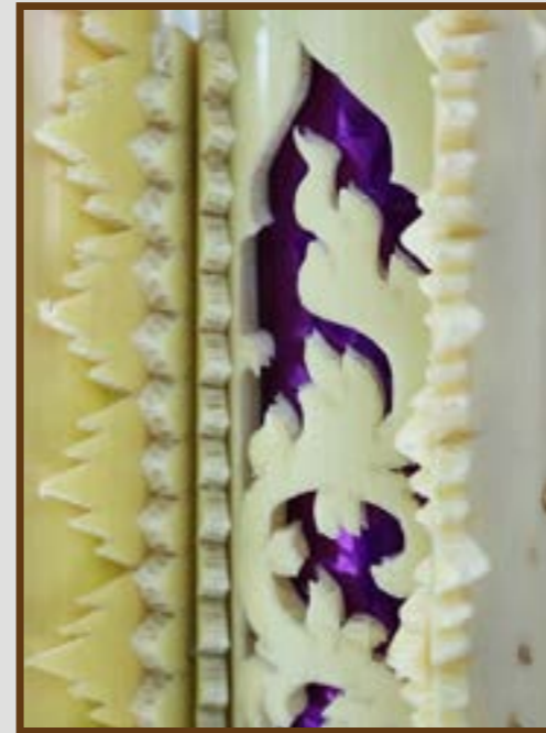
แทงหยวก ลายเสารูปกนก