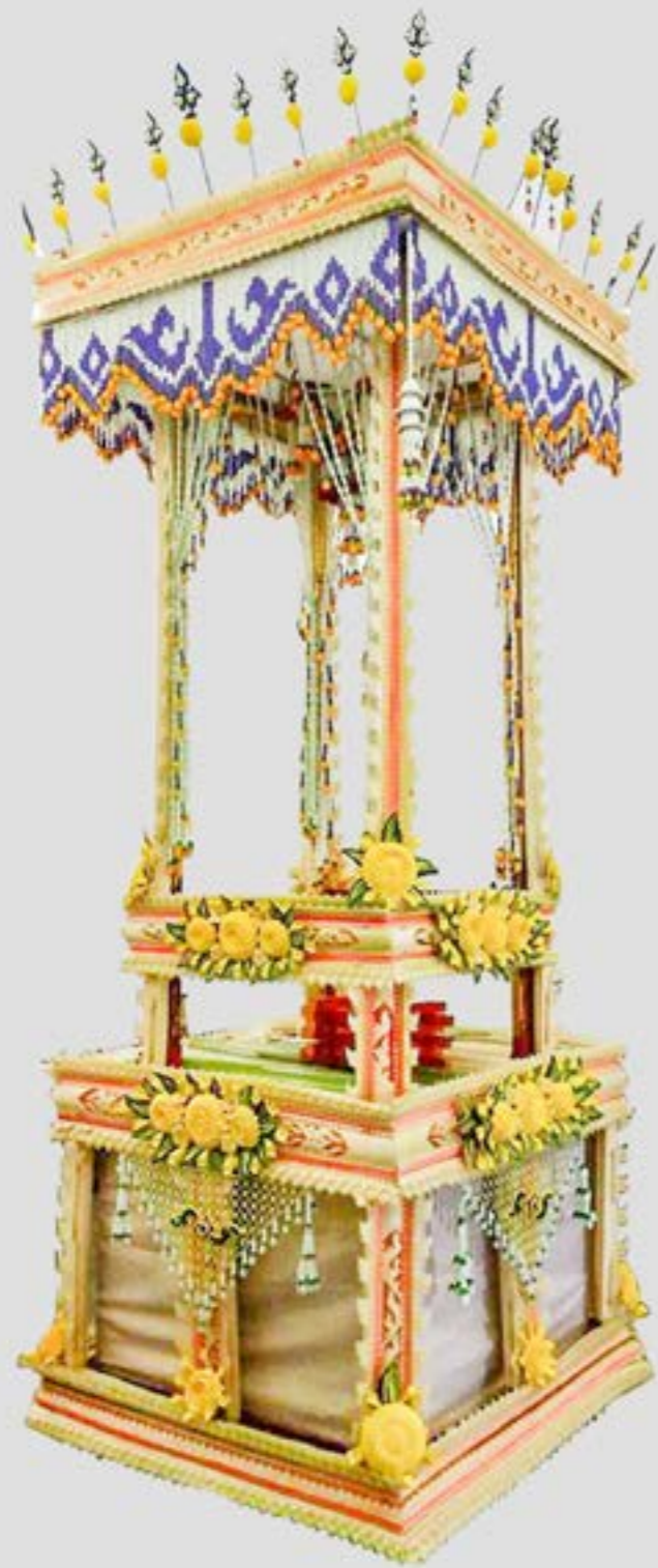
แทงหยวกก่อเป็นเชิงตะกอน