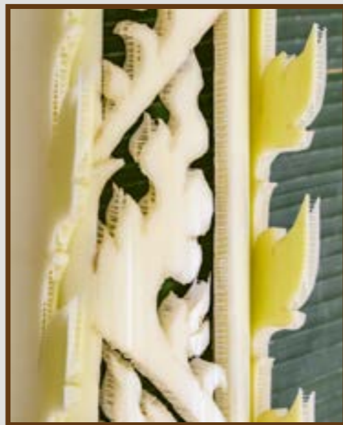
แทงหยวก ลายกนกเปลว