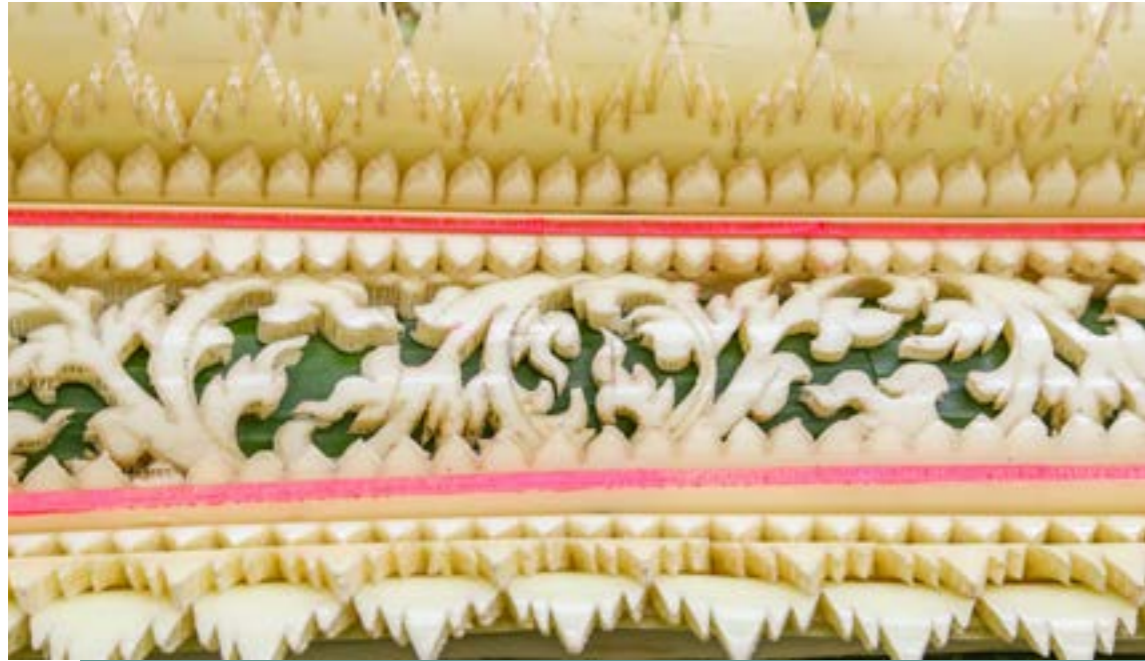
แทงหยวก ลายเกลียวกนก