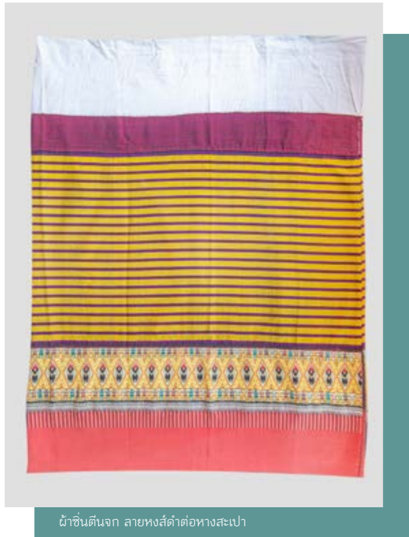
ผ้าซิ่นตีนจก ลายหงส์ดำต่อหางสะเปา

แม่แจ่ม เป็นอำเภอหนึ่งในจังหวัดเชียงใหม่ ประชาชนส่วนใหญ่เป็นคนในพื้นที่ราบลุ่มที่จัดอยู่ในกลุ่มวัฒนธรรมไทยวน วิถีชีวิตของคนแม่แจ่มยังคงมีเอกลักษณ์เฉพาะตนซึ่งยังคงรักษาสภาพธรรมชาติ ความเชื่อ ประเพณี วัฒนธรรม และรูปแบบวิถีชีวิตของชาวล้านนาในแบบอดีตกาลไว้ได้ค่อนข้างมาก โดยเฉพาะการทอผ้าตีนจก ที่คงเอกลักษณ์ดั้งเดิมที่สืบทอดมาจากบรรพบุรุษจากอดีต และยังคงดำรงอยู่จนถึงทุกวันนี้ แม่แจ่มจึงถือได้ว่าเป็นชุมชนหนึ่งที่มีการทอผ้าซิ่นตีนจกสืบทอดมาถึงวันนี้