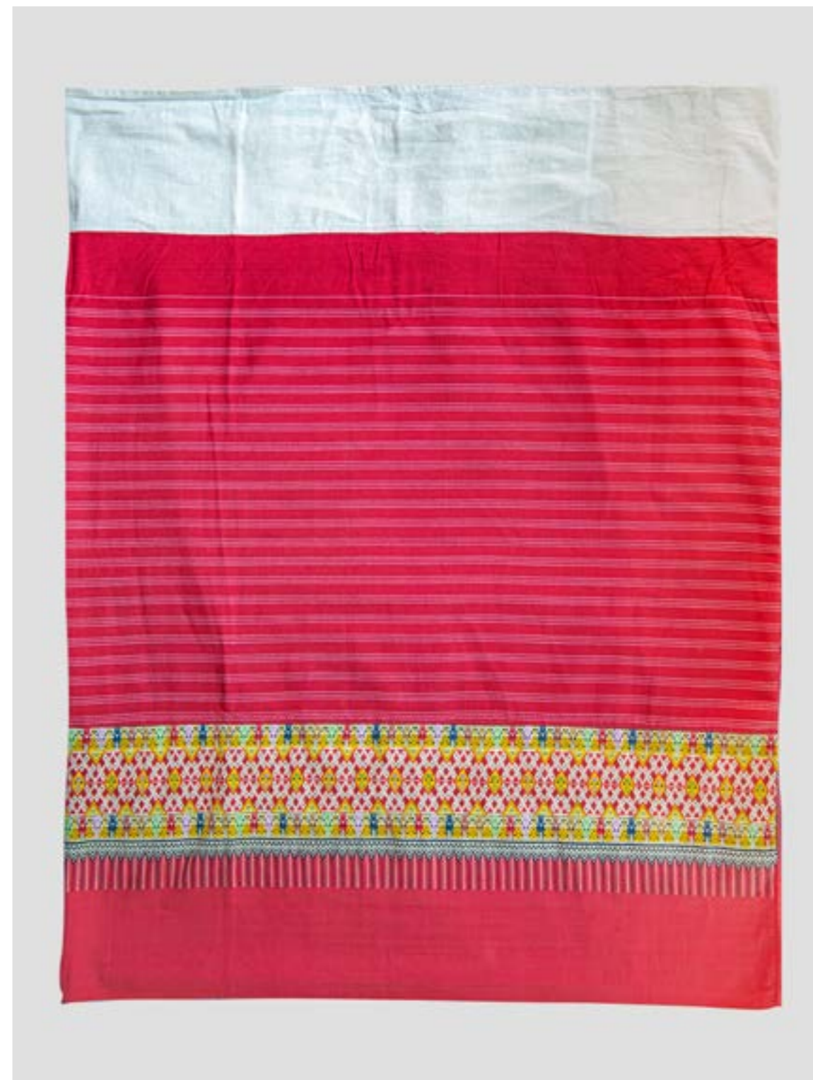
ผ้าซิ่นตีนจก ลายนกนอนต่อหางสะเปา