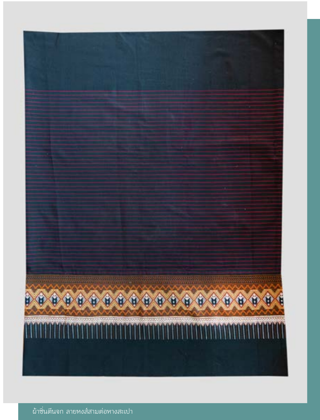
ผ้าชิ้นตีนจก ลายหงส์สามต่อหางสะเปา