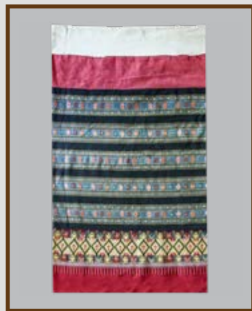
ผ้าซิ่นตีนจก ลายแม่แจ่มต่อหางสะเปา