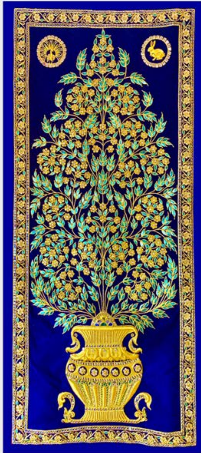
ผ้าปักด้วยกระจกกินและดินทอง ลายหม้อบูรณขงูะ