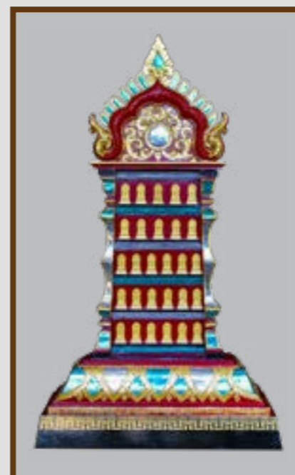
แผงพระพิมพ์พระเจ้า 28 พระองค์