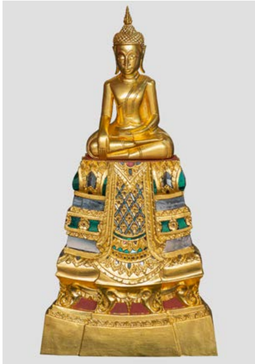
พระพุทธรูป ฐานประดับกระจกเกรียบ

กระจกเกรียบ ถือเป็นกระจกโบราณ เป็นศาสตร์แขนงหนึ่งของงานช่างสิบหมู่โบราณในงานประดับกระจกสี ที่เคยแสดงถึงความเจริญรุ่งเรืองของประเทศไทยที่มีมานานนับหลายร้อยปี ใช้สำหรับการประดับลวดลายอันละเอียดอ่อน วิจิตรงดงามมาแต่โบราณ เช่น ประดับฐานพระพุทธรูป ประดับมณฑป ผนังโบสถ์ บุชบก ประดับสัตว์ภัณฑ์ เครื่องราชภัณฑ์ต่าง ๆ เป็นต้น และการหุงกระจกก็เป็นหนึ่งในภูมิปัญญาที่สะท้อนถึงศาสตร์เชิงช่างของไทยแต่โบราณ หากแต่ว่าการหุงกระจกเกรียบกลับสูญหายไปจากประเทศไทยมานานกว่า 150 ปี หรือในช่วงรัชสมัยสมเด็จพระจุลจอมเกล้าเจ้าอยู่หัวมหาราชที่ชาวต่างชาติเข้ามามีอิทธิพลอย่างมากในประเทศไทย การหุงกระจกหรือผลิตกระจกจึงแปรเปลี่ยนเป็นการนำเข้ากระจกจากต่างประเทศ หรือใช้วัสดุอื่น ๆ มาประดับแทนการใช้งานกระจก