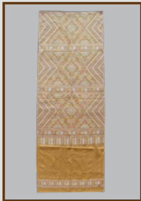
ผ้าคลุมไหล่แพรวา สีธรรมชาติ