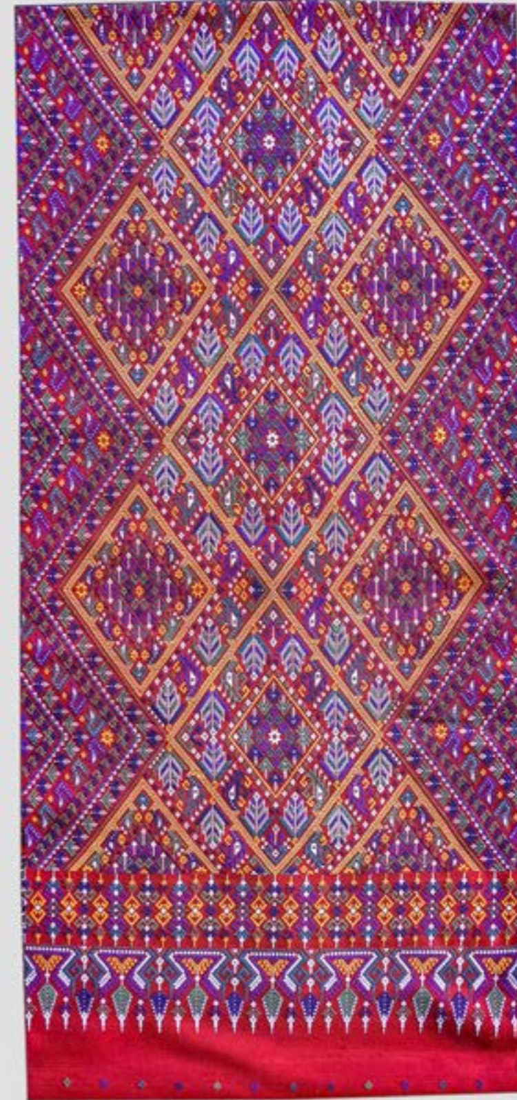
ผ้าคลุมไหล่แพรวา