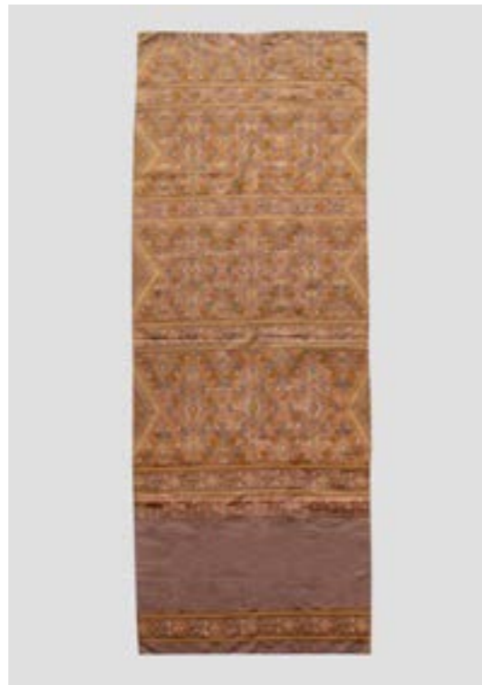
ผ้าคลุมไหล่แพรวา สีธรรมชาติ