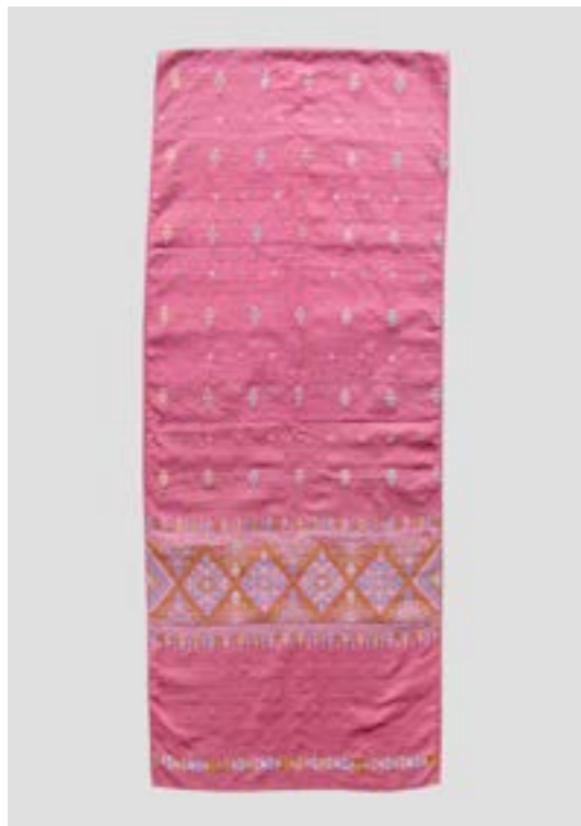
ผ้าคลุมไหล่แพรวา สีธรรมชาติ