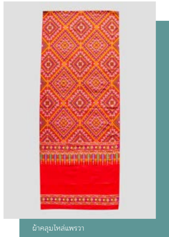
ผ้าคลุมไหล่แพรวา

ผ้าแพรวา หรือ ผ้าไหมแพรวา เป็นเอกลักษณ์ของชาวผู้ไทยหรือภูไท การทอผ้าแพรวามีมาพร้อมกับวัฒนธรรมของชาวภูไทที่มีภูมิปัญญาในการทอเพื่อให้เกิดลวดลายมีลักษณะผสมผสานกันระหว่างการขีด กับการจก สืบทอดภูมิปัญญาจากรุ่นสู่รุ่นตั้งแต่สมัยบรรพบุรุษและพัฒนาอย่างต่อเนื่อง ผ้าแพรวาจึงเปรียบเสมือนเป็นสัญลักษณ์ของชาวภูไท ที่มีความงดงามและยังคงสืบทอดต่อกันมาจนถึงปัจจุบัน