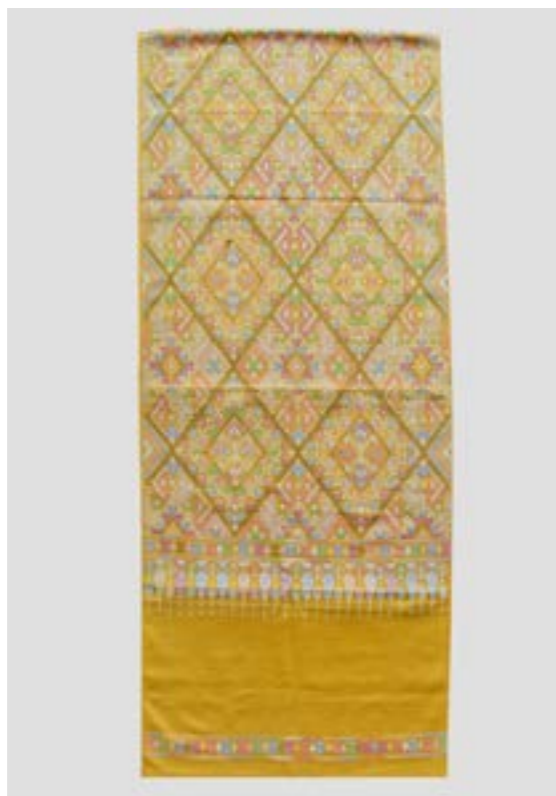
ผ้าคลุมไหล่แพรวา สีธรรมชาติ