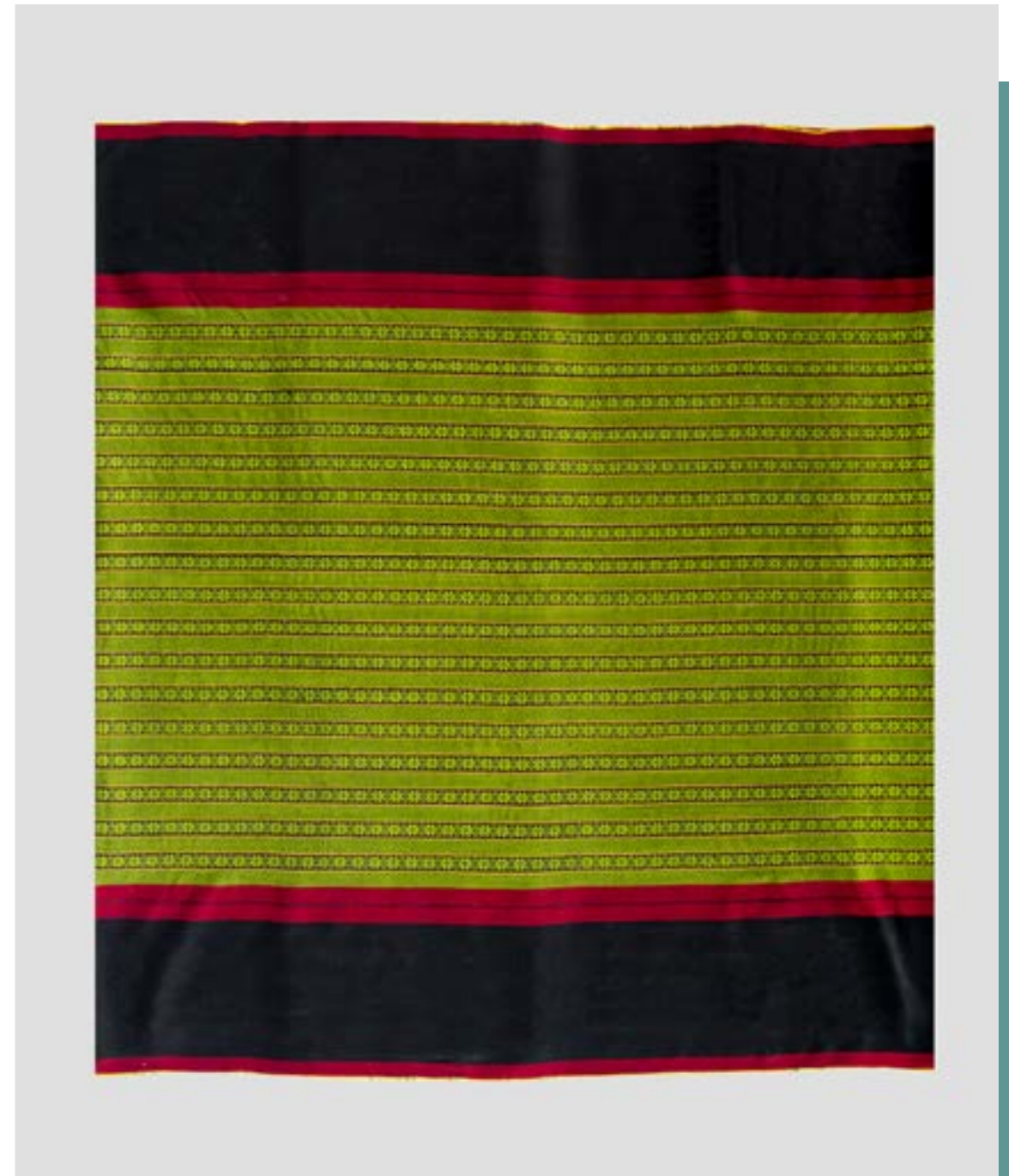
ผ้าขึ้นมุก ลายยกมุก 8 เซา