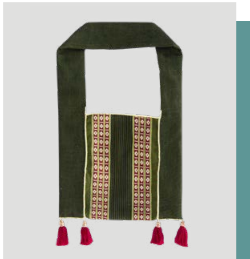
ดงมุก (ดงย่าม) ลายยกมุก 4 เซา