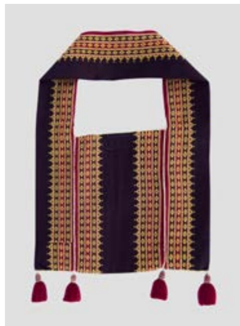
ดงมุก (ถุงย่าม) ลายยกมุก 3 เซา