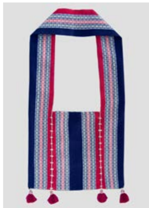
ดงมุก (ถุงย่าม) ลายยกมุก 6 เซา