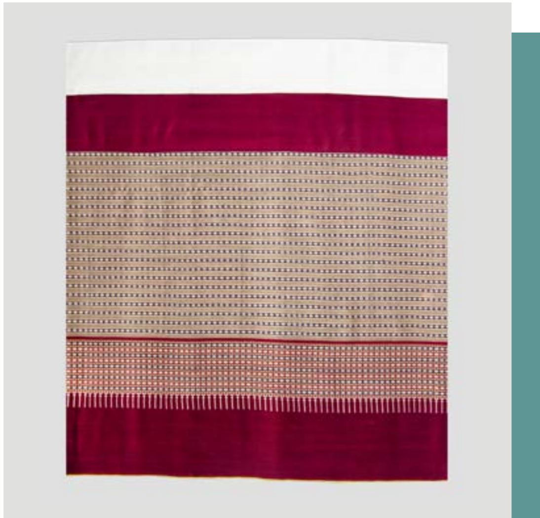
ผ้าชิ้นมุก ลายยกมุก 3 เซา