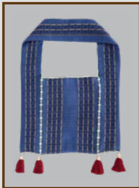
ดงมุก (ถุงย่าม) ลายยกมุก 6 เซา