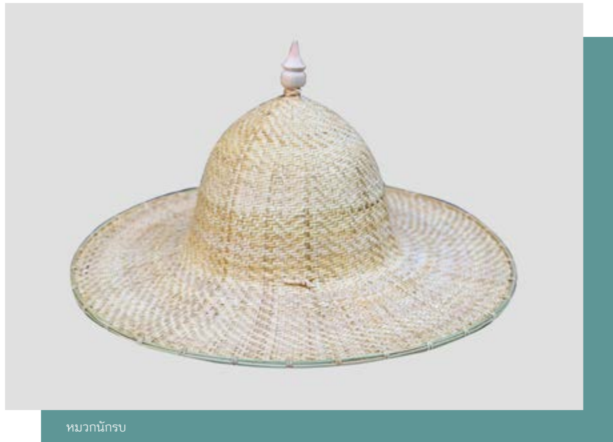
หมวกนักรบ