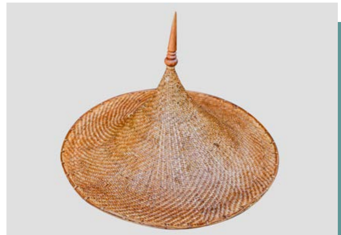
กูปละแอฟ