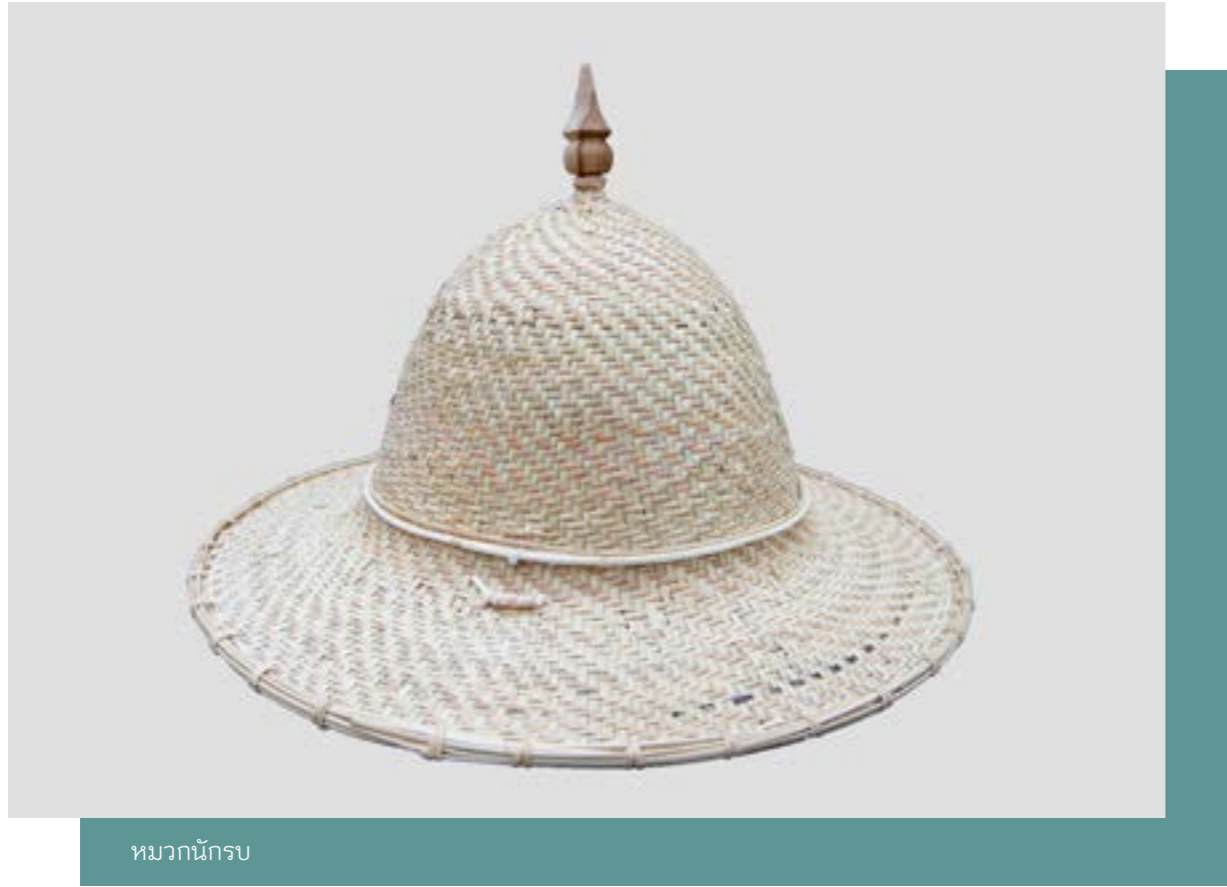
หมวกนักรบ