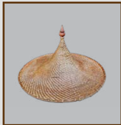
กูปละแอฟ