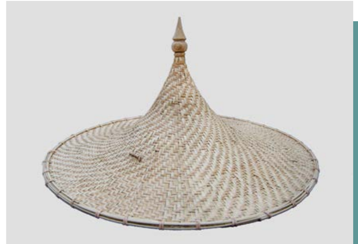
กูปละแอฟ