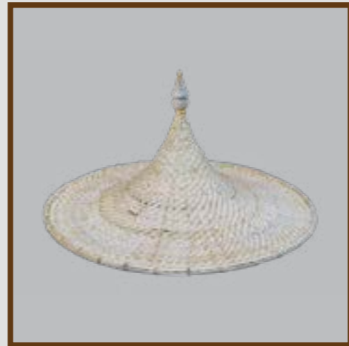
กูปละแอฟ

เอกลักษณ์ผลงานการสานกูปละแอฟมีोनายแสวง มีความโดดเด่นที่ความละเอียดในการสานไม้ไผ่ได้แนบชิดโดยไม่เห็นช่องโหว่ สานด้วยลายเอกลักษณ์เฉพาะตัวของนายแสวง คือ ลายสอง ที่สานให้มีลักษณะคล้ายชั้นบันได ผู้พบเห็นจะทราบได้ทันทีว่าเป็นกูปละแอฟมีโอการทำของนายแสวง