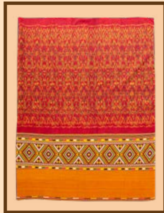
ผ้าชิ้นหมี่น้อย ต่อต้นจกลายกระเบียดดอกน้อย