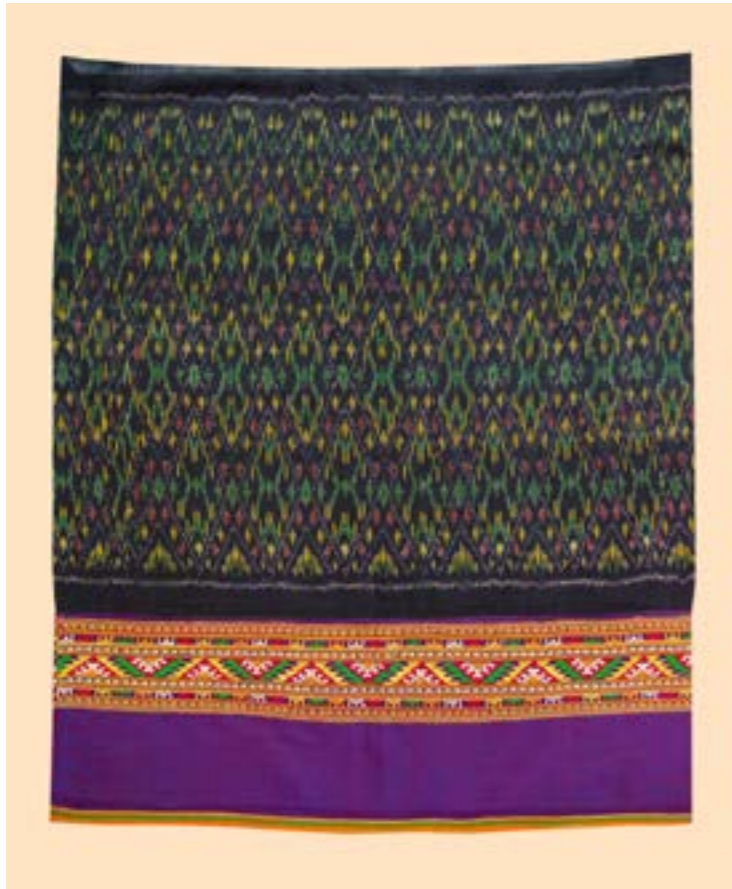
ผ้าชิ้นหมี่กระป็น ต่อดิ้นจกกลายกาบดอกน้อยครึ่งดอก