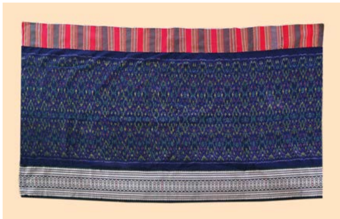
ผ้าซิ่นมัดหมี่ลายกะปิน ต่อดิ้นจกลายขีด