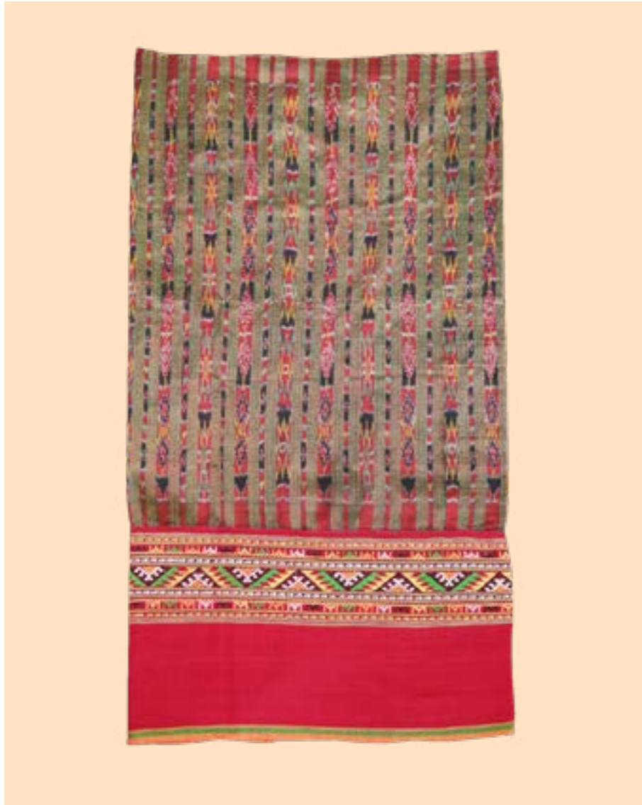
ผ้าชิ้นหมี่น้อย ต่อดิ้นจกสายกาบ

ชุมชนลาวครึ่งในประเทศไทย นับเป็นชุมชนต้นแบบที่ยังคงเอกลักษณ์ ประเพณีและวัฒนธรรมของตนเองไว้ได้อย่างเหนียวแน่น โดยเฉพาะภูมิปัญญาด้านการทอ “ผ้าชิ้นติ้นจก” ที่ถือเป็นเอกลักษณ์อันโดดเด่นของชาวลาวครึ่งที่ถูกสืบทอดต่อกันมาจากรุ่นสู่รุ่นจนถึงปัจจุบัน ด้วยเทคนิคการสร้างลวดลายด้วยวิธีการจก ที่นิยมใช้ด้ายสีแดงย้อมด้วยครั่ง นำมาสร้างสรรค์เป็นเครื่องแต่งกายที่สะท้อนความเป็นตัวตนของชาวลาวครึ่งได้อย่างสมบูรณ์