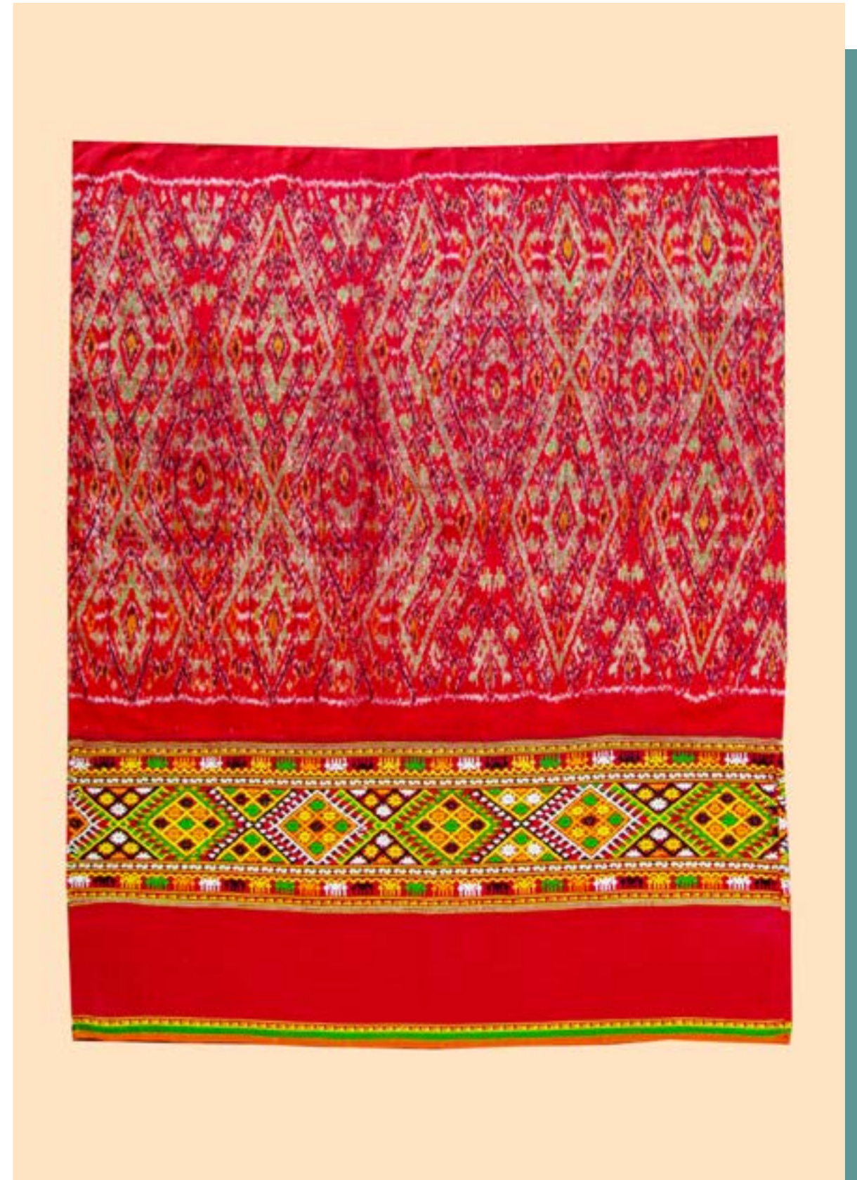
ผ้าชิ้นหมี่หงส์ ต่อต้นจกลายดอกแก้ว