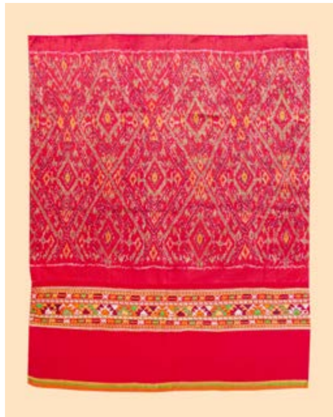
ผ้าชิ้นหมี่หวน ต่อดิ้นจกกลายกาบอีป่าลิมผิว