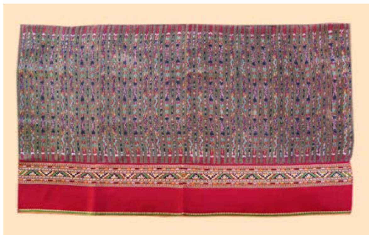
ผ้าซิ่นมัดหมี่ลายขอ ต่อดิ้นจกลายกาบ