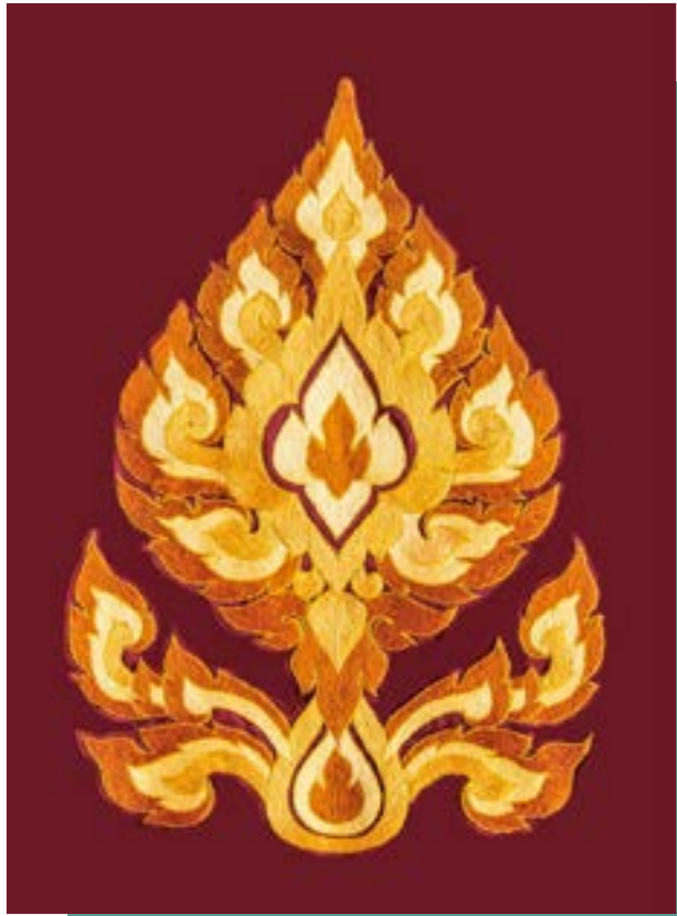
ผลงานปักชอย ลายพุ่มข้าวบิณฑ์