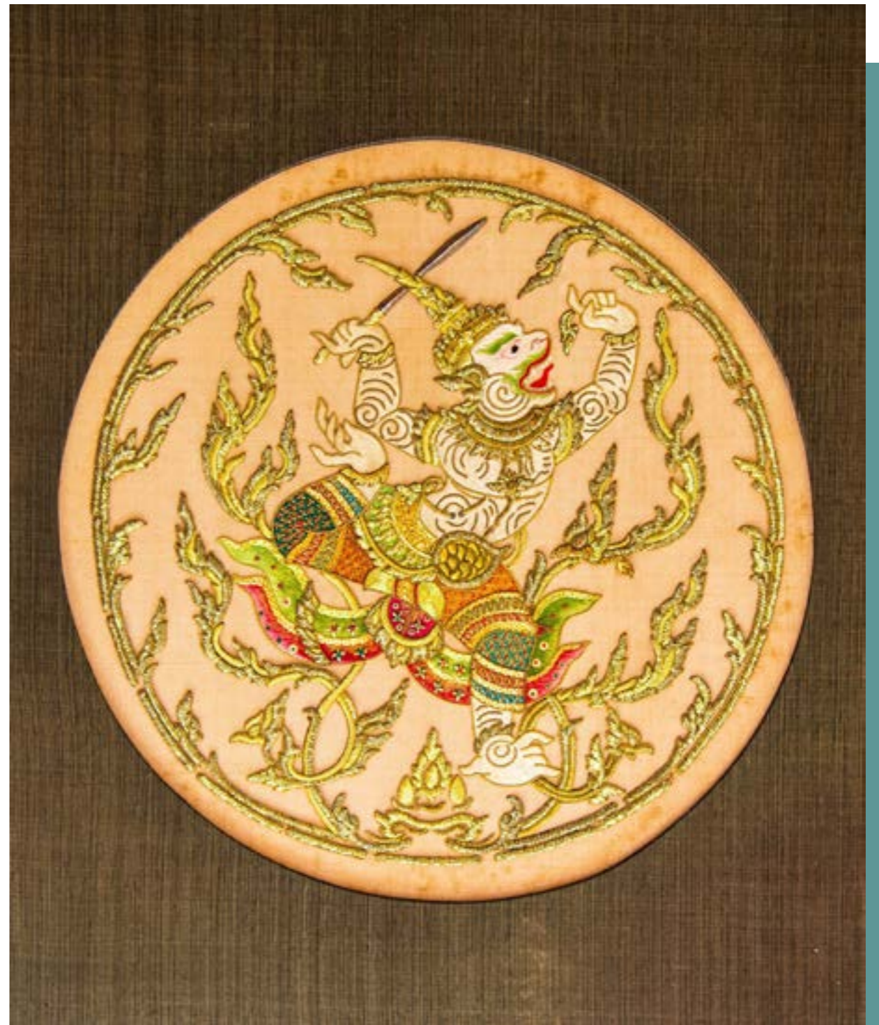
ผลงานปักดินและปักชอย ลายหนุมาน