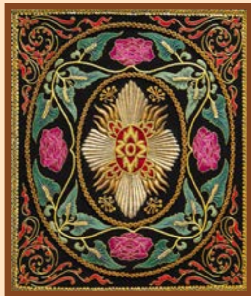
ผลงานปักลายดอกพุดตาน ล้อมด้วยเถากุหลาบ