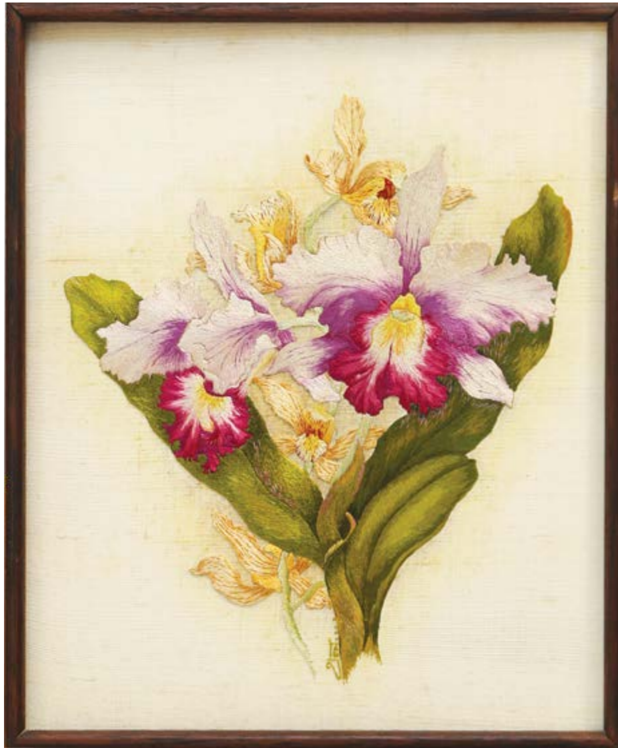
ผลงานปักชอย ลายดอกกล้วยไม้