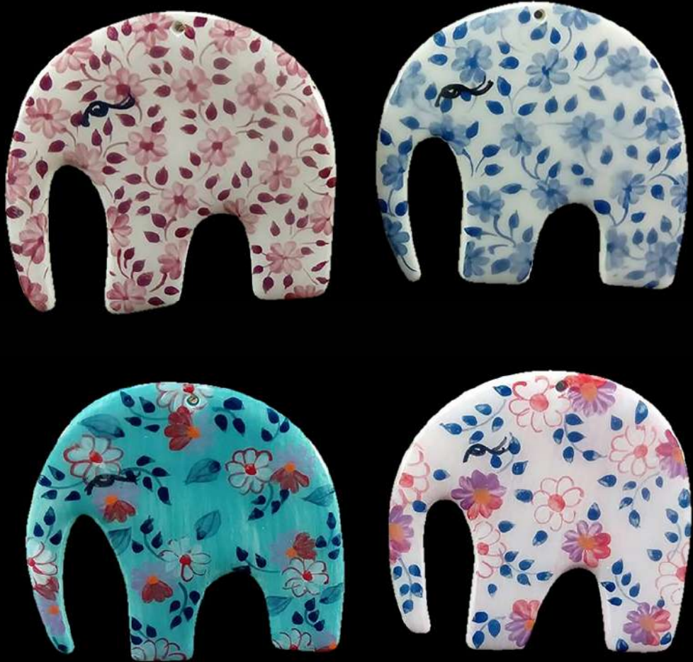
เซ็่มก๊ัดเซรามิก รูปช้าง