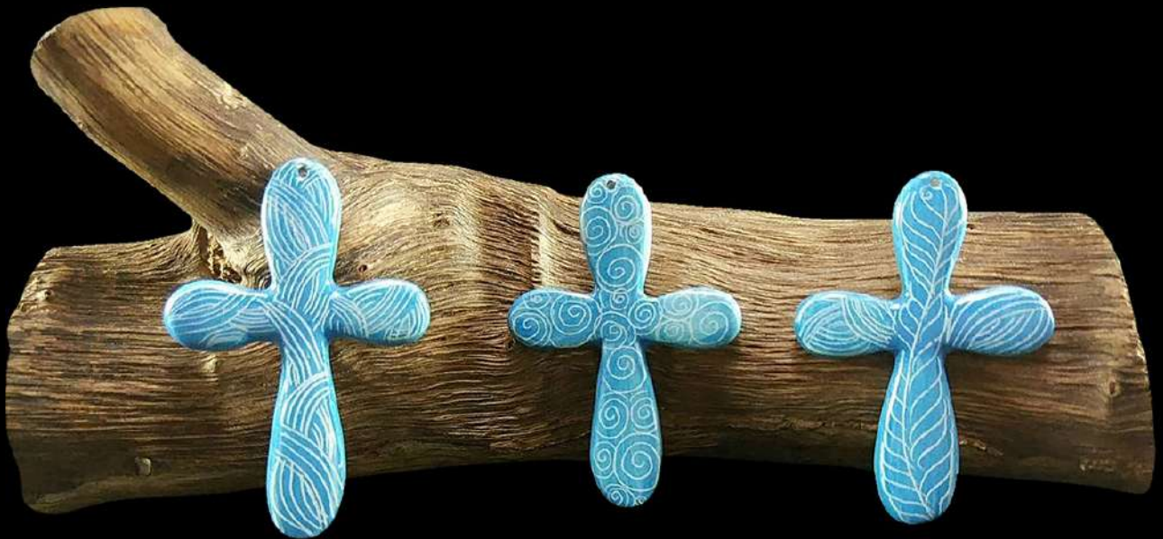
ต่างหูเซรามิก ลายธรรมชาติ