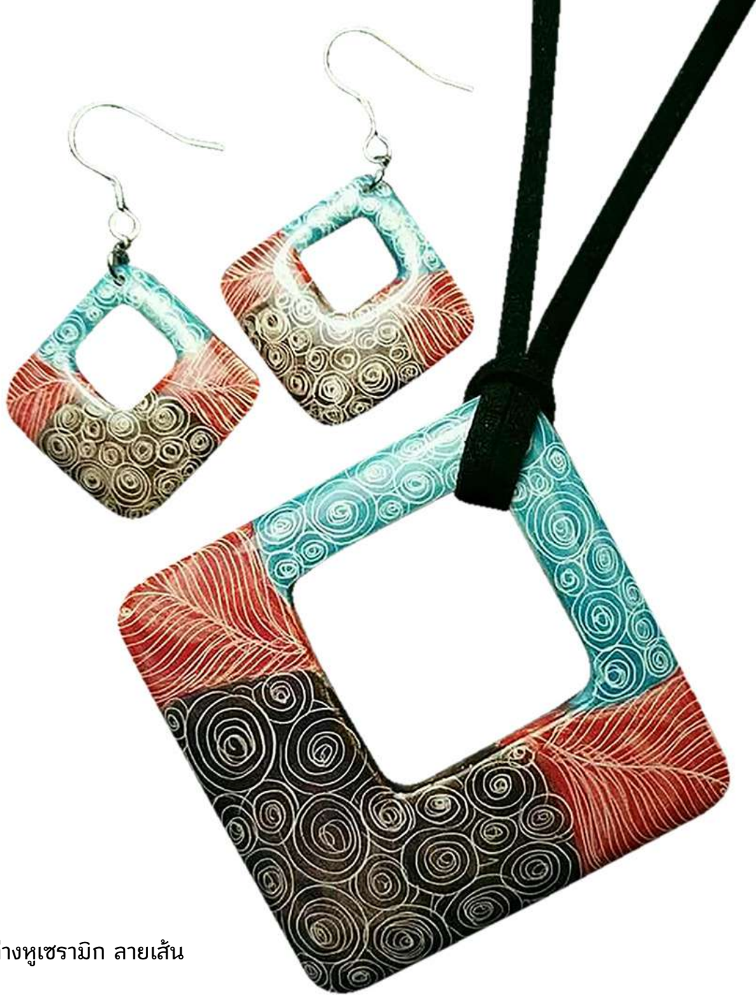
สร้อยคอและต่างหูเซรามิก ลายเส้น