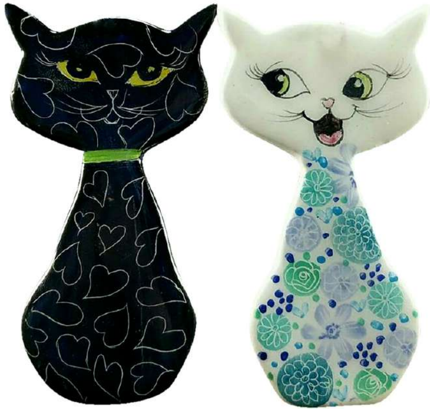
เซรามิกรูปแมว