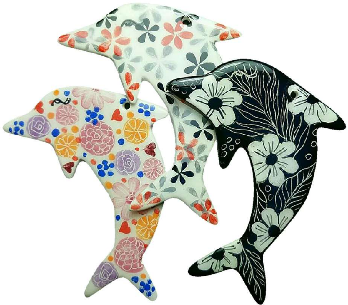
เซรามิก ลวดลาย รูปโลมา