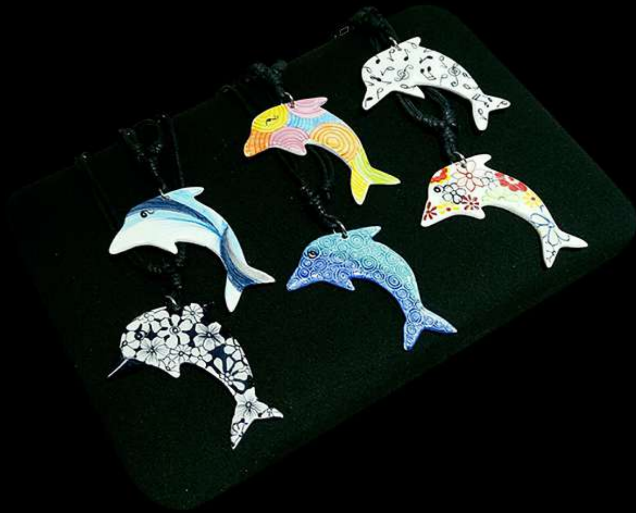
สร้อยคอเซรามิก รูปโลมา