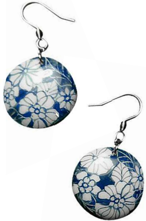
สร้อยคอและต่างหูเซรามิก ลายดอกไม้

จากความชำนาญและประสบการณ์ที่สั่งสมมาอย่างยาวนาน ทำให้ผลงานของนางสาวณภัทรมีลวดลายที่โดดเด่นสะดุดตา สร้างความพึงพอใจให้กับผู้ที่พบเห็นได้เป็นอย่างมาก ผลงานที่สร้างความภาคภูมิใจให้แก่นางสาวณภัทร คือ “สร้อยคอต่างหูลวดลายเต่าทองสีน้ำเงิน” ซึ่งเป็นผลงานที่มีเอกลักษณ์และได้รับความนิยมจากชาวต่างชาติเป็นอย่างมาก โดยผลงานจะมีความร่วมสมัยเข้ากับยุคในปัจจุบัน ผลงานมีความละเอียดสวยงาม โดยรูปทรงเต่าทองสร้างมาจากความคิดสร้างสรรค์ของนางสาวณภัทรที่อยากจะออกแบบรูปทรงแปลกใหม่ ไม่ซ้ำใคร และเป็นผลงานที่สร้างชื่อเสียงให้แก่นางสาวณภัทรมาจนถึงปัจจุบัน