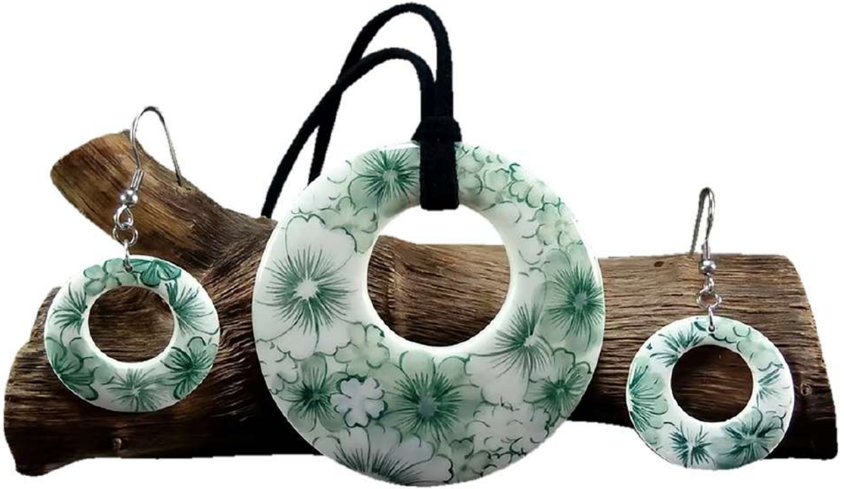
สร้อยคอและต่างหูเซรามิก ลายดอกไม้

เครื่องประดับเซรามิก ถูกสร้างสรรค์จากความสามารถของช่าง ที่สามารถ ออกแบบและย่อขนาดให้เซรามิกที่มีขนาดใหญ่ย่อให้มีขนาดเล็กและมาอยู่ในรูปแบบ ของเครื่องประดับ โดยต้องใช้ความรู้และความสามารถเป็นอย่างมากจึงจะทำให้ผล งานเครื่องประดับเซรามิกมีความสวยงาม โดดเด่น และเป็นที่ชื่นชอบของบุคคลโดย ทั่วไป