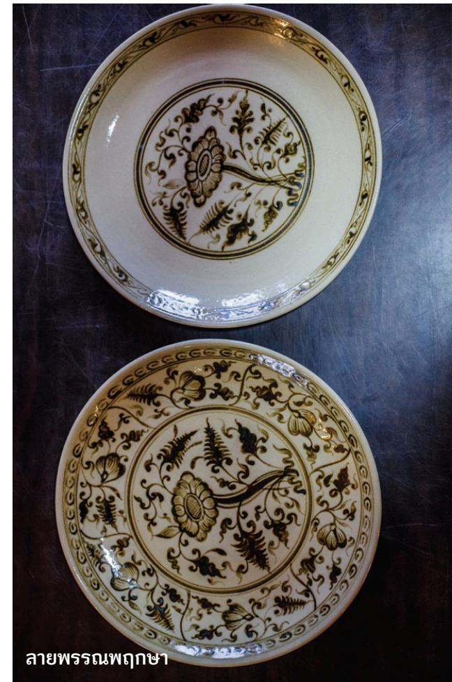
ลายพรรณพฤกษา