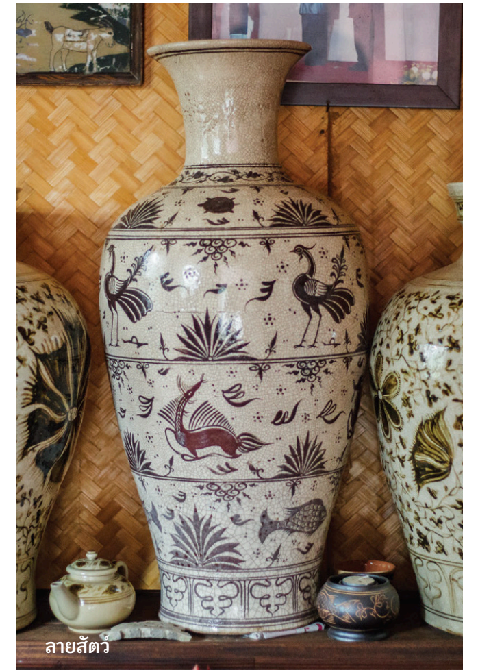
ลายสัตว์