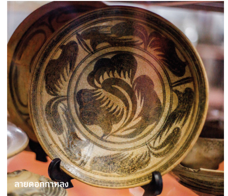
ลายดอกกาหลง