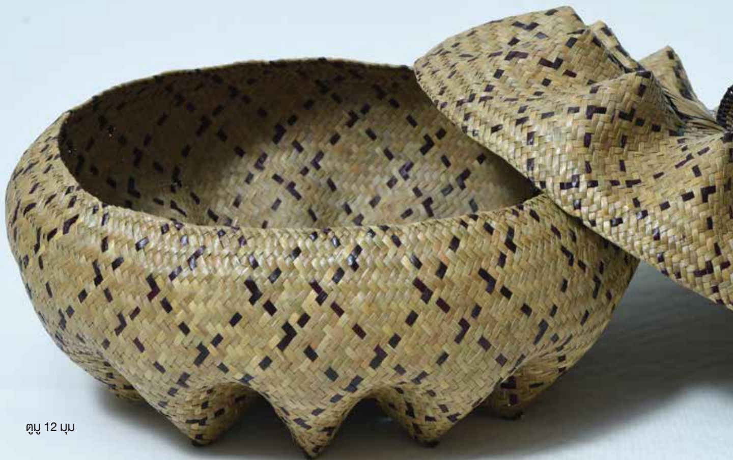
ตุ้ม 12 มุม

“ต้นกระจูดจากป่าพรุบ้านทอนอามาน สู่งานหัตถศิลป์อันทรงคุณค่า”