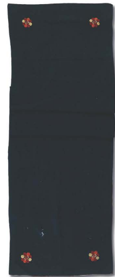
ผ้าเปี้ยว

ผ้าเปี้ยว เป็นอีกหนึ่งสัญลักษณ์ของผู้หญิงชาวไททรงดำที่ต้องมี ประจำตัว ผ้าเปี้ยวเป็นแถบผ้าฝ้ายทอมือสีครามเข้มเกือบดำ มีลวดลาย ปักประดับเป็นลวดลายของเส้นด้ายสีต่างๆ สลับสีกัน ขดเป็นวงกลมอย่าง งดงามมี ๔ ขด ที่ริมชายผ้าด้านละ ๒ ดอก ปัจจุบันผ้าเปี้ยวนี้ยังใช้กันอยู่ ในกลุ่มชาวลาวโซ่ง หรือไททรงดำใช้คล้องคอ หรือคาดอก หรือใช้เป็นผ้า โปกศึรชะ ส่วนผู้ที่มีอายุใช้ห่มเฉียงป่า เวลาไปวัด หรือ ไปงานสำคัญๆ ผ้าเปี้ยวสีครามเข้มเกือบดำใช้ห่มให้ผู้ที่เสียชีวิต โดยมีคติความเชื่อ ว่า ห่มผ้าเปี้ยวไปเก็บมะม่วงในป่าหิมพานต์ ไปเผ้าถน (เผ้าเทวดา) จะต้อง ไปพบญาติที่ตายไปก่อนจึงต้องแต่งตัวให้ดี เพื่อให้ญาติที่ตายไปก่อนจำ หน้าได้ ชาวลาวโซ่ง หรือไททรงดำจึงต้องมีผ้าเปี้ยวเป็นผ้าประจำตัวกัน ทุกคน