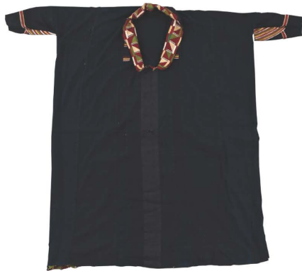
เสื้อฮีด้านนอก

เสื้อที่ใช้สวมใส่ในพิธีกรรมเรียกว่า “เสื้อฮี” จะจัดทำขึ้นเป็นพิเศษและประณีต มีการปักลวดลายตกแต่งด้วยเส้นไหมสีฉูดฉาดลงบนผืนผ้าสีดำด้วยผ้าไหมชิ้นเล็กๆ เรียกว่า “เสื้อฮี” เสื้อฮีผู้หญิงใส่ได้สองด้านด้านนอกมีลวดลายเพียงเล็กน้อยตกแต่งไว้ให้เพียงพอกับความสวยงาม เสื้อฮีที่เป็นด้านนอกจะใช้งานมงคล เช่น งานแต่งงาน งานเสนาเรื่อน ส่วนเสื้อด้านในจะตกแต่งอย่างสวยงามด้วยการปักด้วยผ้าไหมสีขาว สีเขียว สีแดงเลือดหมู สีแสด สีชมพู ปักตกแต่งเป็นลวดลายอย่างงดงาม อาจมีการติดประดับด้วยกระจกชิ้นเล็กๆ เสื้อฮีด้านในนี้จะใช้ในงานอวมงคล เช่น งานศพ หรือบางแห่งนำมาใส่ให้ศพหรือคลุมโลงศพ