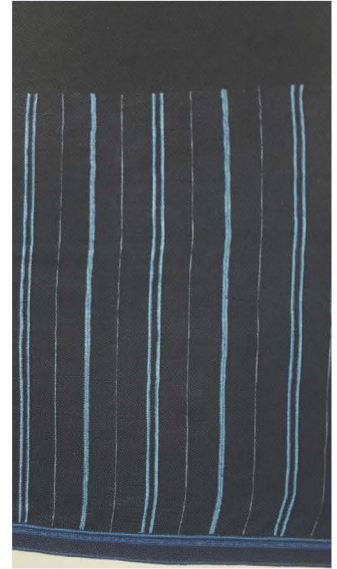
ซิ่นแดงโม ไททรงดำ (มีเชิง)

การทอซิ่นแดงโมของผู้หญิงไททรงดำในอดีต ที่มีการใช้เส้นฝ้าย หรือเส้นไหมสีแดงเป็นเส้นยืน และเส้นพุ่งเป็นสีดำนั้น มีตำนานมาจากเรื่องราวตั้งแต่โบราณกาลที่เล่าขานสืบต่อกันมาจากครั้งบรรพบุรุษว่า เมื่อหญิงชายที่แต่งงานอยู่กินด้วยกันและเมื่อผู้ชายในฐานะเป็นผู้นำครอบครัวจำเป็นต้องออกจากบ้านไปเข้าป่าเพื่อหาแหล่งที่ทำกินทำไร่ทำสวนเป็นเวลาหลายๆ วัน หญิงผู้เป็นภรรยาจะนั่งทอผ้าอยู่กับบ้าน รอคารกลับมาของสามี เมื่อเวลานั่งทอผ้าด้วยความรัก และการรอคอย ใจก็จะนึกถึงสามีที่เข้าป่าไปหลายวัน จึงมักจะนำเส้นด้ายเส้นยืนที่ใช้ทอผ้านั้น ย้อมด้วยสีแดง แทนความรักความคิดถึงชายผู้เป็นสามีที่จากไปนาน ส่วนเส้นพุ่งจะย้อมสีดำหรือ สีครามเข้มเกือบดำใช้แทนตัวเอง จนเมื่อทอเป็นผืนผ้าเส้นยืนที่เป็นสีแดงซึ่งจะมีขนาดเส้นเล็กกว่าเส้นพุ่งก็จะถูกทอทับด้วยเส้นพุ่งซึ่งมีขนาดใหญ่กว่าจนมืด แต่เมื่อเวลานำผ้าซิ่นไปใช้นุ่งผ้าซิ่นแดงโม เมื่อต้องแสงแดดจะมีความแวววับของเหลือบสีแดงจะสะท้อนสีออกมาได้อย่างชัดเจน เสมือนหนึ่งเป็นความหมายว่า ถึงแม้สามีที่จากไปจะซ่อนสีแดง