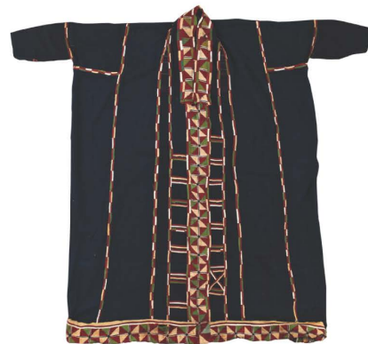
เสื้อฮีด้านใน

เสื้อฮี จึงมีความสำคัญกับวัฒนธรรมชาวไททรงดำมาก เพราะเป็นเสื้อที่จะต้องใส่ในเวลาที่มีพิธีกรรม และที่สำคัญที่สุดในวันตายจะต้องใส่เสื้อฮีของตัวเองไปด้วย ทั้งนี้เพราะมีความเชื่อกันว่า ถ้าใส่เสื้อฮีไปจะได้ไปพบญาติ พ่อ แม่ พี่ น้อง ที่ตายไปแล้ว จะได้จำกันได้ว่าเป็นเผ่าพันธุ์เดียวกัน ถ้าไม่ใส่ไป เชื่อว่าจะไม่ได้พบกับชาวไททรงดำทุกคนจึงต้องมีเสื้อฮีประจำตัว