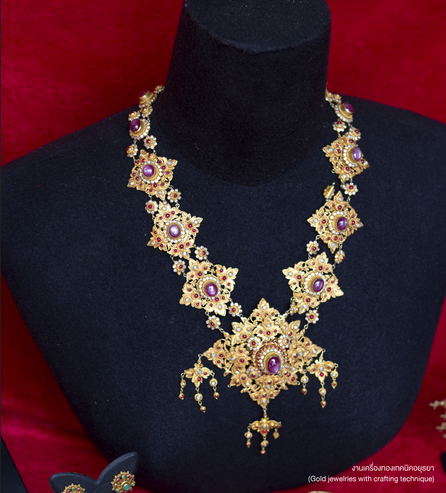
งานเครื่องทองเทคนิคอยุธยา (Gold jewelries with crafting technique)