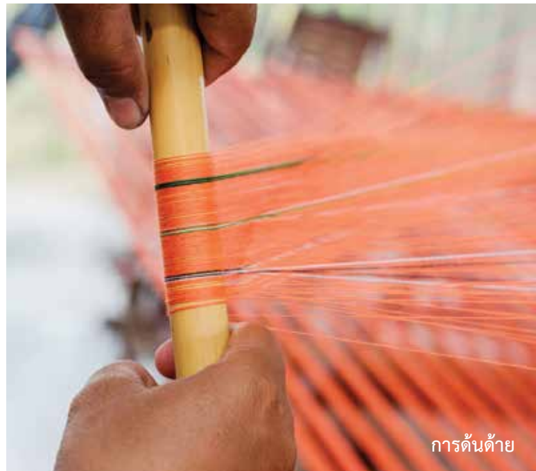
การคั่นด้วย