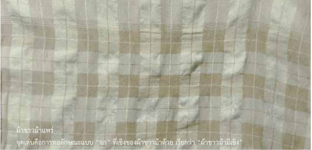
ผ้าขาวม้าแพร์

จุดเด่นคือการทอลักษณะแบบ “จก” ที่เชิงของผ้าขาวม้าด้วย เรียกว่า “ผ้าขาวม้ามี่เชิง”