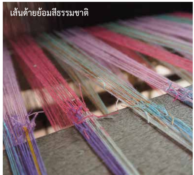
เส้นด้ายย้อมสีธรรมชาติ

ผ้าขาม้าของไทยมีลักษณะเป็นผ้ารูปสี่เหลี่ยมผืนผ้า ความกว้างประมาณ 2 ศอก ยาวประมาณ 3-4 ศอก (ในปัจจุบันขนาดความกว้าง ความยาว นิยมใช้หน่วยวัดเป็นเมตร หรือความกว้าง ความยาวที่จะแตกต่างกันออกไปตามแต่ละท้องถิ่น) โดยมากทอเป็นลายตารางเล็กๆ นิยมใช้ด้ายหลายสี หรือบ้างก็เป็นผ้าสีเดี๋ยวกมี ผ้าขาม้าในประเทศไทยมีชื่อเรียกแตกต่างกันขึ้นอยู่กับท้องถิ่น ส่วนสีและลวดลายของผ้าขาม้าก็อาจจะแตกต่างกันไปตามความนิยมของท้องถิ่นเช่นเดียวกัน เช่น ทางภาคกลาง ผ้าขาม้ามักนิยมลวดลายที่มีลักษณะเป็นลายตารางหมากรุก ส่วนทางภาคอีสานอาจจะจะเป็นแบบตารางเล็กๆ ละเอียด เป็นต้น