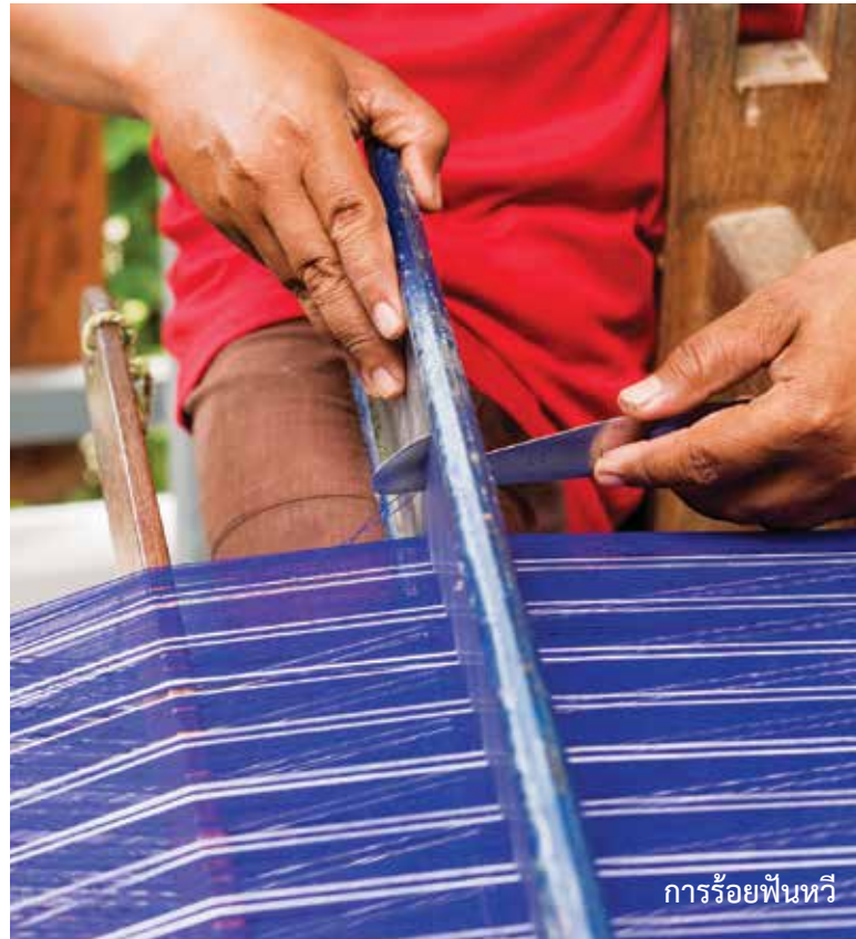
การร้อยพันหวี

4.การร้าว คือ การเก็บด้ายที่ละเส้นจากหลอดบนม้าย่างมาพันไว้ที่นิ้วมือเป็นขั้นตอนหนึ่งในการคั่นด้าย เมื่อคั่นด้ายเที่ยวแรก(เที่ยวไป)ครบทุกหลัก ตามจำนวนความยาวของผ้าที่จะทอแล้วต้อง “ร้าว” 1 ครั้ง วิธีการร้าวเริ่มด้วยการใช้นิ้วเกี่ยวด้ายทุกเส้นจากหลอดบนม้าย่างมาไขว้ที่ปลายนิ้วโป้ง ตามลำดับจากบนลงล่าง ไขว้ไปขวาเมื่อเกี่ยวด้ายครบทุกหลอดนับเป็นการร้าว 1 ครั้ง ในการทอผ้า 50 ผืน จะต้องร้าว 8 ครั้ง หากทอผ้า 80 ผืน ต้องร้าว 10 ครั้งเดินคั่นด้ายเที่ยวที่ 2 (เที่ยวกลับ) ให้ครบทุกหลักจนมาบรรจบกับหลักเริ่มต้นบนม้าย่าง เป็นการจบการเดินคั่นด้าย 1 เที่ยวทำเช่นนี้สลับกันไปจนครบตามจำนวนความยาวที่ต้องการเมื่อครบแล้วจึงปลดด้ายออกจากม้าย่าง ด้วยการถักเปียกลุ่มด้ายที่คั่นแล้วให้เป็นห่วงโซ่ เพื่อไม่ให้ด้ายพันกันและสะดวกต่อการนำด้ายไปทำในขั้นตอนต่อไป