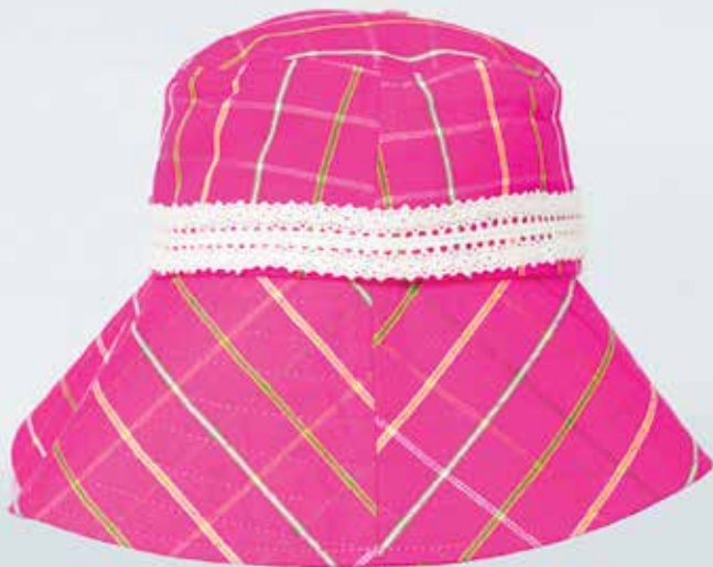
หมวกผ้าขาวม้า