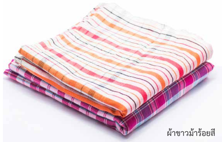
ผ้าขาวม้าร้อยสี

ผ้าขาวม้า เป็นผ้าทอพื้นบ้านสารพัดประโยชน์ที่คนไทยใช้ในชีวิตประจำวัน มีลักษณะเป็นรูปสี่เหลี่ยมผืนผ้า ความกว้างประมาณ 2 ศอก ยาวประมาณ 3-4 ศอก โดยมากมักทอเป็นลายตารางเล็กๆ นิยมใช้ด้ายหลายสี ซึ่งเป็นเส้นใยฝ้าย หรือ เส้นใยไหม แต่ผ้าขาวม้าส่วนมากนิยมทอจากเส้นใยฝ้าย ผ้าขาวม้าในประเทศไทยมีชื่อเรียกแตกต่างกัน ขึ้นอยู่กับท้องถิ่น สีและลวดลายของผ้าขาวม้าก็จะแตกต่างกันไปตามความนิยมของท้องถิ่น