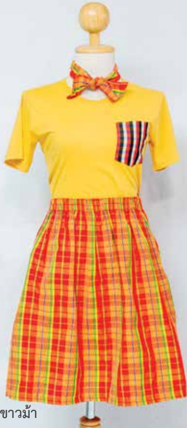
กระโปรงผ้าขาวม้า