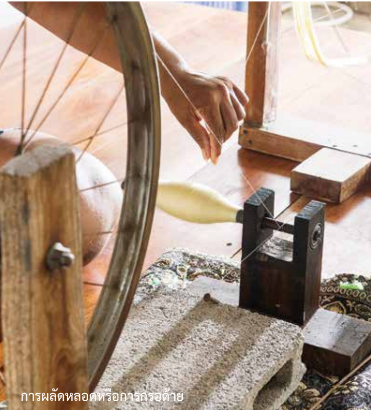
การผลัดหลอดหรือการกรอด้วย