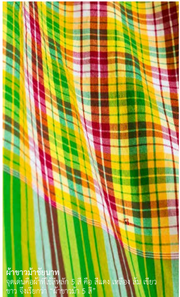
ผ้าขาวม้าชัยนาท

ผ้าขาวม้าลพบุรี อำเภอบ้านหมี่ จัดได้ว่าเป็นแหล่งทอผ้าพื้นเมืองที่ใหญ่ที่สุดในประเทศไทย ลักษณะผ้าดั้งเดิมของอำเภอบ้านหมี่จะมีเอกลักษณ์เฉพาะตัว เช่น ลายไส้ปลาไหล ลายตาม่อง เพราะชาวบ้านหมี่เป็นชาวไทยพวนที่อพยพมาจากประเทศลาว ผ้าขาวม้าของที่นี่จึงเป็นผ้าที่มีลวดลาย สีสดใสสวยงามและเป็นผ้าทอมือที่มีความประณีตสูง