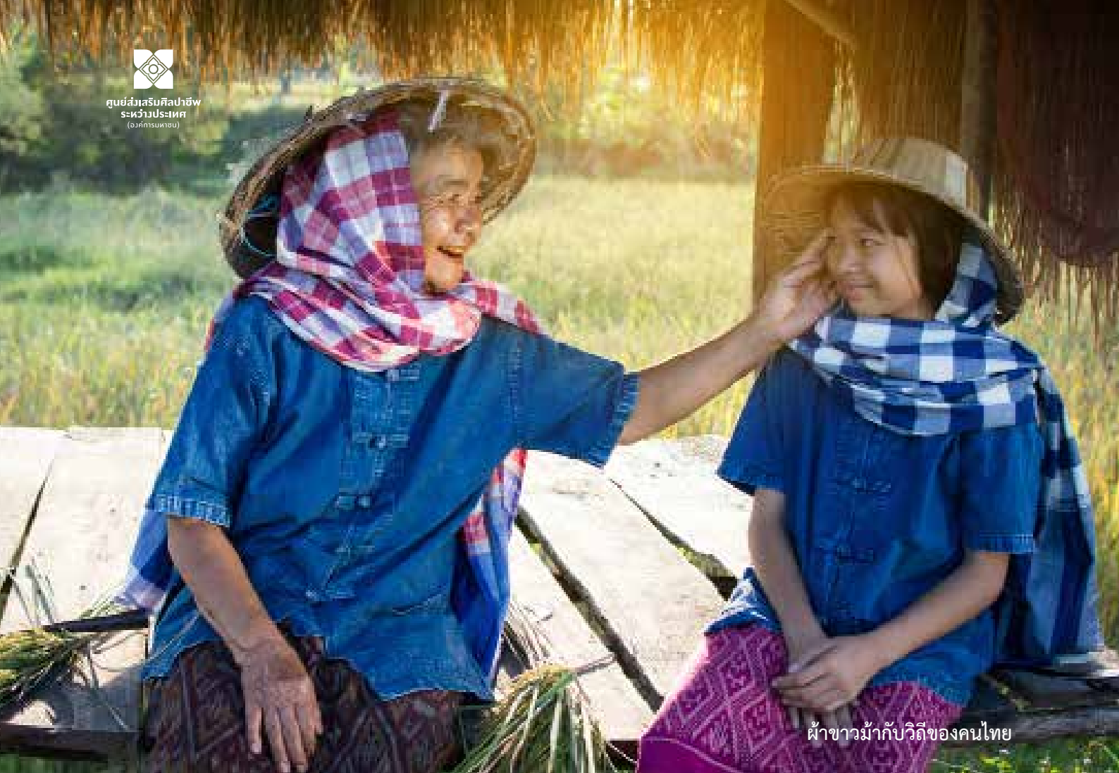
ผ้าขาวม้ากับวิถีของคนไทย