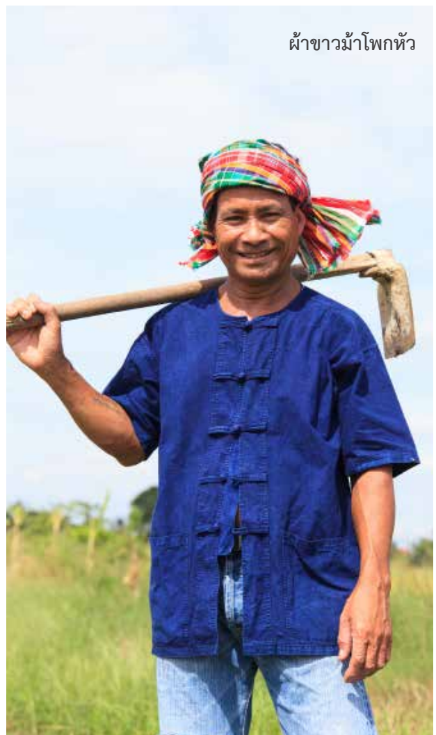
ฝ้าชาวม้าโพกหัว

จากหลักฐานข้อมูลที่ปรากฏจากแหล่งต่าง ๆ แสดงให้เห็นว้าฝ้าชาวม้าเป็นฝ้าโบราณที่ใช้ประโยชน์กันมานาน คนไทยรู้จักใช้ฝ้าชาวม้ามาตั้งแต่ว้ามัยพุทธศตวรรษที่ 16 หากนับเวลาย้อนไป จะตรงกับยุคสมัยเชียงแสน ในยุคนี้ผู้หญิงมักนุงฝ้าลูง ส่วนผู้ชายเริ่มใช้ฝ้าเคียนเอว (คาคอเอว) ซึ่งได้วัฒนธรรมมาจากไทยใหญ่ (ชาวไทยใหญ่ใช้โพกศึระษะ) ส่วนไทยเราในขณะนั้นเมื่อเห็นประโยชน์ของฝ้าจึงนำมาใช้บ้าง แต่เปลี่ยนมาเป็นฝ้าเคียนเอว เมื่อเดินทางไกลจึงนำมาใช้เพื่อประโยชน์ต่าง ๆ เช่น ใช้ห่ออาวุธ ห่อเก็บสัมภาระในการเดินทาง ใช้ปูเป็นที่นอน ใช้นุงอาบน้ำ ใช้เช็ดร่างกาย เป็นต้น