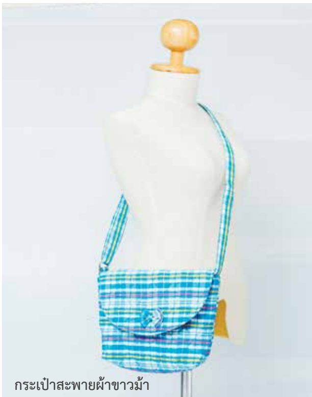
กระเป๋าสะพายผ้าขาวม้า