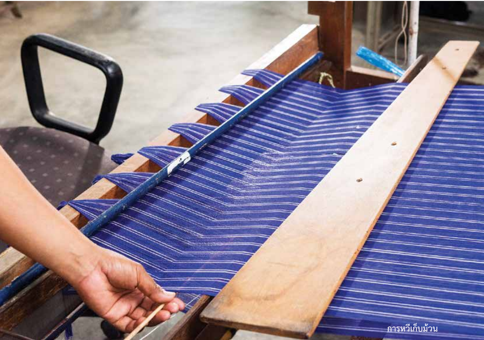
การทอเก็บม้วน

6. การทอเก็บม้วน เป็นการนำด้ายยืนที่ร้อยพันหวีหรือเข้าพืมแล้ว มาแผ่เส้นจากที่ถักเปียเป็นก่ายอยู่ให้กระจายออกพร้อมกับหวีเก็บเข้าไม้ม้วนผ้า ขั้นตอนนี้ต้องช่วยกัน 2-3 คน อุปกรณ์ที่ใช้ คือ ม้าหวี สำหรับวางซึ่งด้ายที่จะม้วนปลายด้านหนึ่งมีคานหัวม้วนซึ่งมีใบพัดสำหรับถักติดอยู่(บางแห่งเรียก ระหัดถักด้าย) อีกด้านหนึ่งมีม้าทับ(บางแห่งเรียก ม้าก้อปปี) สำหรับทับเส้นด้ายให้ตั้งสะดวกต่อการทอ ไม้ม้วนผ้า สำหรับม้วนเส้นด้ายที่ถูกแผ่กระจายออกให้เรียงเส้นเป็นระเบียบ พันหวี กะนัด (ไม้แบบ 2 อัน สำหรับขัดเส้นด้ายบน-ล่าง กันด้ายยุ่ง) ไม้เรียว(บางแห่งเรียก ไม้ควั่ว)