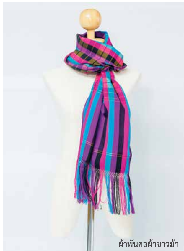
ผ้าพันคอผ้าขาวม้า