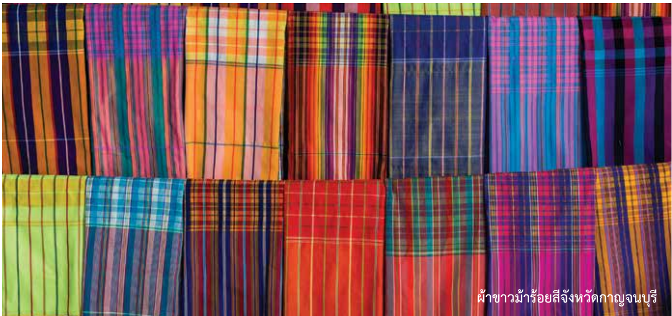
ผ้าขาม้าร้อยสีจังหวัดกาญจนบุรี

หลักฐานที่แสดงว่าคนไทยเริ่มใช้ผ้าขาม้าในสมัยเชียงแสน มีปรากฏให้เห็นจากภาพจิตรกรรมฝาผนังที่ วัดภูมินทร์ จังหวัดน่าน และเมื่อดูการแต่งกายของ หญิง - ชาย ไทยในสมัยอยุธยา จากภาพจิตรกรรมในสมุดภาพ “ไตรภูมิสมัยอยุธยา” เขียนขึ้นราวต้นศตวรรษที่ 22 จะเห็นได้ว่าชาวอยุธยานิยมใช้ผ้าคล้ายผ้าขาม้าพาดบ่า คาดพุง หรือนุ่งโจงกระเบนหรือใช้ผ้าขาม้าคล้องคอหลบห้อยชายทั้งสองข้างไว้ด้านหลัง สมัยรัตนโกสินทร์ชาวไทยทั้งชาย-หญิง นิยมใช้ผ้าขาม้ามาทำประโยชน์กันมากยิ่งขึ้น โดยไม่จำกัดแต่เพียงเพศชายอย่างเดียวเหมือนในอดีต และ ไม่จำกัดเฉพาะทำเป็นเครื่องตกแต่งร่างกายอย่างเดียว