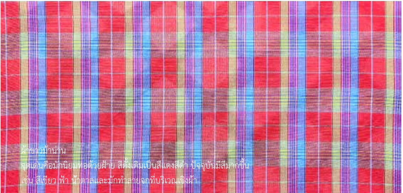
ผ้าขาวม้าน่าน

จุดเด่นคือการทอลักษณะแบบ “จก” ที่เชิงของผ้าขาวม้าด้วย เรียกว่า “ผ้าขาวม้ามี่เชิง”