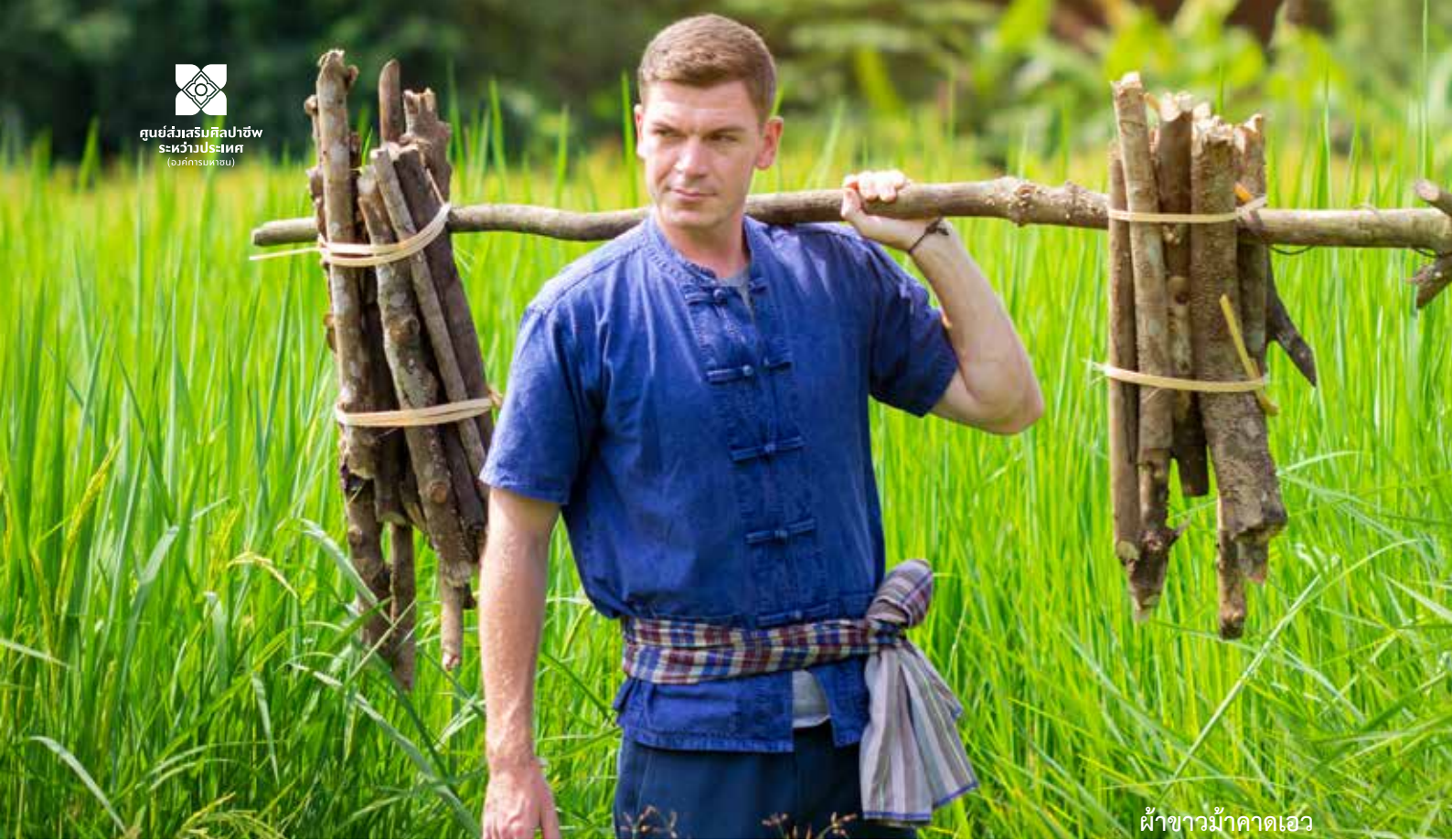
ฝ้าชาวม้าคาคอเอ