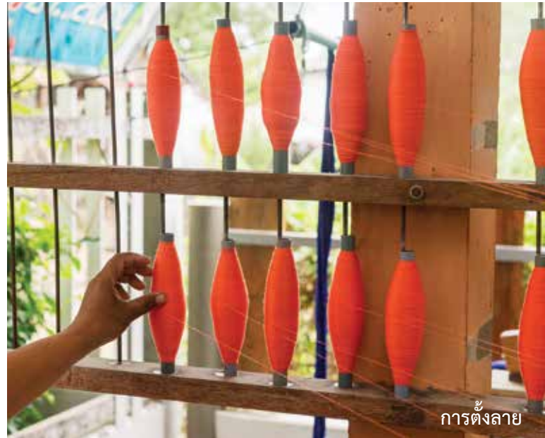
การตั้งลาย