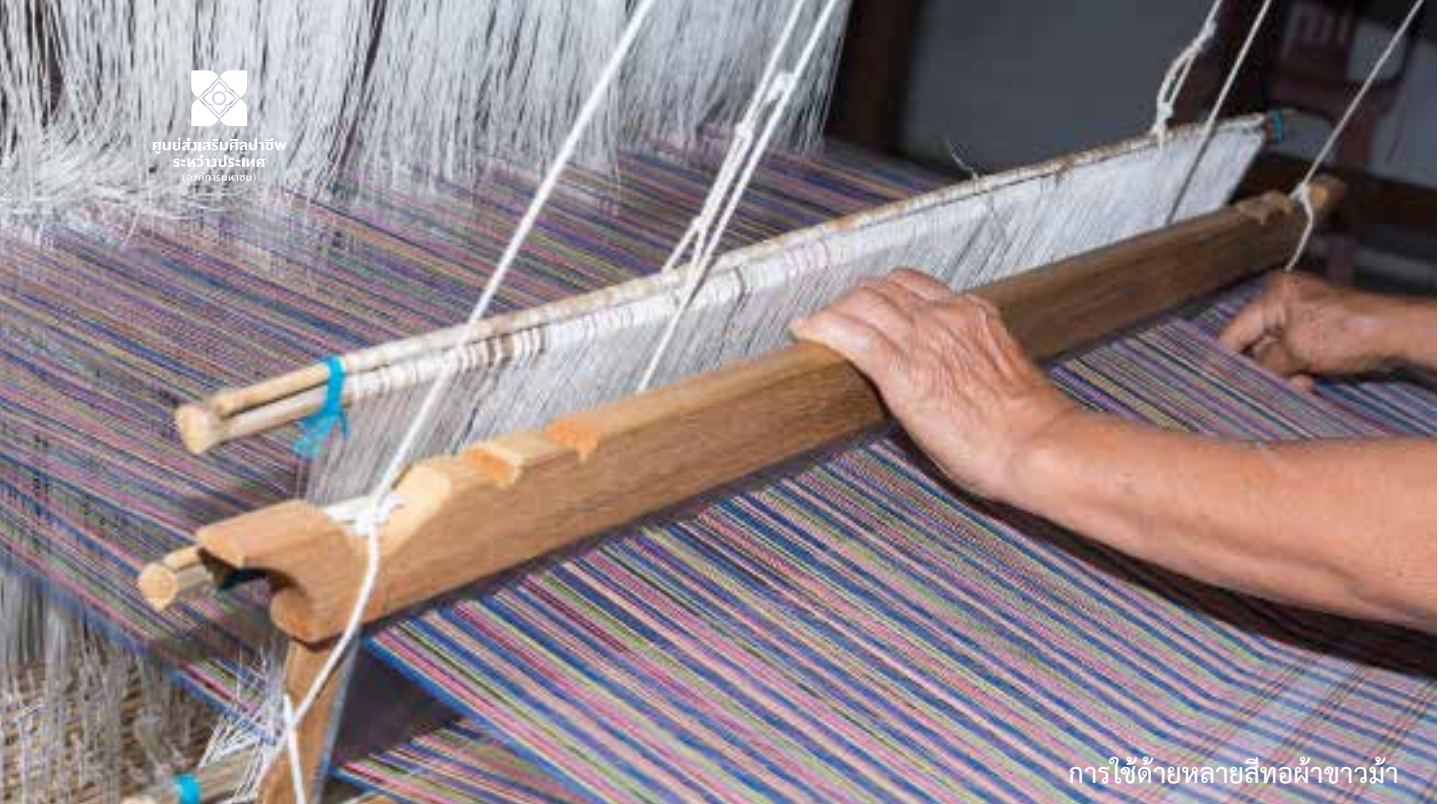
การใช้ด้ายหลายสีทอผ้าขาม้า