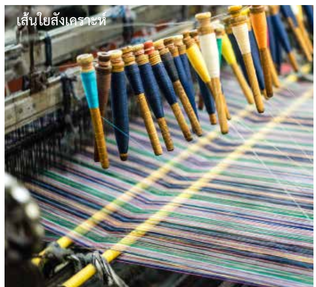
เส้นใยสังเคราะห์