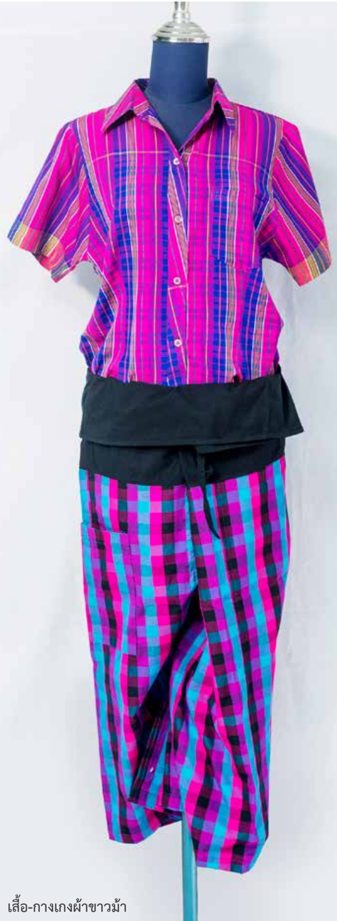
เสื้อ-กางเกงผ้าขาวม้า